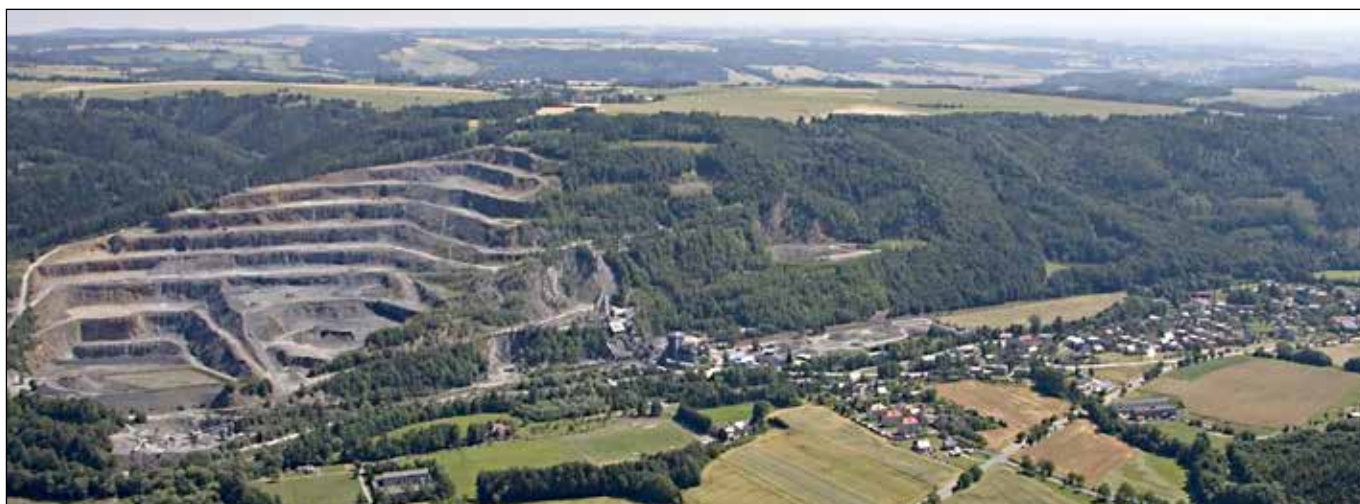
Letecký snímek: Obec Jakubčovice nad Odrou s kamenolomem.

Tímto článkem bych Vás rád seznámil s jedním z fenoménů Nížkého Jeseníku, který jsem podle věku různě vnímal a který mne provází od útlého dětství do současnosti. Tímto fenoménem je břidlice. Provedu Vás mým nazíráním na břidlici a pokusím se Vás „naočkovat“ zájmem o tuto zajímavou horninu i o místa, kde se v minulosti těžila.