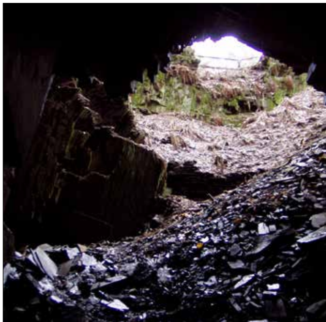
Přírodní památka Černý důl u Čermné ve Slezsku.