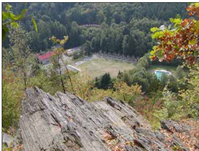
Skalní ostroh Orlí hnízdo (Čížavice) u Klokočova.

Mimo zátočin Odry mne fascinovala skalní vyhlídka nad Spálovským mlýnem a levým břehem Odry – Orlí hnízdo (nebo též Čížavice) u Klokočova. Je to skalní výchoz tvořený břidlicemi, z něhož je pěkný výhled do údolí Odry a kde by v budoucnosti měla stát betonová hráz vodní nádrže Spálov.