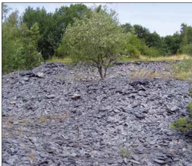
Výsypka zaniklého břidlicového lomu Pastviny u Jiříkova.

Při výpravách v Nížkém Jeseníku jsem si uvědomil, že místa zaniklé těžby břidlice neslouží jen jako zimoviště netopýrů, ale že v krajině plní i další významné funkce. Areály bývalé těžby břidlice ať v podzemních štolách a dolech, nebo v povrchových lomech byly vždy doprovázeny výsypkami odpadové břidlice, které postupně pohlcuje příroda. V zemědělsky i lesnicky intenzívně obdělávané krajině Nížkého Jeseníku místa bývalé těžby břidlice vytváří ostrůvky přírody, která se zde může poměrně nerušeně vyvíjet. Místa po těžbě břidlice tak nejsou zajímavá jen mineralogicky, geomorfologicky, ale i botanicky a zoologicky a jsou i atraktivní pro rekreaci. Proto si Vám dovoluji představit několik zajímavých lokalit po těžbě břidlic v blízkém i vzdálenějším okolí Oder tak, jak jsem je na poznávacích výpravách vnímal.