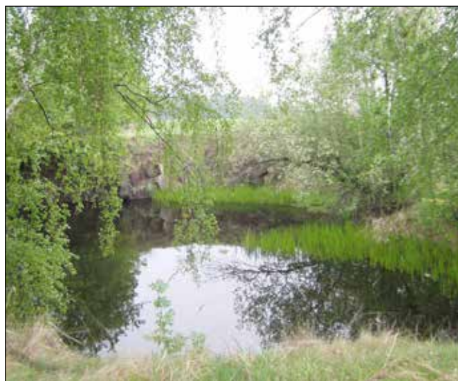
Jezírko u železniční zastávky Čermná ve Slezsku.