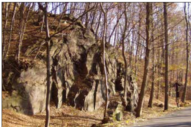
Přírodní památka Vrásový soubor u Klokočůvku.

Mimo výletů jsem rád trávil prázdniny u prarodičů v Klokočůvku, kde jsme podnikali výpravy do okolí. I zde mne okouzly některé zajímavé skalní útvary budované břidlicemi. Jeden z nich – přírodní památku Vrásový soubor u Klokočůvku (některými odborníky nazývaný „Malý Barrandien“) - můžete obdivovat napravo od cesty vedoucí z Klokočůvka údolím řeky Odry k poutnímu místu Skála P. Marie. Jedná se o hluboce provrásněný skalní výchoz tvořený jílovitými břidlicemi, prachovci (siltovci) a drobami s malou skalní dutinou, v níž má podle pověsti sídlit drak.