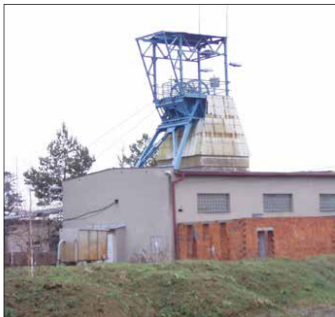
Hlubinný důl ve Lhotce u Vítkova.

V té době ještě v Nížkém Jeseníku fungovala důlní díla, v nichž se břidlice těžila i zpracovávala. Jedním z nich byla štola u Svatoňovic v údolí říčky Budišovky, kde se v roce 1989 konalo první mistrovství ČSSR ve štípání břidlice. Druhým byl donedávna činný hlubinný důl ve Lhotce u Vítkova. Ten je vybaven klasickou těžní věží a ještě před ukončením provozu bylo možno se např. při pochodech pořádaných městem Vítkovem podívat do jeho podzemí. Smutnou skutečností je, že naši domácí břidlici cenově vytlačila břidlice ze Španělska, z Německa a dokonce i z Číny. Cizí břidlicí se tak pokrývají i střechy památek stojících v Nížkém Jeseníku.