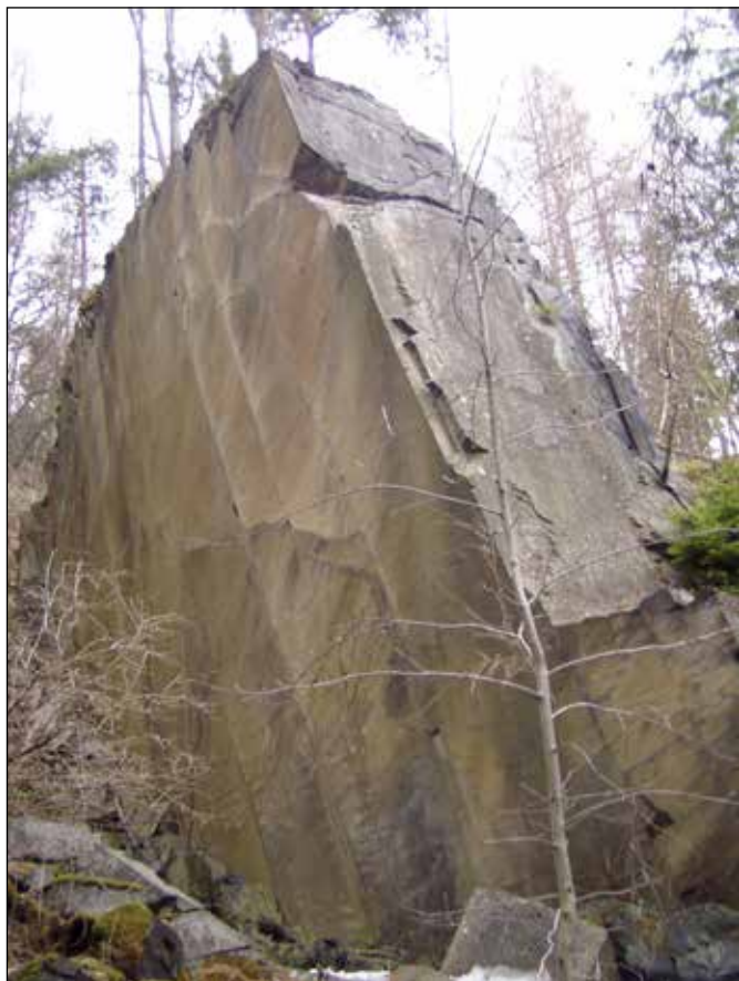
Šikmá břidlicová stěna u Dvorců v údolí říčky Lomnice.