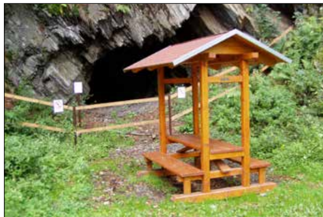
Peklo u Spálova.

I další „břidlicové“ zajímavosti jsem objevil u městyse Spálova – malé skalní sluje po těžbě pokrývačských břidlic Peklo a Petrovu skálu. Peklo se nachází na lesní cestě nad Skálou P. Marie, kdežto Petrova skála se nachází u levostranného přítoku potoka Suché nad hlavní silnicí vedoucí od Jakubčovic n. O. na Poštát. Petrova skála je nejen podzemním prostorem, ale je zajímavá především pěknou ledovou výzdobou, která se zde vytváří za příhodných podmínek na konci zimy.