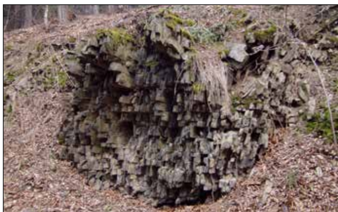
Roubíkovitá břidlice v Pecově u Klokočůvku.

Mimo údolí řeky Odry jsme s tatínkem vyráželi na další vzdálenější zajímavá místa. Okouzila mne magická Švédská skála u Spálova nad pravým břehem řeky Odry nad železniční zastávkou Heřmánky, kterou tvoří skalnatý ostroh z břidlic a kde Lesy ČR s. p. zřídily dřevěný krytý altánek umožňující výhled do údolí Odry k Heřmánkám a k jakubčovickému kamenolomu nebo do údolí říčky Čermné.