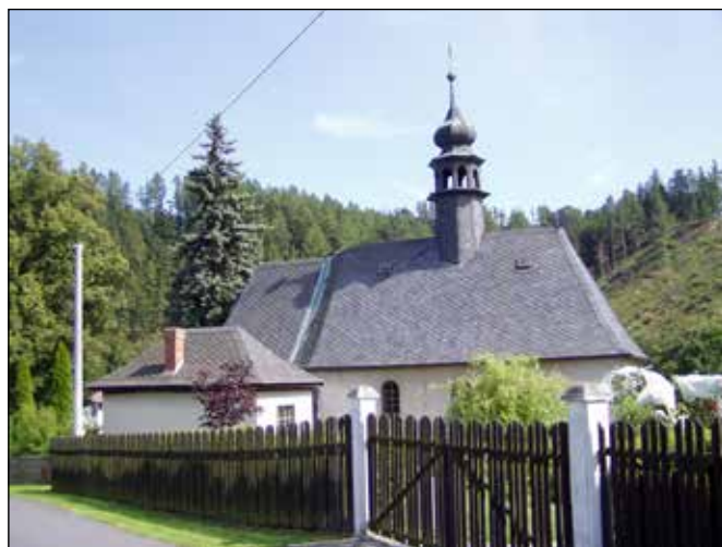
Břidlicové střechy kostela v Kružběrku.