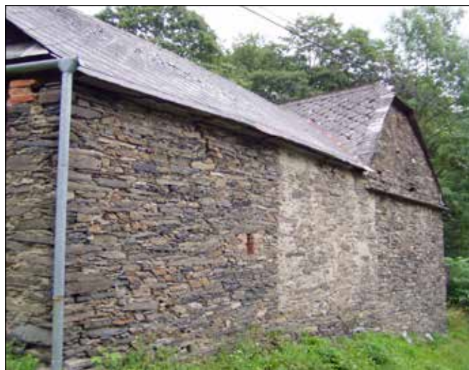
Kamenný dům v Podlesí.