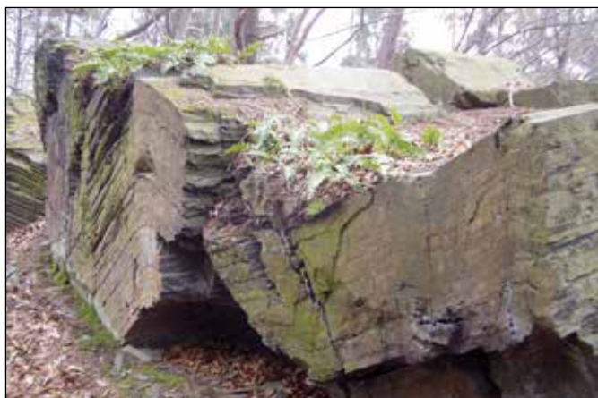
Skalní kniha v Pecově u Klokočůvku.

Další skalní útvar zvaný „Skalní kniha“ a zajímavý výchoz roubíkovitých břidlic najdete v lese nad levým břehem Pecovského potoka severně od Klokočůvka. U Skalní knihy jsme si hrávali na schovávanou a do Pecova jsme chodili na houby.