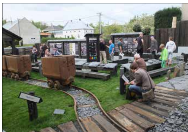
Expozice Muzea břidlice v Budišově nad Budišovkou.