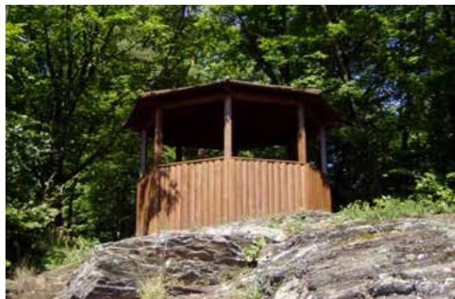
Švédská skála u Spálova.

Mimo údolí řeky Odry jsme s tatínkem vyráželi na další vzdálenější zajímavá místa. Okouzila mne magická Švédská skála u Spálova nad pravým břehem řeky Odry nad železniční zastávkou Heřmánky, kterou tvoří skalnatý ostroh z břidlic a kde Lesy ČR s. p. zřídily dřevěný krytý altánek umožňující výhled do údolí Odry k Heřmánkám a k jakubčovickému kamenolomu nebo do údolí říčky Čermné.