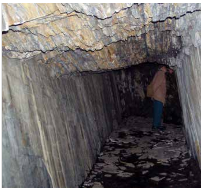
Štola u železniční zastávky Klokočov.

S kamarády ochránáři jsme začali systematicky poznávat Odersko i jeho širší okolí. To nás mimo jiné dovedlo i do oderského podzemí opuštěných břidlicových štol na Veselském kopci nad Odrami. V té době jsme ještě moc neřešili nebezpečí takových výprav a obdivovali jsme krásu břidlicového podzemí. Kromě oderských štol nás lákalo podzemí i na Vítkovsku, například v okolí Klokočova a později i Starých Oldřůvek. V roce 1992 jsem začal pracovat na Městském úřadu v Odrách a svůj zájem o přírodu jsem povýšil na zaměstnání. Při profesionální ochraně přírody jsem se mj. dostal k ochraně našich letounů (netopýrů a vrápenců) – jediných létajících savců, a přes ně opět k opuštěným důlním dílům, které tyto chránění živočichové využívají především jako zimní úkryty. Přitom jsem se setkal s odborníky zabývajícími se letouny i podzemím – například se speleology vedenými Josefem Wagnerem z bohumínského spolku Orcus ( http://www.orcus-speleo.cz/ ). Ti mají pečlivě prozkoumané podzemí Nízkého Jeseníku a zapojují se do sledování výskytu netopýrů i vrápenců. Později jsem se sám stal členem České společnosti pro ochranu netopýrů – ČESON ( http://www.ceson.org/ ), která se ochranou a pozorováním letounů odborně zabývá.