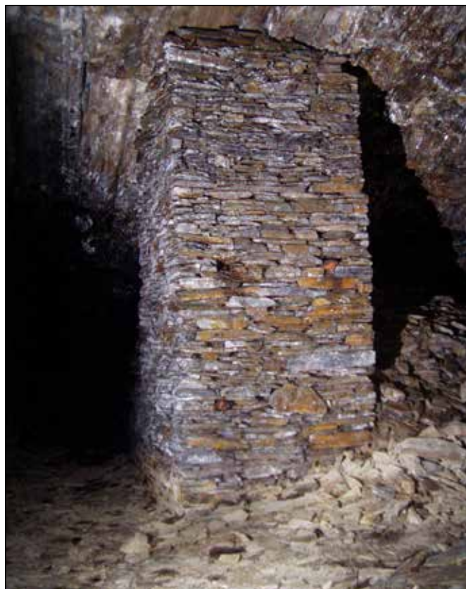
Interiér štoly u Starých Oldřůvek.