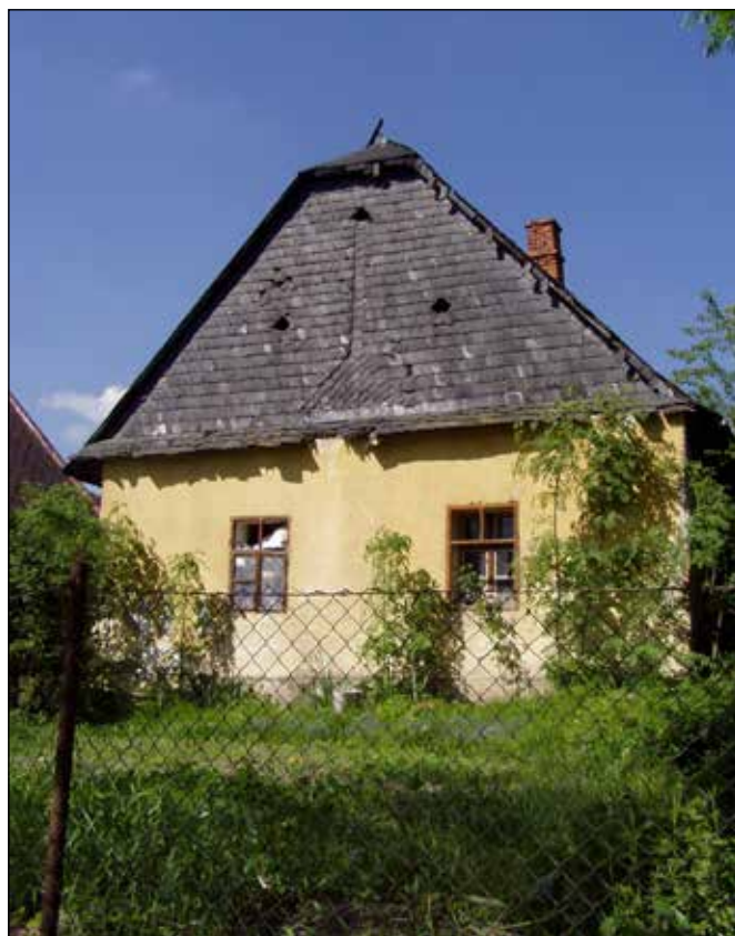
Břidlicový štít dnes již zbouraného výměnku v Klokočůvku.

V tu dobu jsem začal vnímat i domy a další objekty s břidlicovými střechami, poněvadž venkovská lidová architektura mne spolu s technickými památkami z našeho kulturního dědictví oslovovala vždy nejvíce. Už v době mého mládí těch střech na Odersku nebylo mnoho a do současnosti se jich dochovalo ještě méně. Až později při delších výletech jsem objevil krásu zídek i celých stodol zděných z břidlice, které je možno dodnes obdivovat na Vítkovsku a Budišovsku.