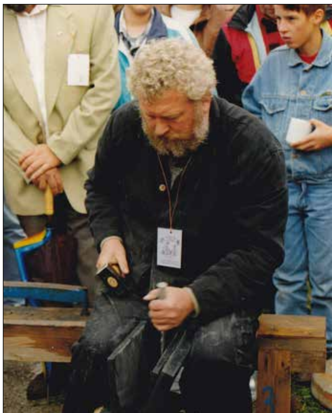
Štípání břidlice 2002.

V té době ještě v Nížkém Jeseníku fungovala důlní díla, v nichž se břidlice těžila i zpracovávala. Jedním z nich byla štola u Svatoňovic v údolí říčky Budišovky, kde se v roce 1989 konalo první mistrovství ČSSR ve štípání břidlice. Druhým byl donedávna činný hlubinný důl ve Lhotce u Vítkova. Ten je vybaven klasickou těžní věží a ještě před ukončením provozu bylo možno se např. při pochodech pořádaných městem Vítkovem podívat do jeho podzemí. Smutnou skutečností je, že naši domácí břidlici cenově vytlačila břidlice ze Španělska, z Německa a dokonce i z Číny. Cizí břidlicí se tak pokrývají i střechy památek stojících v Nížkém Jeseníku.