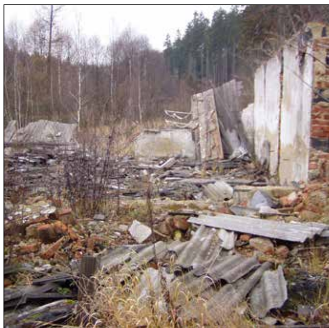
Štola u Svatoňovic v době jejího zániku.