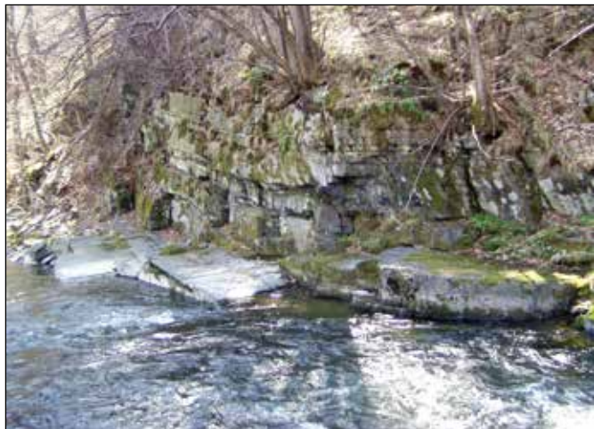
Kamenité břehy a zátočiny řeky Odry u Klokočůvku (u penzionu „Švamlův mlýn“ a nad Skálou P. Marie) a koupání v nich.

Jelikož mě příroda a krajina v okolí Jakubčovic n. O. stále více zajímala, moc rád jsem s rodiči vyrážel na víkendové výlety do údolí řeky Odry v okolí Klokočůvku i jinde. Při těchto výletech jsem potkával břidlici v další podobě - v nádherných zátočinách Odry např. u nynějšího penzionu „Švamlův mlýn“, nad poutním místem Skála P. Marie u Spálova nebo ještě výše proti proudu blíže vojenskému prostoru Libavá. Zátočiny na řece Odře jsem vnímal tehdy i dnes jako kouzelná místa, která se navíc hodí k přírodnímu koupání a osvěžení v letním horku.