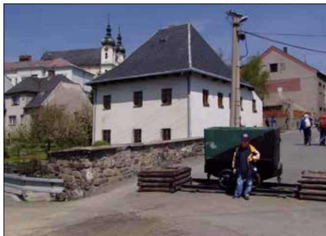
Městské muzeum břidlice v Budišově nad Budišovkou.