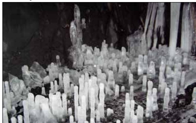
Ledová výzdoba v Petrově skále u Spálova.