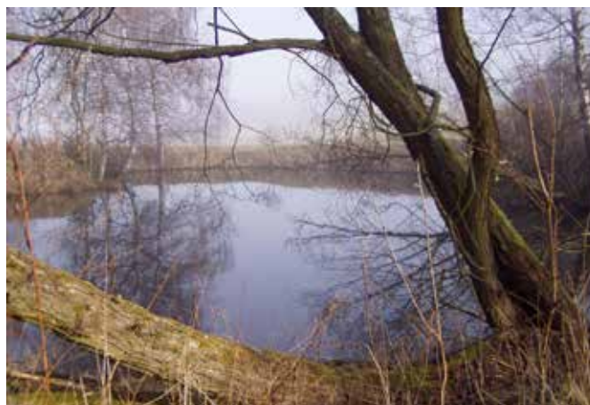
Jezírko u kružberské přehrady.

- Soudkova štola poblíž osady Boňkov mezi Potštátem a Hranicemi (regionálně významné zimoviště vrápence malého).