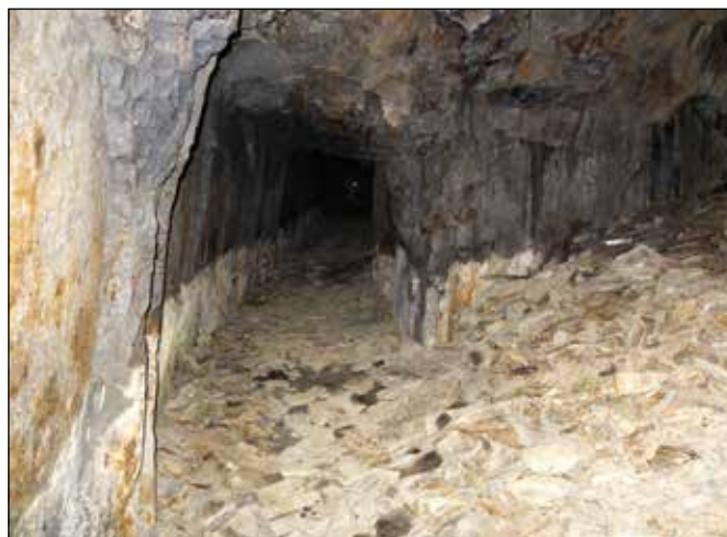
Interiér štoly u Starých Oldřůvek.

Mimopracovně jsme s oderskými ochránci přírody (členy ZO ČSOP Odry ev. č. 70/13) pořádali poznávací pěší a cyklistické výlety i autobusové zájezdy do stále větší vzdálenosti od Oder, při nichž jsme poznávali další lokality po těžbě břidlice i jiná zajímavá místa. Při jedné z takových výprav k Černému dolu u Černé ve Slezsku jsme se poprvé setkali s dalším člověkem, pro nějž je břidlice srdeční záležitostí – s RNDr. Stanislavem Staňkem ze Zlatých Hor. S ním a za jeho velké pomoci jsme v letech 1998 a 2001 uspořádali dvě Mistrovství ČR ve štipání břidlice ve Spálovském mlýně, při nichž soutěžili profesionálové i amatéři a i pouzí návštěvníci si mohli štipání břidlice vyzkoušet. Při mistrovství v roce 1998 ve spolupráci s tehdejším Referátem životního prostředí Okresního úřadu v Novém Jičíně došlo k vyhlášení přírodní památky Vrásový soubor u Klokočůvku, pro níž odborné geologické podklady zpracoval právě RNDr. Staňk.