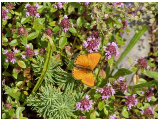
Ostruháček na mateřídoušce v Pastvinách.

Začnu lokalitami zajímavými geomorfologicky. V ohbí řeky Odry se u Starých Oldřůvek na území Vojenského újezdu Libavá nachází štola s jedním z nejmohutnějších vstupů. Štola ve stejně mohutném profilu pokračuje do kopce přes sto metrů. Před štolou můžete obdivovat obrovský odval odpadní břidlice, který končí zídkou nad levým břehem Odry. Poblíž této štoly naleznete po spádnicí ubíhající skalní žebra.