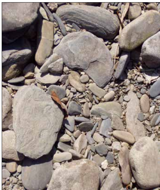
Detail kamenitého sedimentu dna řeky Odry.

kamínky nás za mládí sváděly k jejich házení na hladinu Odry a vytváření tzv. žabek. Komu se vícekrát kamínek od hladiny odrazil, ten byl lepší.