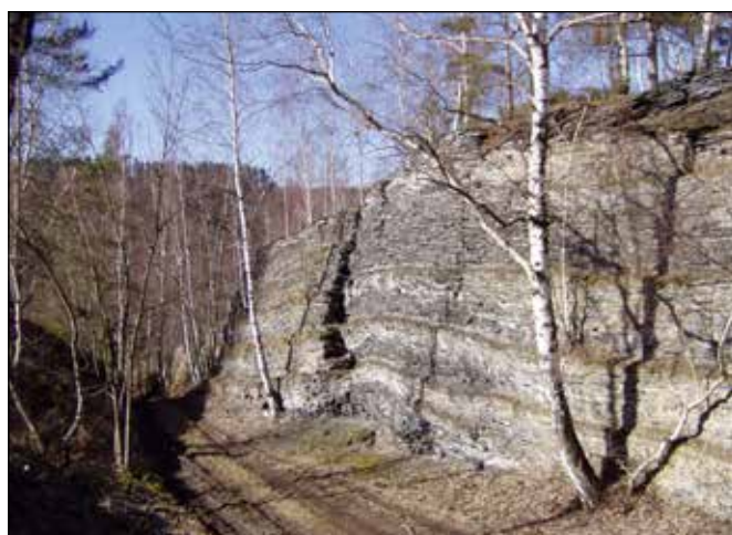
Evropsky významná lokalita Zálužná.