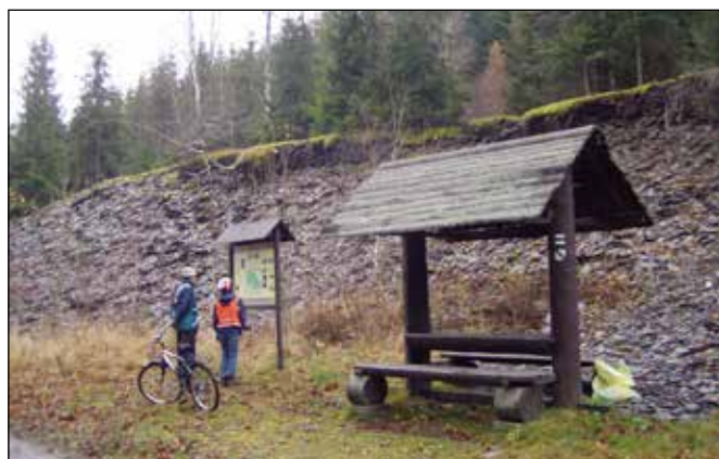
Naučná stezka břidlice v Budišově nad Budišovkou.