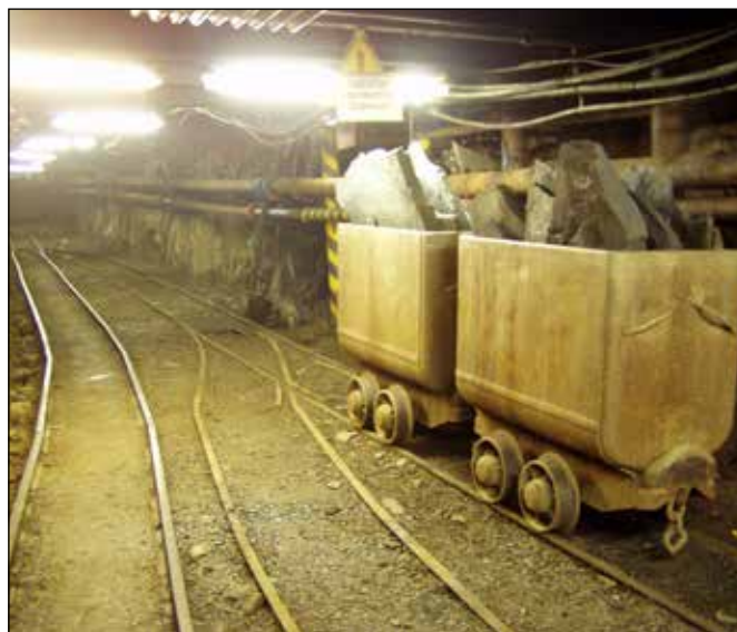
Interiér dolu ve Lhotce u Vítkova.