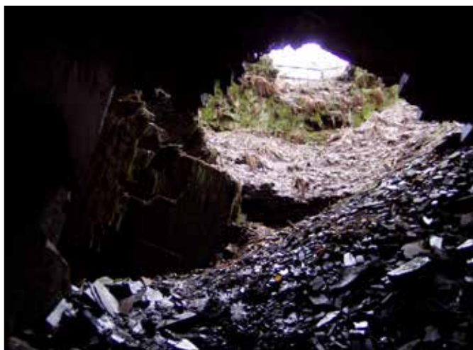
Přírodní památka Černý důl u Čermné ve Slezsku.

V Nížkém Jeseníku se jedná o tyto Evropsky významné lokality (EVL):