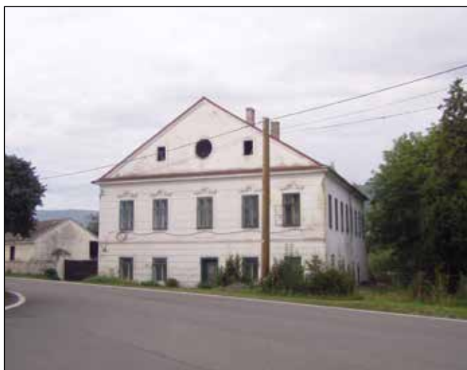
Bývalé fojství v Heřmánkách.