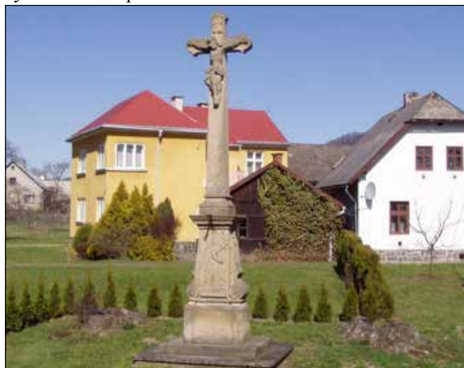
Pískovcový kříž v Loučkách.

K tomuto mlýnu historicky patří i pískovcový kříž, stojící v zahradě před domem po pravé straně cyklotrasy za mostem přes Odru.