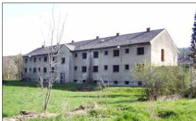
Budova bývalé střelnice využívaná jako paintballová střelnice.

Na levé straně Sportovní ulice stojí budova bývalé věznice, která je v současnosti využívána jako paintballová střelnice – Alcatraz prison ( http://www.paintballite.cz/hriste/alcatraz-jakubcovice-nad-odrou.html ).