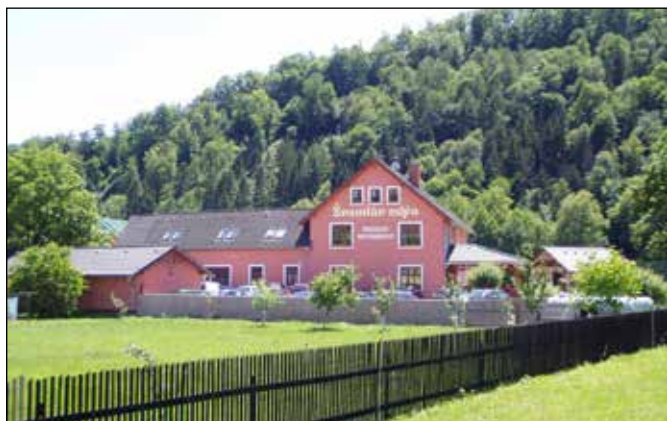
Penzion a restaurace Švamlův mlýn.