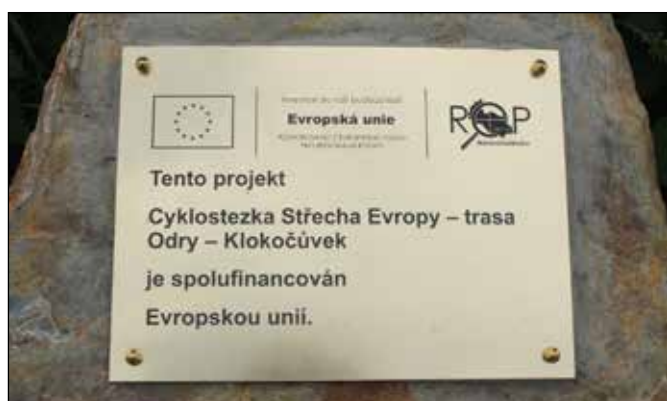
Pamětní deska k projektu na začátku cyklostezky.

V červenci byly mezi městem Ody a jeho místní částí Klokočůvek dokončeny nové úseky cyklostezky „Střecha Evropy“, která je v terénu vyznačena jako součást regionální cyklotrasy č. 503 „Odersko“. Ta začíná ve Starém Jičíně, prochází Moravskou bránou a pak protíná kolem přehrady Slezská Harta celý Nizký Jeseník a končí u Krnova. Nově otevřené úseky umožní vyhnout se úzké ulici Nadační v Odřích, kde se cyklisté stěželi vyhýbali autům, a především nabídnou bezpečnější jízdu z Jakubčovic n. O. do Heřmáněk a dále do Klokočůvku mimo hlavní silnici II/442. V tomto článku si vám dovoluji nabídnout přehled zajímavostí, které podél těchto nových úseků cyklotrasy můžete vidět.