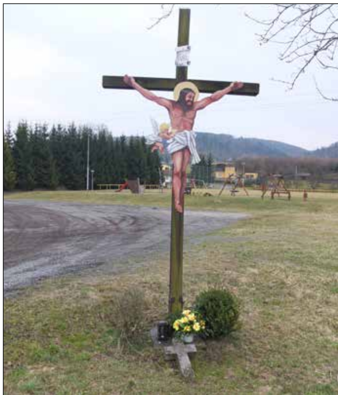
Dřevěný kříž s dětským hřištěm v pozadí.

Po levé straně cyklotrasy u dětského hřiště stojí dřevěný kříž obnovený po Sametové revoluci.