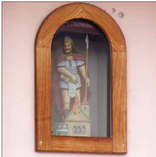
Soška sv. Floriána na hasičské zbrojnici.

Naproti hospodě u řeky Odry stojí hasičská zbrojnice a na ní můžete shlédnout prvorepublikovou kamennou pamětní desku se jmény pěti jakubčovických hasičů padlých v 1. světové válce a dřevěnou sošku sv. Floriána v proskleném výklenku.