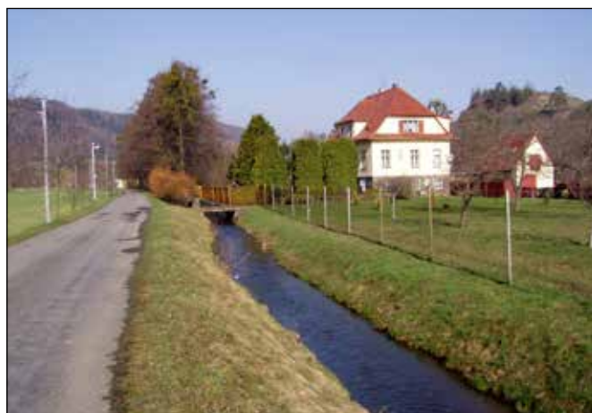
Náhon na ulici Sportovní s vilkou v pozadí.

Dále pojedete v souběhu s náhonem, v němž žijí chráněné mihule potoční, raci říční a střevle potoční. Po pravé straně za náhonem se vyjímá pěkná prvorepubliková vilka zakladatele jakubčovického kamenolomu.