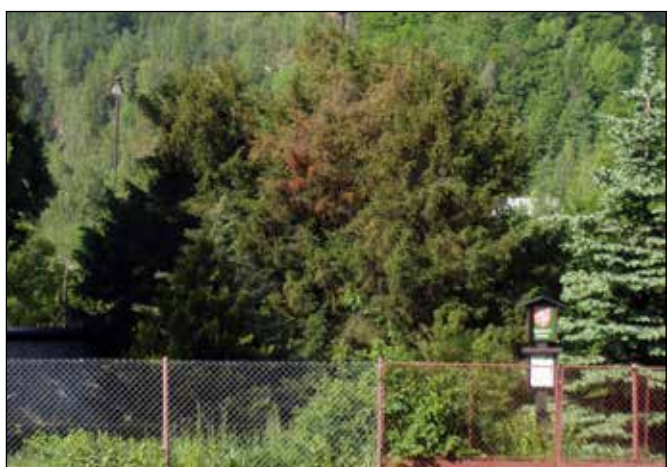
Památný strom Tomčíkův tis v Heřmánkách.

Přes silnici naproti hospodě stojí památkově chráněné bývalé fojství, které prochází rozsáhlou rekonstrukcí a v jehož zahradě roste památný strom „Tomčíkův tis“ – tis červený s obvodem kmene asi 240 cm. Za hospodou se nachází hřbitov s památkově chráněnou hřbitovní zdí a filiálním kostelem Neposkvrněného Početí P. Marie. Na hřbitově je zřízeno pamětní místo věnované původním obyvatelům Heřmánek německé národnosti a při vstupu na hřbitov je pochován neznámý sovětský zajatec ubitý fašisty za 2. světové války.