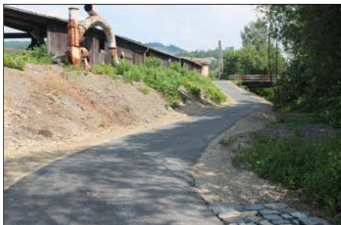
Nový úsek cyklostezky v Heřmánkách u dřevoskladu.

My se ale vraťme k popisu zajímavostí okolo nově zřízeného úseku cyklotrasy č. 503 „Odersko“. U mostu přes řeku Odru odbočte na novou cyklostezku zřízenou mezi areálem dřevoskladu a levým břehem řeky Odry.