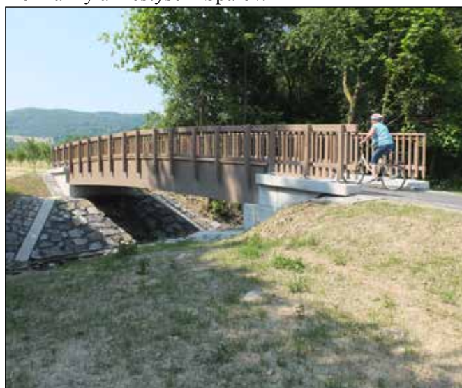
Nový dřevěný mostek přes potok Čermnou na cyklostezce.

Za železniční zastávkou Heřmánky nová cyklostezka pokračuje k pěknému novému dřevěnému mostku přes potok Čermnou, který je katastrální hranicí mezi obcí Heřmánky a městysem Spálov.