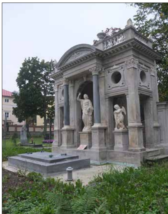
Zrekonstruovaná Gerlichova hrobka na městském hřbitově.