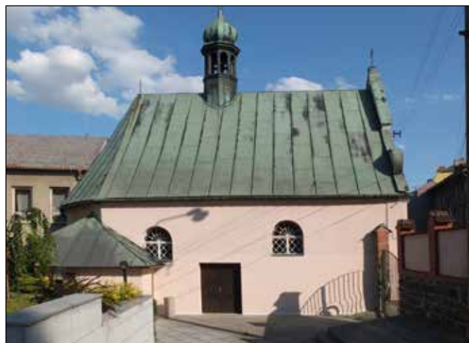
Hřbitovní kaple Sv. Rodiny na Nadační ulici.

Popis trasy začneme v Odřích na Nadační ulici u městské nemocnice. Pokud nespěcháte, doporučuji vám projít si vedle kola oderský hřbitov. Na hřbitově můžete obdivovat památkově chráněnou hřbitovní kapli sv. Rodiny u hlavního vstupu, centrální lipovou alej, dvě opravené památkově chráněné hrobky - rodiny Gerlichovy a Behnheierovy. Za prohlídku stojí i Urnový háj, nedávno zřízený památník obětem I. světové války a některé starší náhrobky bývalých obyvatel Oder. Ze hřbitova se na cyklotrasu dostanete zadní brankou u márnice.