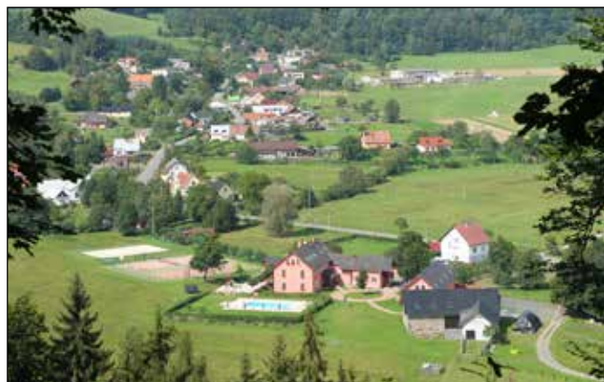
Pohled na penzion Švamlův mlýn s obcí Klokočůvek.