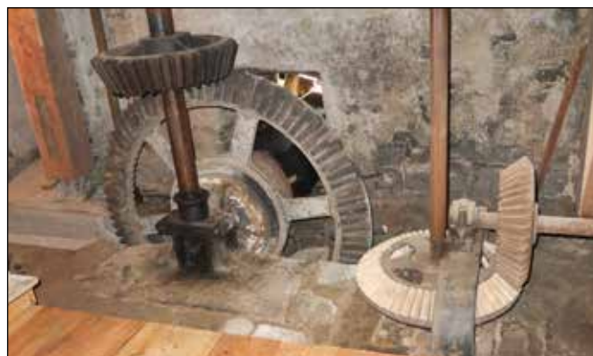
Expozice ve vodním mlýně - část zachovalé mlýnské technologie.

K tomuto mlýnu historicky patří i pískovcový kříž, stojící v zahradě před domem po pravé straně cyklotrasy za mostem přes Odru.