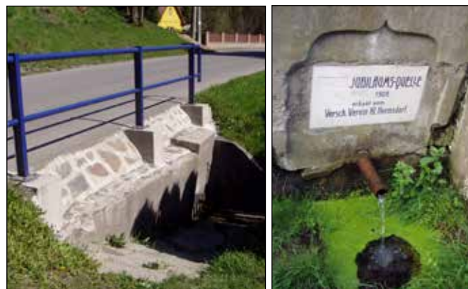
„Jubilejní pramen“ vyvěrající pod silnicí v Heřmánkách.