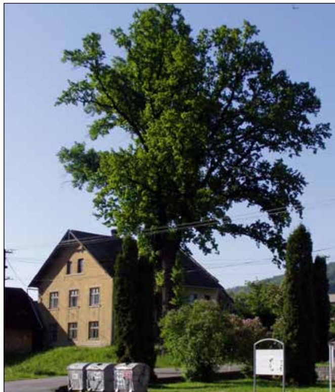
Památný strom Pavlíkův dub.

Naproti hospodě u řeky Odry stojí hasičská zbrojnice a na ní můžete shlédnout prvorepublikovou kamennou pamětní desku se jmény pěti jakubčovických hasičů padlých v 1. světové válce a dřevěnou sošku sv. Floriána v proskleném výklenku.