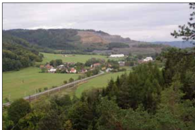
Výhledy ze Švédské skály.

ská skála nabízí pěkný výhled jak do údolí řeky Odry k Heřmánkám a jakubčovickému kamenolomu, tak i do údolí potoka Čermné k železniční zastávce Klokočov.