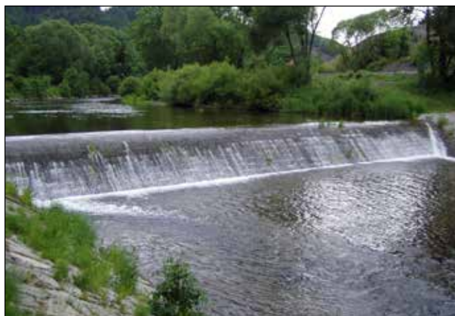
Jez na řece Odře.

Před bývalou věznicí, za levotočivou zatáčkou Sportovní ulice u vodárny odbočte doprava na další nový úsek cyklotrasy č. 503 „Odersko“, který vás podél řeky Odry dovede až do Heřmáněk. Za vodárnou ještě můžete odbočit doprava k jezu na řece Odře, kde začíná jakubčovický vodní náhon. Tento jez je i dolní hranicí chráněného území – Evropsky významné lokality „Horní Odra“, chránící řeku Odru až po soutok s Budišovkou pod Hadinkou jako biotop chráněné malé rybky vranky obecné.