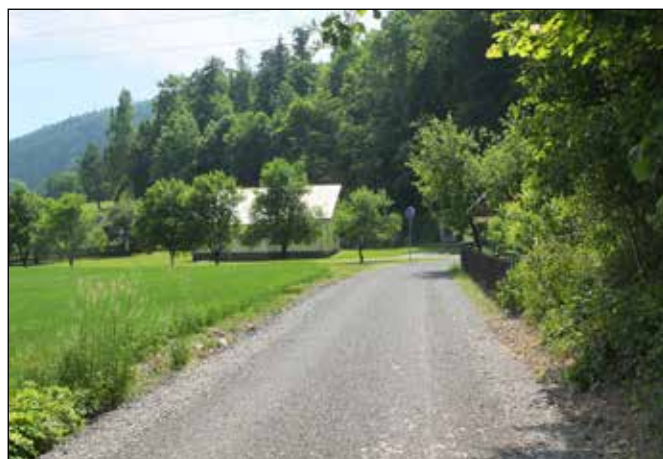
Cyklotrasa obchází bývalou výsypku.

Cyklotrasa obchází areál dílny dřevoskladu stojící na výsypce odpadového materiálu bývalých kamenolomů předválečného podnikatele Ing. Hanela.