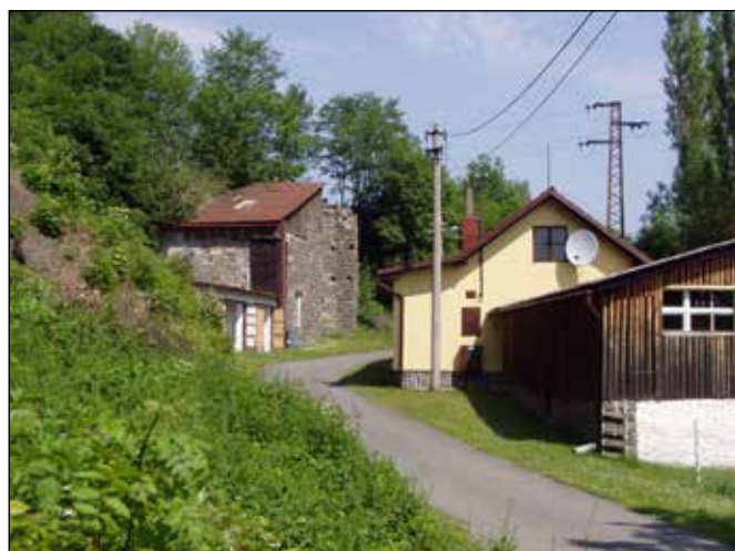
Dále vede k základům bývalých drtičů kamene.

Základy bývalých drtičů uvidíte po levé straně cyklotrasy a ke dvěma opuštěným kamenolomům si můžete udělat krátkou odbočku před mostem přes řeku Odru doleva do kopce. S opatrností můžete lesem bez kola obejít lomovou stěnu kamenolomu a pokochat se pohledy do údolí Odry – z jednoho k Heřmánkám a z druhého k Jakubčovicím n. O. nebo až k Odrám. V obou kamenolomech se těžil stejný stavební kámen jako v Jakubčovicích n. O. – droba. S bývalou těžbou kamene souvisí i most, po němž budete přejíždět řeku Odru. Původně po něm vedla úzkorozchodná nákladní drážka, po níž se dopravoval kámen z obou kamenolomů k překladišti na železniční trať Suchdol n. O. – Budišov n. Bud. (č. 276), která byla otevřená v roce 1891. Most je ocelový a nýtovaný, čehož si všimnete až při pohledu zdola.