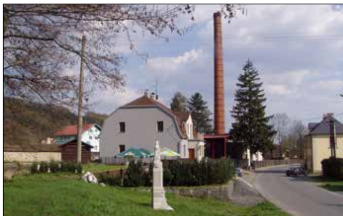
Památník 1. světové války s bývalou knoflíkárnou v pozadí.