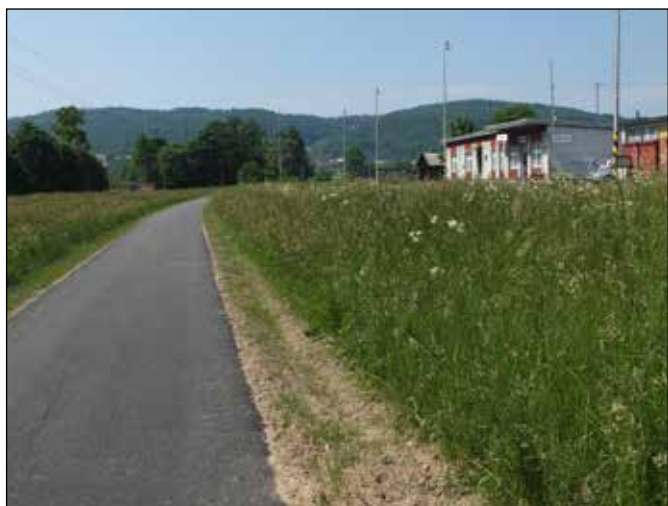
Cyklostezka vede kolem železniční zastávky Heřmánky.

V Odře se můžete osvěžit a dále pokračovat podél železniční tratě k železniční zastávce Heřmánky, kterou budete mít po pravé ruce. Zajímavostí je, že stávající zděná budova železniční zastávky Heřmánky je mladšího data, než samotná železniční trať. Původní dřevěný přístřešek železniční zastávky stával na horním konci Heřmánek bez odbočných kolejí. Stávající zděná budova železniční zastávky byla vybudována až v roce 1936 spolu s odbočnými kolejemi, umožňujícími křižování vlaků i nakládku dřeva. Zajímavostí je rovněž to, že železniční zastávka Heřmánky dříve sloužila i obyvatelům městyse Spálov, kteří na ni chodili údolím Bralného potoka a Odru překonávali přes dnes již neexistující lávku.