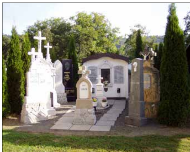
Pamětní místo s německými hroby.