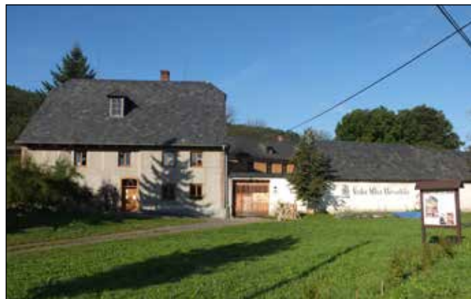
Vodní mlýn Wesselský v Loučkách.

Nad školkou cyklotrasa po mostě přechází řeku Odru a za ní můžete spatřit nejatraktivnější památku Louček - opravený památkově chráněný areál vodního mlýna Wesselských ( http://www.vodnimlyn.cz/ ), který si můžete prohlédnout.