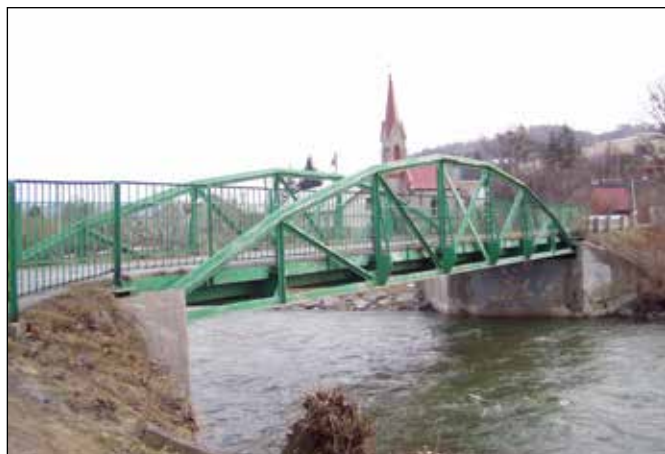
Ocelový obloukový most v Loučkách.

V Loučkách nově cyklotrasa prochází podél areálu bývalé pily, kde je v současnosti provozována elektrárna na spalování biomasy. U ocelového mostu přes řeku Odru postaveného v místě původního mostu, strženého při červencových povodních v roce 1997, se napojíte na původní cyklotrasu č. 503 „Odersko“, již projedete Loučkami. V Loučkách, které jsou místní částí města Oder, stojí za povšimnutí řada zajímavostí. U autobusové zastávky si všimněte ocelového obloukového mostu přes řeku Odru, který stával v údolí Moravice v místě zátopy Kružberské přehrady a který nahradil dožívající dřevěný krytý most. Za obloukovým mostem uvidíte novogotickou kapli Panny Marie Růžencové.