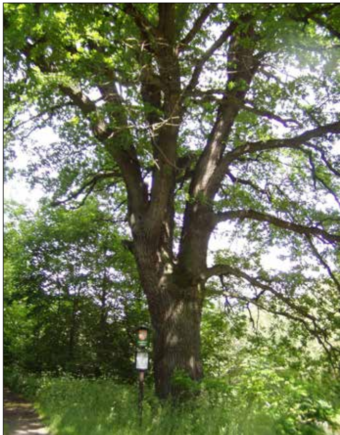
Památný strom „Dub u brodu“ v Heřmánkách.

Nový úsek cyklotrasy prochází po upravené pravobřežní účelové komunikaci proti proudu řeky Odry. Nad vodárnou přejedete mostek přes potok Suchou, který je hranicí katastrů obcí Jakubčovice n. O. a Heřmánky. Za Suchou cyklotrasa vede břehovým porostem řeky Odry k brodu, u něhož roste památný strom dub letní s obvodem kmene asi 426 cm.