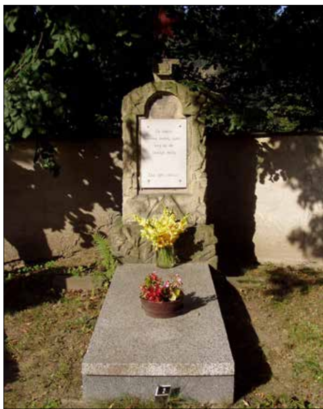
Hrob sovětského zajatce.

Přes silnici naproti hospodě stojí památkově chráněné bývalé fojství, které prochází rozsáhlou rekonstrukcí a v jehož zahradě roste památný strom „Tomčíkův tis“ – tis červený s obvodem kmene asi 240 cm. Za hospodou se nachází hřbitov s památkově chráněnou hřbitovní zdí a filiálním kostelem Neposkvrněného Početí P. Marie. Na hřbitově je zřízeno pamětní místo věnované původním obyvatelům Heřmánek německé národnosti a při vstupu na hřbitov je pochován neznámý sovětský zajatec ubitý fašisty za 2. světové války.