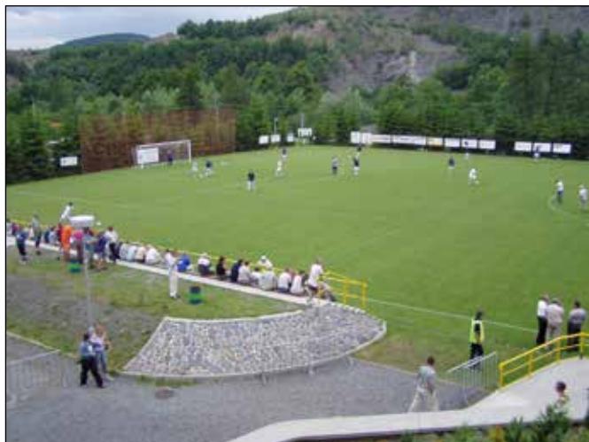
Fotbalové hřiště v Jakubčovicích nad Odrou.

Na křižovatce u kamenolomu nově cyklotrasa křížuje hlavní silnici II/442 a pokračuje rovně na ulici Sportovní. Jak název ulice napovídá, cyklotrasa vedená po ní vás zavede k jakubčovickému sportovnímu areálu, jehož hlavní součástí jsou dvě travnatá fotbalová hřiště, kde slavil fotbalový oddíl TJ Tatra největší slávu za vedení bývalého majitele kamenolomu pana Josefa Hájka z Opavy. Fotbalový stadion se nachází po levé straně cyklotrasy za náhonem a jeho součástí je i volně přístupné dětské hřiště, kde se mohou vydovádět děti.