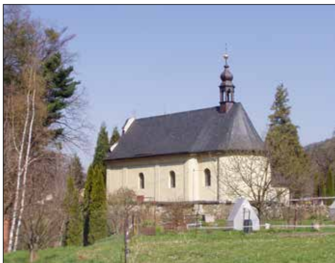
Kostel Neposkvrněného početí Panny Marie v Heřmánkách.

Pod hlavní silnicí II/442 na úrovni domu pod kostelem vyvěrá „Jubilejní pramen“ upravený na počátku 20. století, který nevysychá.