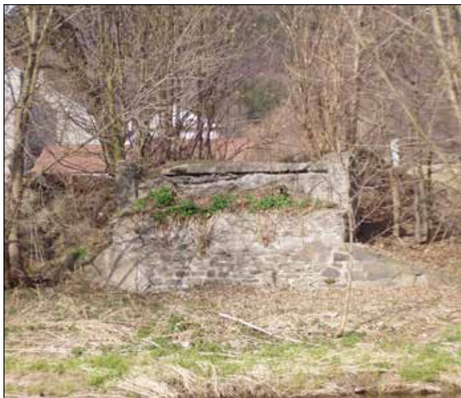
Kamenný pilíř zaniklého dřevěného krytého mostu v Heřmánkách.

Za dubem cyklotrasa pokračuje podél řeky až k Heřmánkám, kde před bývalou výsypkou zaniklých kamenolomů odbočuje doleva k těmto lomům. V místě levotočivé zatáčky v minulosti stával dřevěný krytý most, po němž na obou březích řeky Odry zůstaly jen nepříliš patrné kamenné pilíře.