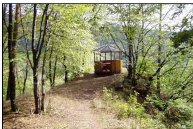
Dřevěný vyhlídkový altánek na Švédské skále u Spálova.

Za železniční zastávkou Heřmánky nová cyklostezka pokračuje k pěknému novému dřevěnému mostku přes potok Čermnou, který je katastrální hranicí mezi obcí Heřmánky a městysem Spálov.