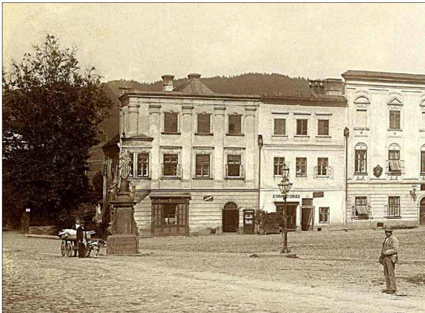
Odrá - náměstí, dobová fotografie. Rohový dům č.p. 2/3 obývalo od roku 1777 do roku 1900 několik generací rodiny Zimmermann. Za povšimnutí stojí i vozík tažený psem vedle sochy Nanebevzetí Panny Marie