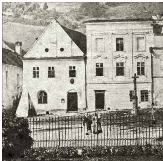
Kamenný modlitební kříž (7) v horní části náměstí, pohled ze zámecké zahrady. Fotografie Antona Bergera kolem roku 1900.