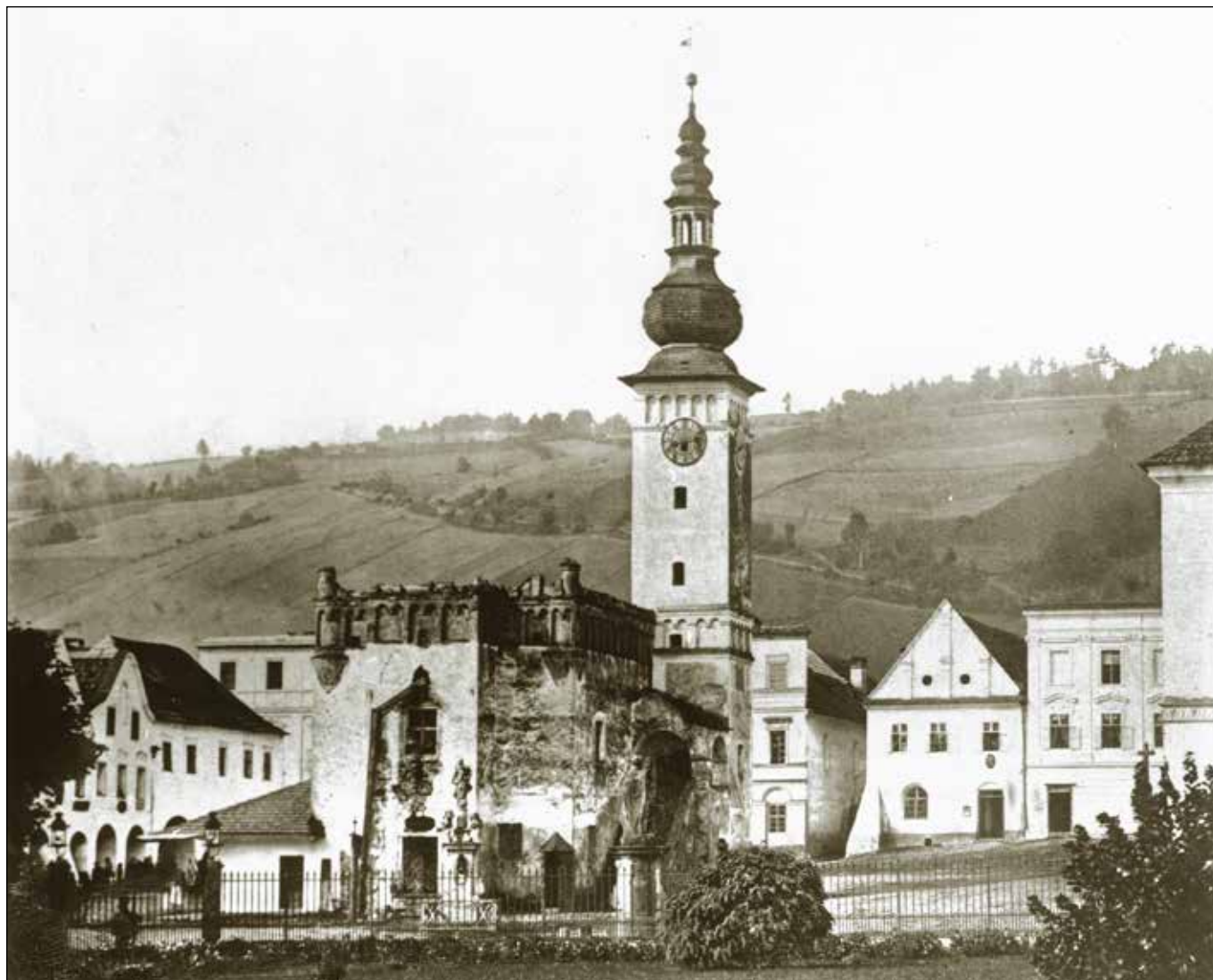
Odry – náměstí s renesanční radnicí před rokem 1863 z východní strany. Blíže k radnici stojí socha Nanebevzetí Panny Marie, blíže k plotu zámecké zahrady je socha sv. Floriána. Na levé straně od radnice jsou domy č.p. 21 a č.p. 22 – hotel „Zu Hirschen“ (dnes hotel „Max“) ještě s podloubím. V pravém horním rohu náměstí je viditelná vrchní část modlitebního kříže.

z každého rohu náměstí vycházela jen jedna ulice. Krásu starého města umocňoval honosný renesanční zámek s květinovou zahradou. Vně hradeb města se rozkládalo jeho Horní ( Obere Vorstadt ) a Dolní ( Niedere Vorstadt ) předměstí a osady Nové Město ( Neustadt ) a Nové Sady ( Neumarkt ).