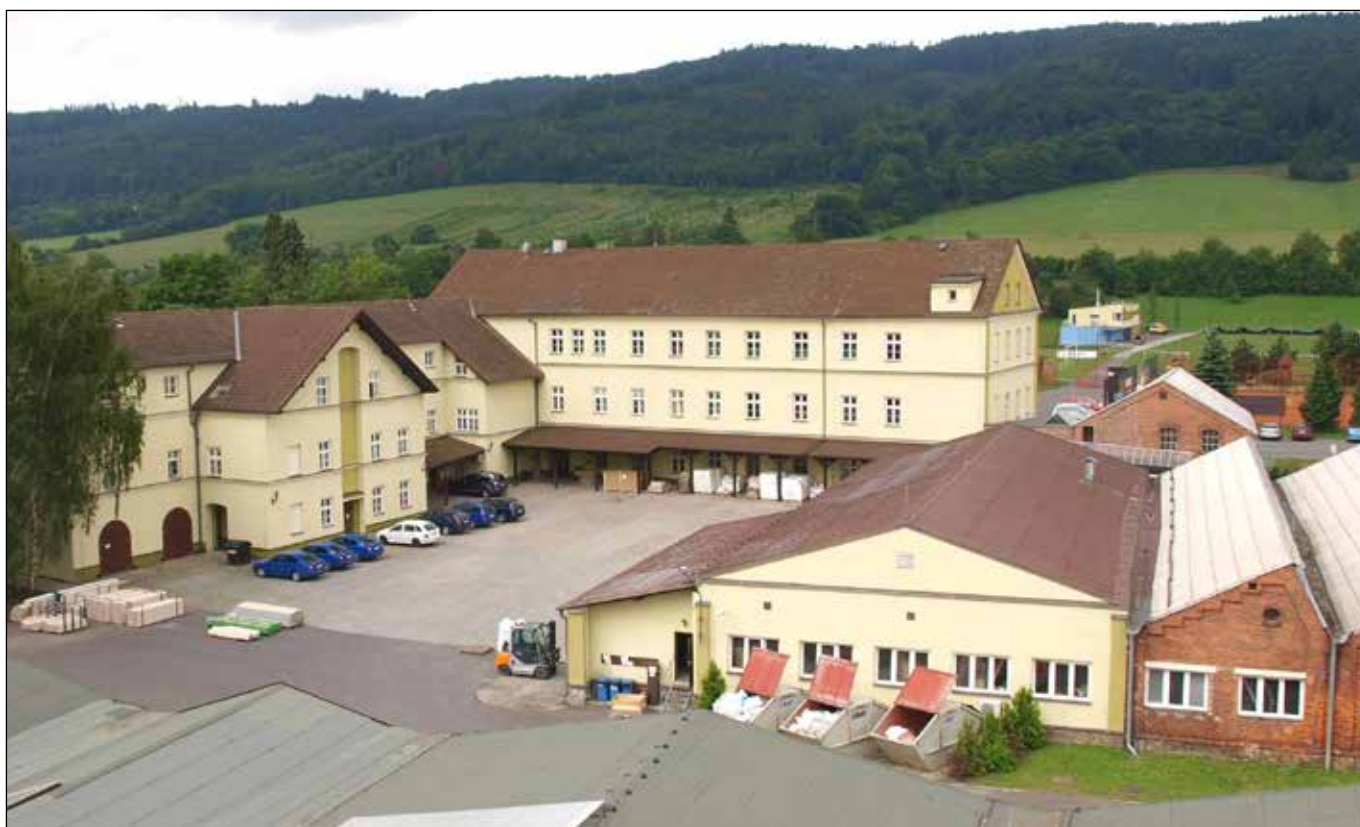
Areál továrny s Veselským kopcem v pozadí.