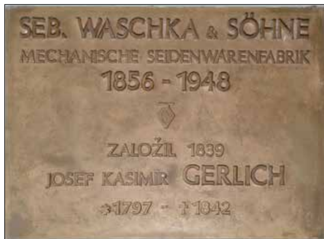
Pamětní deska u vstupu do továrny.

Rodinná firma změnila 1. 10. 1863 název na „Sebastian Waschka & Söhne“ a pod touto značkou fungovala až do svého zániku. Ve skutečnosti se jednalo o veřejnou společnost, jejíž vznik podmiňoval vklad kapitálu ve zlatých rakouské měny. Každý ze společníků mohl získat podíl z dosaženého čistého zisku firmy, stejně tak ale nesli vlastním kapitálem odpovědnost za ztráty. Firma měla sídlo ve Vídni, v Odrách byl výrobní závod, vídeňská část zajišťovala prodej.