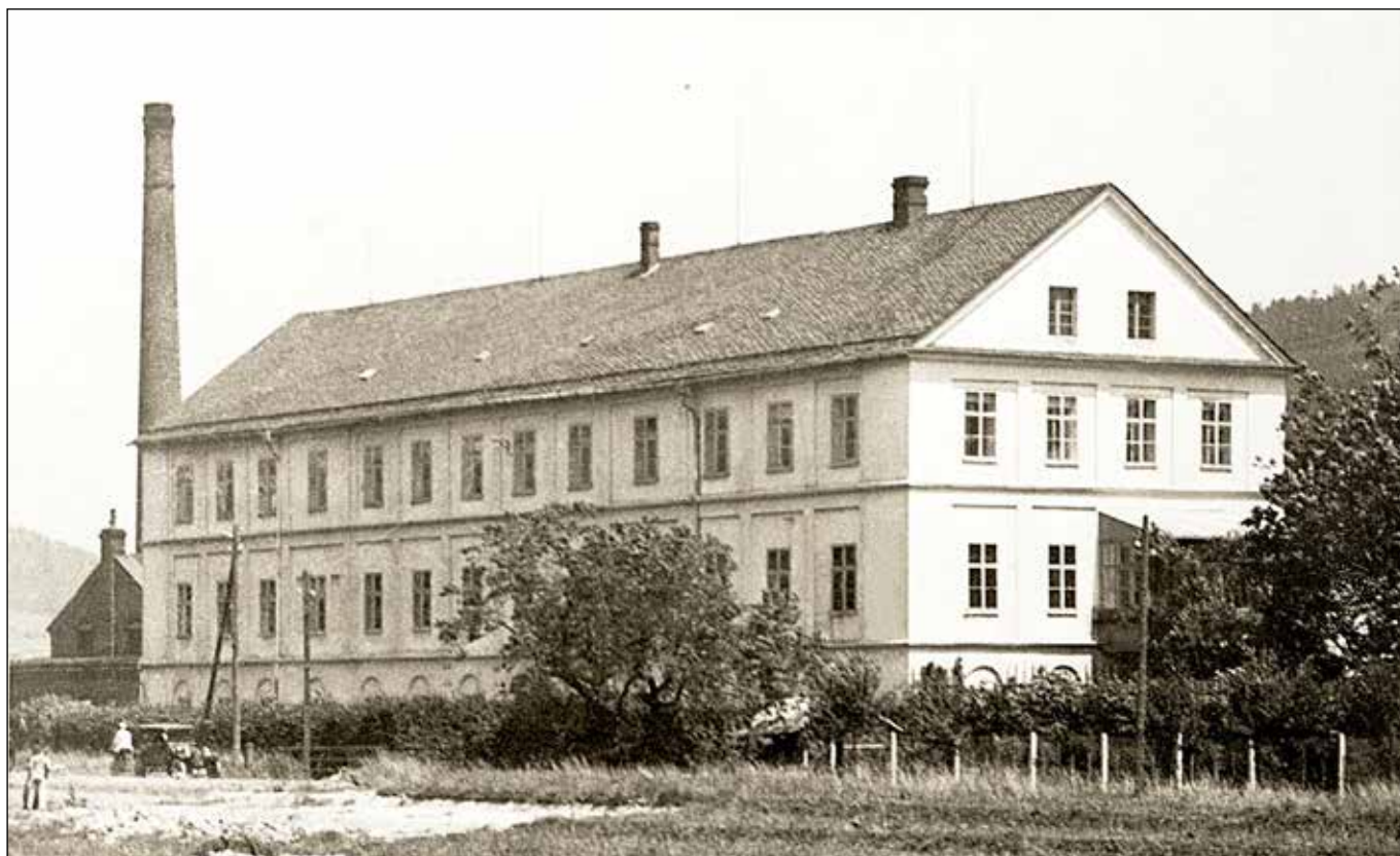
Továrna Sebastian Waschka&Söhne z pohledu od koupaliště asi v roce 1930.

podářilo uvést pouze dílny, kde byly znovu instalovány tkalcovské stavy a teoreticky bylo možné vyrábět. To se však nestalo, protože podnik nedostal přiděl surovin.