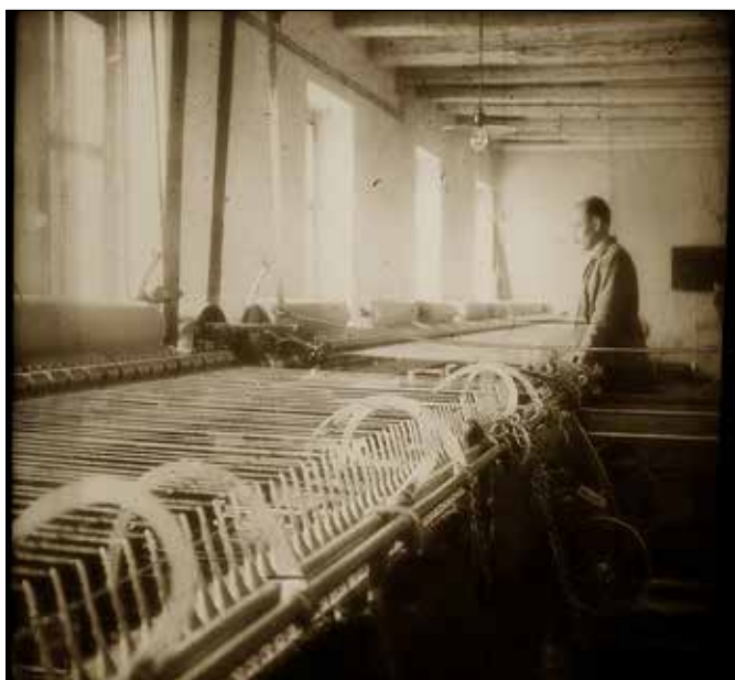
Výroba sukna ve Waschkově továrně.

Ještě na podzim 1917 byla továrna v plném provozu. Od jara do podzimu 1918 poklesla obchodní činnost a v roce 1920 začala neodvratná velká krize, během které byl podnik zastaven, což ho stálo nepředstavitelné oběti. Kromě války měl na chod továrny nepochybně dopad také rozpad Rakouska - Uherska a z něj plynoucí omezení kontaktů mezi oderskými a vídeňskými společníky.