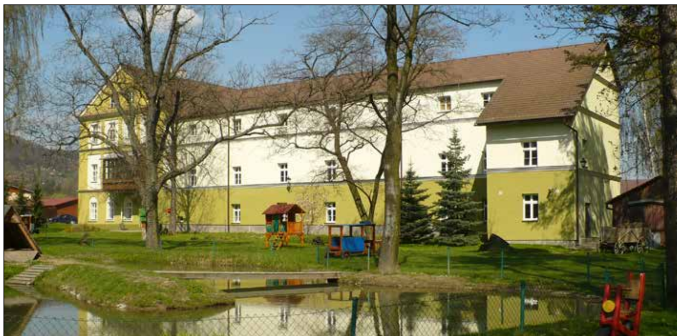
Park v areálu továrny je dnes oblíbeným odpočinkovým místem pro rodiny s dětmi.