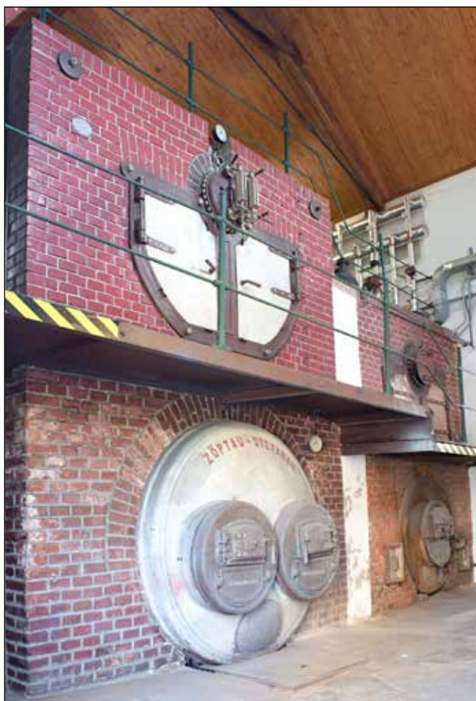
Původní parní kotel typu Tischbein z roku 1893 na tuhá paliva. Továrna se jím vytápěla ještě ve 2. pol. 20. stol., když v ní byl velkosklad textilu.

Ještě na podzim 1917 byla továrna v plném provozu. Od jara do podzimu 1918 poklesla obchodní činnost a v roce 1920 začala neodvratná velká krize, během které byl podnik zastaven, což ho stálo nepředstavitelné oběti. Kromě války měl na chod továrny nepochybně dopad také rozpad Rakouska - Uherska a z něj plynoucí omezení kontaktů mezi oderskými a vídeňskými společníky.