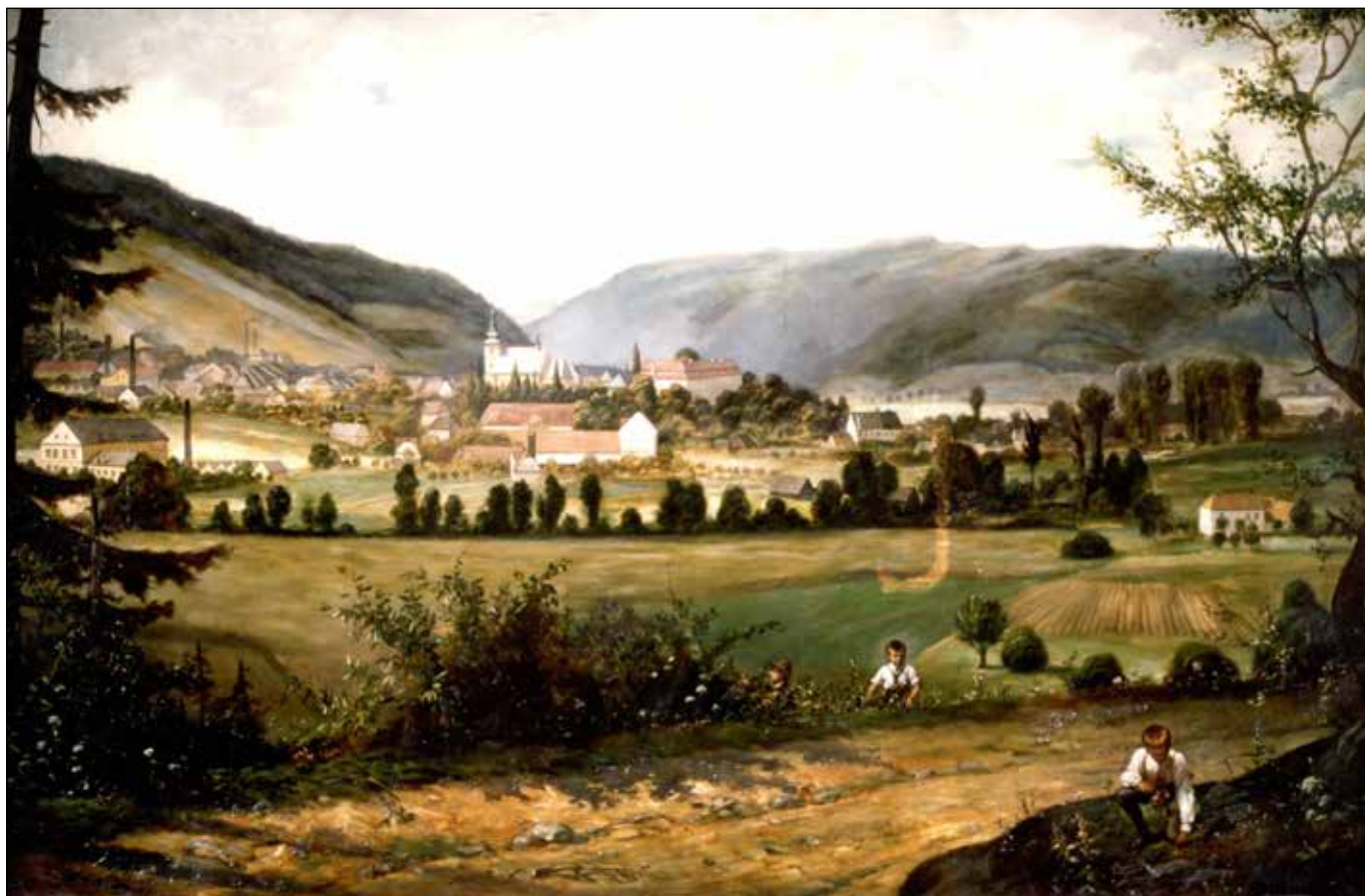
Vyobrazení Oder před rokem 1890, zcela vlevo areál Waschkovy továrny. Obraz byl původně umístěn v oderském zámku, dnes zdobí kancelář starosty města Oder.