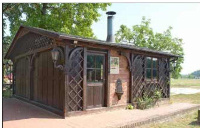
Altán Sebastian po přestěhování a rekonstrukci v zahradě firmy.

S příchodem nového milénia dostala nový háv hlavní historická budova, která je vstupní bránou do celého areálu. Revitalizací prošel i přilehlý park. Jeho středem protéká potůček s několika dřevěnými lávkami, který se vlévá do jezírka. Dominantou parku je dřevěný altán, kterému se ve firmě říká Sebastian na počest zakladatele továrny Sebastian Waschka & Söhne. Původně stál v za-