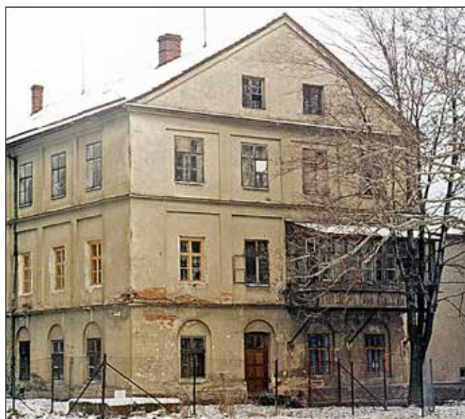
Neutěšený stav hlavní budovy před rekonstrukcí, kolem roku 1990.