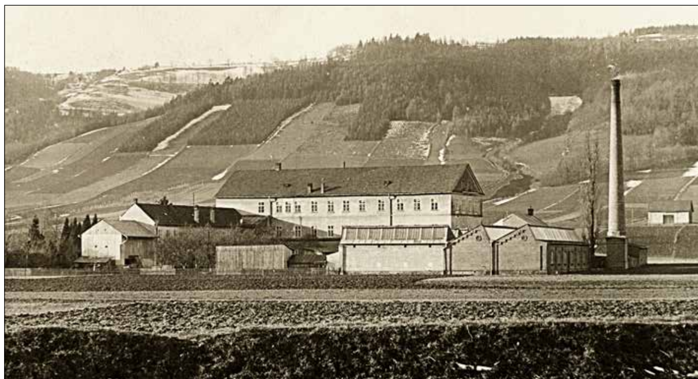
Pohled na továrnu od řeky Odry v roce 1909.

dále jednopodlažní vedlejší trakt, kůlna, přízemní masivní stavení zvané Cheed, poschoďová kotelná a přízemní strojovna, umývárna, komín a několik dalších skladů a kůlen. V roce 1915 ocenil znalec popisované objekty v areálu firmy na bezmála 70 tis. korun. Strojové vybavení a zařízení skladu na dalších 30 tis. korun.