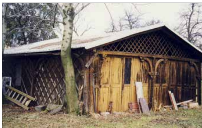
Původní altán v zahradě za domem Sebastiana Waschky, dnes Domova na ul. Hranická č.p. 151 v Odrách.

náročná oprava střechy a výměna oken hlavní budovy. V přízemí byla zprovozněna jídelna a vrátnice. Na nádvoří začala růst hrubá stavba přístavby pravého křídla. Ve firmě vznikla také dílna zhruba pro 15 pracovníků se změněnou pracovní schopností. Rok na to už továrna zaměstnávala 90 lidí, z toho 39 žen a 7 řídicích pracovníků včetně techniků. V červenci 1997 zasáhla Odry povodeň a nevyhnula se ani areálu firmy MATEICIUC. Naštěstí nezasáhla původní objekty, ale škody napáchala. Výrobní sortiment se neustále rozšiřoval, například o korugované (rýhované) trubky. Vzhledem k tomu bylo nezbytné rozšiřovat i areál závodu, přibýly volné skladové plochy s asfaltovým povrchem a vybudovaly se vnitřní komunikace. Ve výrobě byla realizována mnohá vylepšení, která umožnila zvyšovat produktivitu.