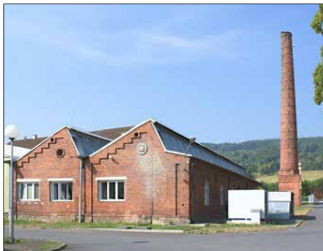
Šedové světlíky původní výrobní haly s komínem.