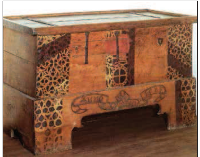
Truhla z tošovického kostela s rytým nápisem ANNO DOMINI 1521. Sběrka Slezského zemského muzea v Opavě.