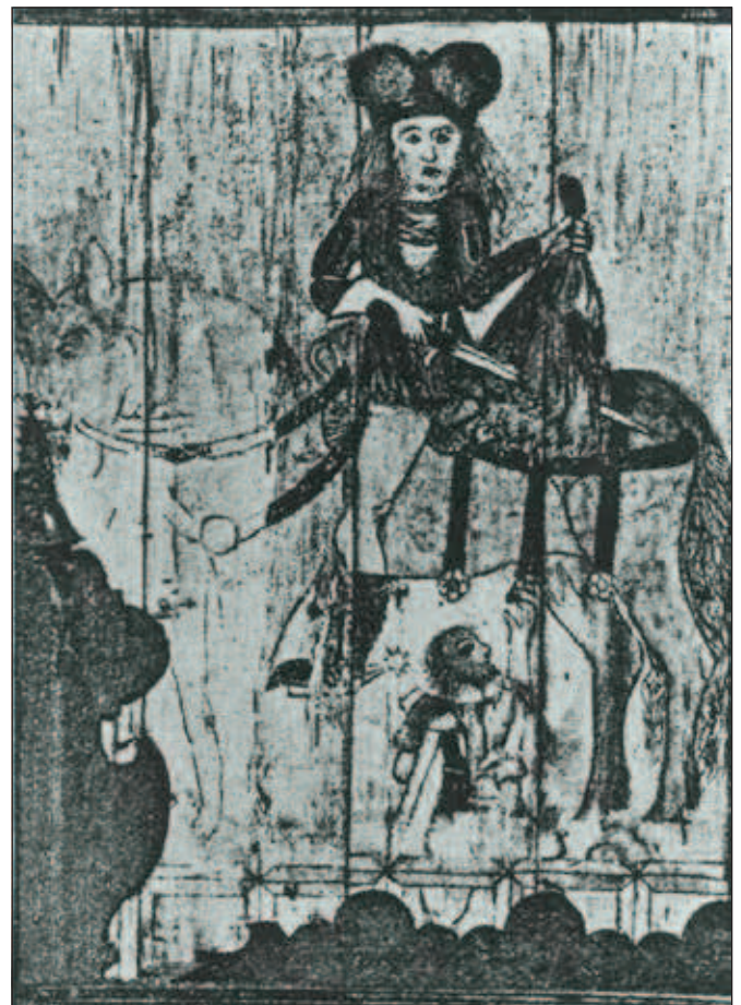
Nedochovaná malba patrona kostela sv. Martina v tošovickém kostele.