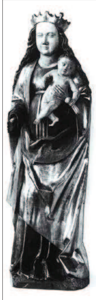
Madona z Tošovic, kolem 1510–1520. Původní stav. Sběrka Slezského zemského muzea v Opavě.