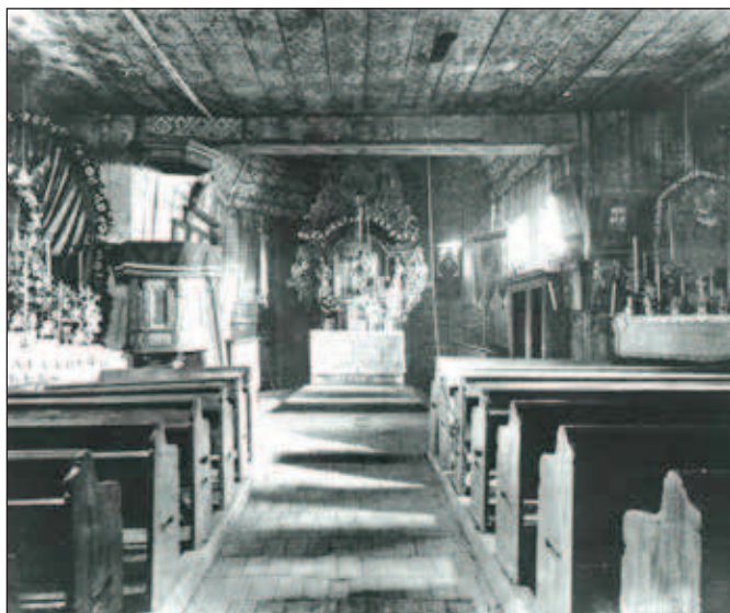
Interiér kostela – pohled k presbytáři, 1909.