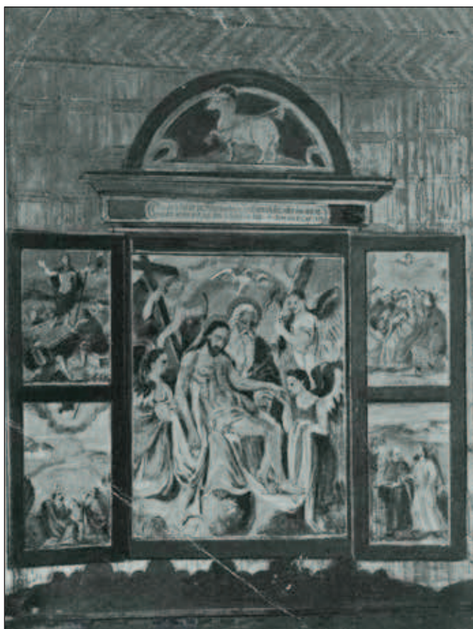
Nedochovaný renesanční křídlový oltář v tošovickém kostele – otevřený.