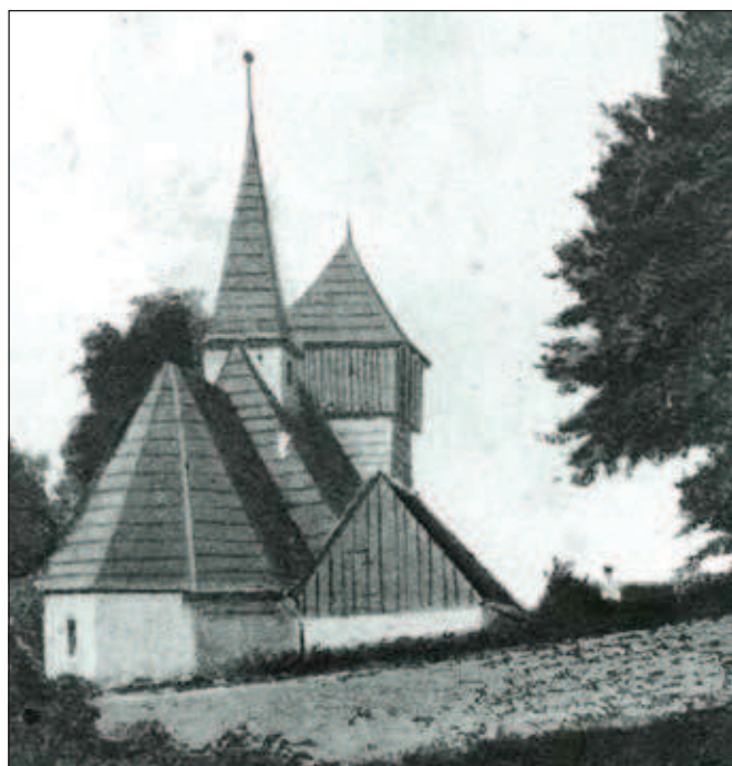
Pohled od severovýchodu se zřetelným rozvrstvením jednotlivých částí stavby.