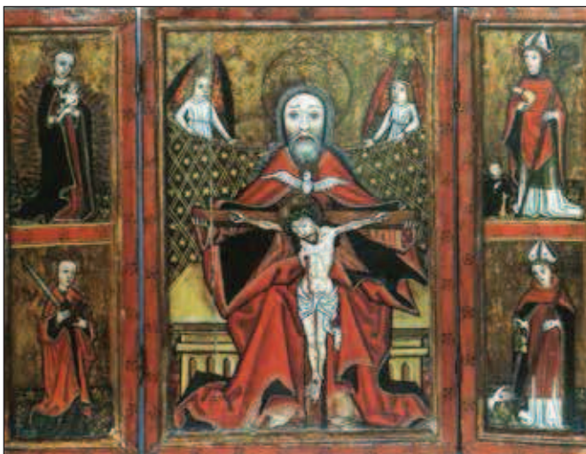
Oltář z Tošovic