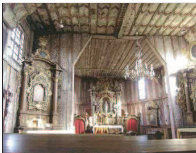
Interiér broumovského hřbitovního kostela Nanebevzetí Panny Marie s šablonovou výmalbou.