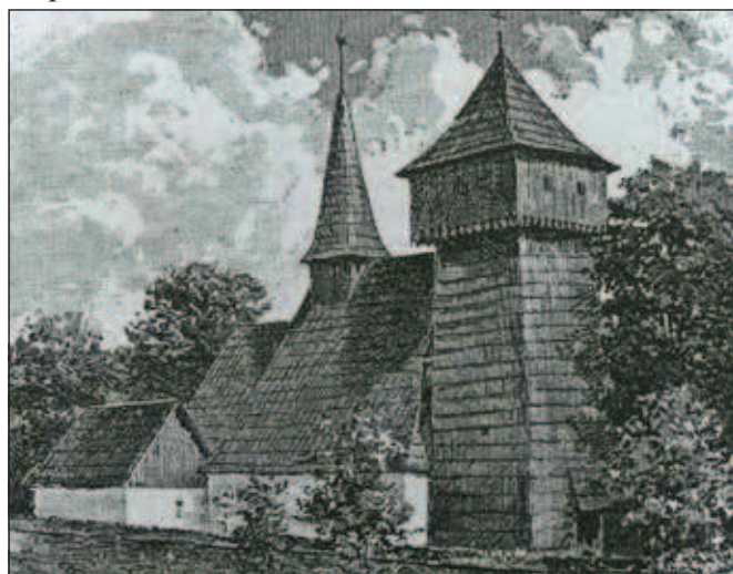
Kresba dřevěného kostela sv. Martina v Tošovicích v Rollederově kronice.

ulitý olomouckým zvonařem Antonem Obletterem v roce 1802. Kostel měl v interiéru plochý deskový strop lodi, na místo triumfálního oblouku vodorovný trám, vyšší zastropení presbytáře, kopírující sklon krokvi (snad z doby pořízení barokního oltáře), emporu na západní straně na dřevěných pilířích a k ní na jihu připojenou kruchtou s varhanami, nad nimiž byl deskový strop prolomen do podkroví.