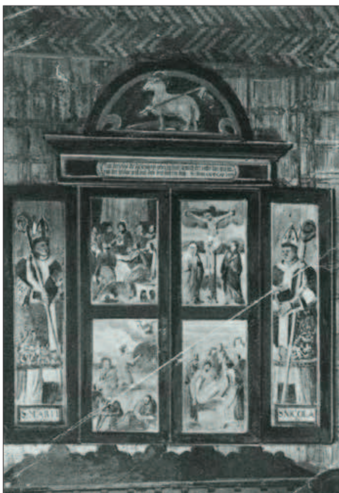
Nedochovaný renesanční křídlový oltář v tošovickém kostele – zavřený.

Dřevěný kostel byl pod vedením stavitele Hurníka z Oder v červnu 1909 zbourán. Ještě před demolicí kostel na místě namaloval opavský malíř Adolf Zdrázila. Ten také za muzeum dohlížel, aby se před demolicí nepoškodil mobiliář a také obložení stěn. Instalaci těchto prvků do opavského muzea podpořila nejen Centrální komise, pro kterou toto řešení znamenalo alespoň částečné zadostiučinění, ale také ministerstvo kultu a vyučování, které muzeu poskytlo i finanční subvenci. V přízemí muzea vznikl podle původního půdorysu tzv. „Taschendorfer Kirchensaal“, jenž představoval ojedinělou akvizici muzea, zmíněnou jako jednu z hlavních ještě v roce 1930. Při leteckém bombardování Opavy na konci 2. světové války byla zasažena i budova opavského muzea a téměř celý mobiliář tošovického kostela byl tímto zničen. V opavském muzeu se zachovala jen šablonovou malbou zdobená truhla na paramenta z roku 1521, 130 cm vysoká socha Madony s dítětem přibližně z let 1510–1520 a tzv. oltář z Tošovic, drobnější triptych s oboustranně malovanými křídly z doby výstavby kostela.