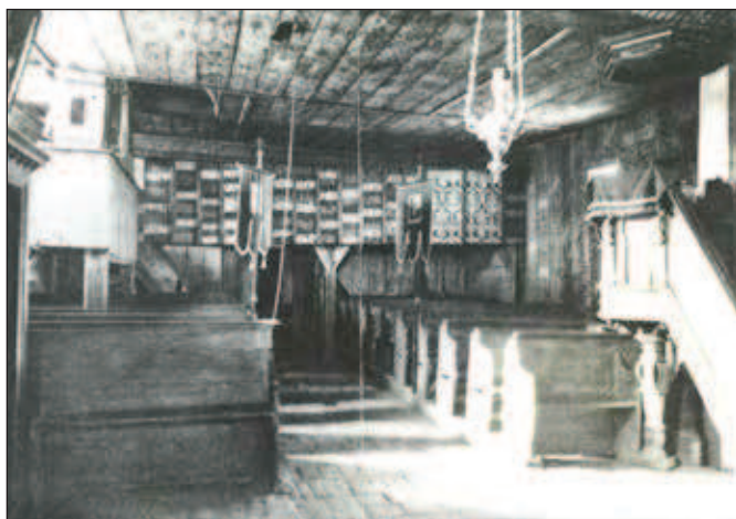
Interiér kostela – pohled k empoře (tribuně) na západě, 1909.

Trámové stropy i stěny kostela obložené dřevěným táflováním byly vyzdobeny šablonovými otisky s vegetabilními, architektonickými i figurálními motivy na barevné podmalbě. Každá dekorovaná deska byla v úzkých pásech střídavě natírána třemi barvami: patrně červenou, černou, žlutou, bílou, zelenou a hnědou. Tento způsob výzdoby se v 1. polovině 14. století uplatňoval k vyplnění prázdné plochy deskových obrazů a později i pro výzdobu interiérů. Již v 15. století se tento způsob dekorování často vyskytoval v interiérech venkovských sakrálních staveb, neboť představoval levnější náhražku malby deskové a freskové. Z vybavení kostela byla šablonovými motivy zdobena kazatelna, která však byla v polovině 17. století vyměněna za barokní, a také truhla na paramenta, datovaná letopočtem 1521 na nápisové pásce na jejím korpusu, nacházející se dnes ve sbírce Slezského zemského muzea. Na šablonách se objevovaly akantové listy, umístěné v pletencích nebo doplněné květy, úponky vinné révy s listy a hrozny, kružby či kroužené hvězdice doplněné plaménky, různé varianty pletenců, ozdobené také hvězdami nebo krouženými motivy, kříže a čtverce, erby pánů z Lideřova s motivem palečného kola, motivy jelenů, draků se stočeným ocasem, jednorožců a dalších symbolických zvířat. Podklad maleb tvořily v lodi obdélníky, v presbyteriu drobné zalamované pruhy.