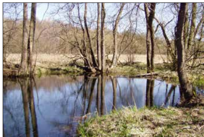
Tůňka v údolí Odry nad Vojnovicemi.