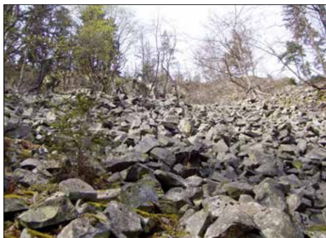
Kamenné moře ve svahu nad levým břehem řeky Odry mezi Podlesím a Starými Oldřůvkami.