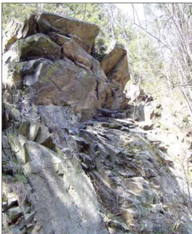
Skalní výchoz s kamenným vějířem.

Při vstupu cesty do lesa vystupuje v levém svahu skalnatý výchoz tvořený drobnými, který vzdáleně připomíná kamenný vějíř. V korytě řeky Odry protékající po pravé straně cesty v korytě vystupují kamenné prahy a žebra. V místě, kde se řeka Odra i cesta na jejím levém břehu stáčejí doprava, spatříte v levém svahu unikátní a na území celého Nízkého Jeseníku i největší skalní moře vzniklé mrazovým zvětráváním vrcholových skalek. Toto přirozeně vzniklé suťoviště je tvořeno balvany i přes metr velkými a je spoře porostlé lišejníky a mechorosty. U smrků