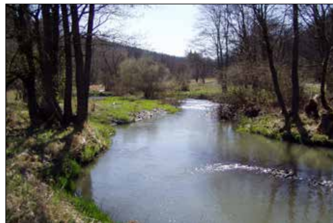
Odra pod Vojnovicemi.

Od Vojnovic řeka Odra protéká užším zatravněným údolím se zalesněnými svahy. Její tok je doprovázen břehovým porostem tvořeným především vrbami a olšemi. V její údolní nivě se nacházejí četné mokřady využívané divokými prasaty (černou zvěří) jako kaliště. K samotné řece se zejména v létě stahuje jelení zvěř (vysoká).