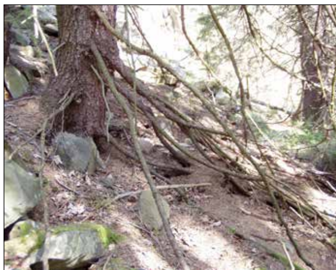
Zakořeňující větve smrků na okraji kamenného moře.

rostoucích na okrajích kamenného moře nejnižší větve zakořeňují v humusu napadaném na kamennou suť. Toto místo by si zasloužilo zvláštní ochranu, i když se nachází na území Vojenského újezdu Libavá a je tak běžným lidem nepřístupné.