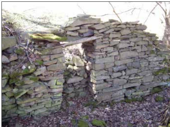
Ruiny Kořistkova mlýna u Rudoltovic.

Od Vojnovic řeka Odra protéká užším zatravněným údolím se zalesněnými svahy. Její tok je doprovázen břehovým porostem tvořeným především vrbami a olšemi. V její údolní nivě se nacházejí četné mokřady využívané divokými prasaty (černou zvěří) jako kaliště. K samotné řece se zejména v létě stahuje jelení zvěř (vysoká).