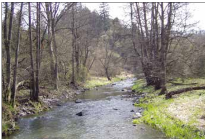
Řeka Odra nad Starými Oldřůvkami.

Pokaždé, když jej vidím, se musím obdivovat našim předkům, kteří bez jakékoliv mechanizace a s tehdejšími znalostmi uměli tak citlivě své stavby umístit do krajiny. A co na tomto jezu obdivuji? Především jeho umístění a provedení. I když se již téměř 70 let nevyužívá a za tu dobu došlo k několika velkým povodním, byl by zřejmě po drobných opravách stále funkční a použitelný. Jelikož jej tvořil jen asi půl metru zvýšený kamenný práh vyskládaný v korytě úhlopříčně a vyztužený dřevěnými hranoly, výrazně nenarušoval podélný spád řeky ani nezvyšoval výšku hladiny vody v nadjezí. Naše dnešní mohutné jezy stavěné především ze železobetonu jsou migračními překážkami pro vodní živočichy, zhoršují povodně v nadjezí a vyžadují pravidelnou a nákladnou údržbu.