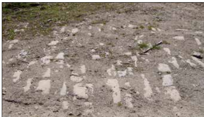
Původní kamenné dláždění cesty vedoucí z Podlesí do Rudoltovic.