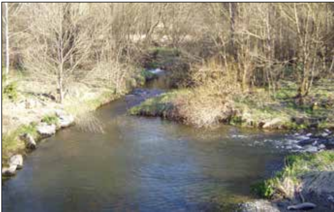
Místo soutoku Plazského potoka (přitékajícího výše zleva) a Libavského potoka (přitékajícího níže zprava) s Odrou pod Městem Libavá.

Jelikož jsou oba přítoky řeky Odry vodnaté téměř stejně jako samotná Odra, je to znát na jejím průtoku – od tohoto místa se již Odra podobá toku, jaký známe nad Klokočůvkem. Pod soutokem řeka vytvořila širokou a plytkou kotlinu v současnosti především zatravněnou s rozptýleně rostoucími dřevinami.