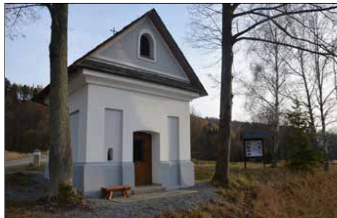
Kaplička mezi Rudoltovicemi a Vojnovicemi po obnově a vysvěcení v roce 2016.