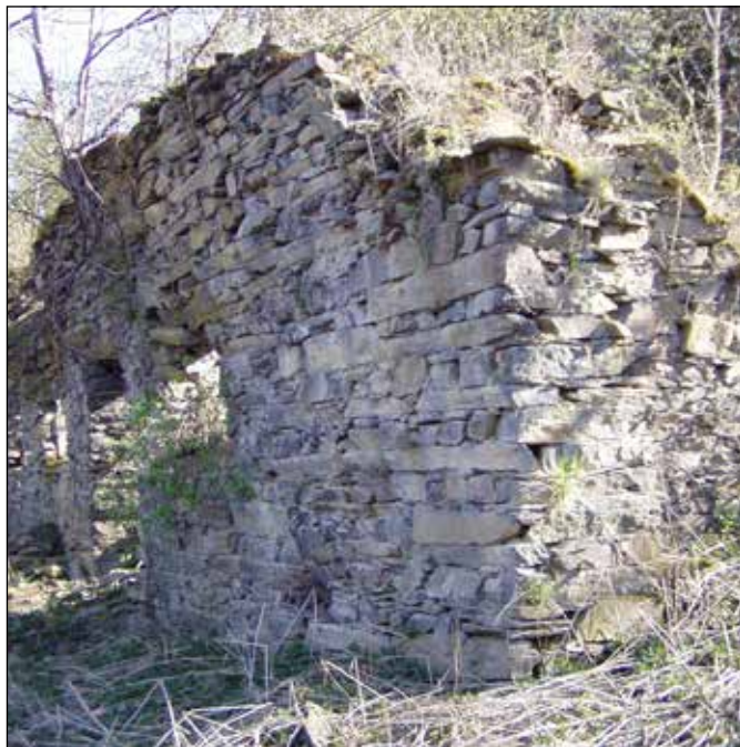
Zbytky kamenného zdiva zaniklého vodního mlýna u Zigartic.