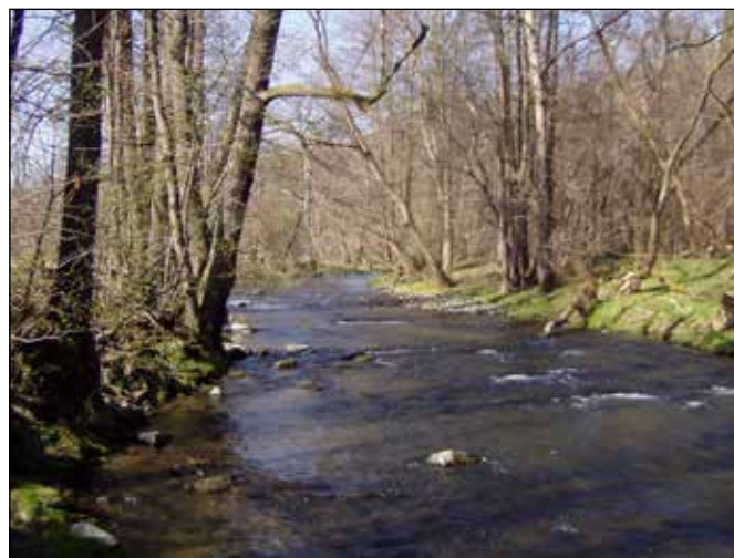
Řeka Odra nad soutokem s Něčínským potokem, kde opouští vojenský prostor.