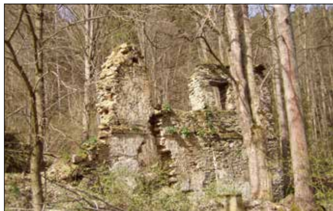
Zbytky zdí zaniklého Starooldřůveckého mlýna.

Před Starými Oldřůvkami na levém břehu řeky Odry naleznete zbytky kamenných zdí Starooldřůveckého mlýna, který Seznam charakterizoval následovně: Historická adresa: Staré Oldřůvky 61, jeho vlastník: Jordán, živnost: Mlýn, typ vodního motoru: 1 kolo na horní vodu, hltnost: 205 l/s, využitelný spád: 4,30 m a výkon: 5,62 kW, živnost: Pila, typ vodního motoru: 1 kolo na horní vodu, hltnost: 205 l/s, využitelný spád: 4,30 m a výkon: 5,62 kW. Kolem mlýna vede cesta překonávající řeku Odru ocelovým vojenským mostem a dále pokračující k Novým Oldřůvkám.