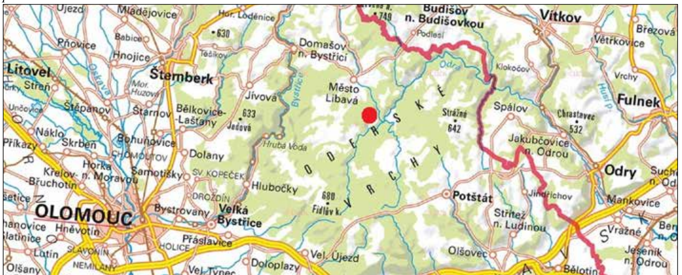
Základní mapa s vyznačením soutoku řeky Odry s Plazským a Libavským potokem vytvářející vodní kříž