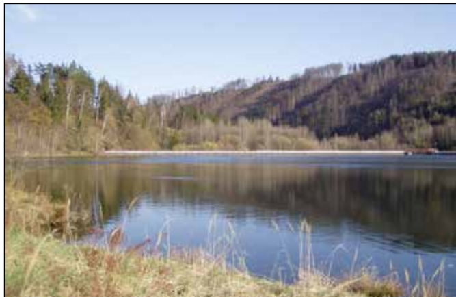
Barnovská vojenská přehrada na řece Odře.

vojenská nádrž pro hluboké brodění těžkou technikou, především tanky. Z důvodu hrozících ropných havárií a kvůli nemožnosti takovéto havárie spolehlivě zachytit přímo na této nádrži armáda tuto nádrž k takovýmto cvičením již delší dobu nevyužívá. Jelikož jde o vojenskou stavbu, nebudu uvádět její bližší parametry. Jedná se však jen o větší průtočný rybník průběžně protékající, který výrazněji neovlivňuje přirozený běh vod v řece Odře níže v povodí.