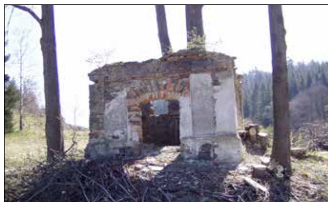
Kaplička mezi Rudoltovicemi a Vojnovicemi před obnovou.

V údolí řeky Odry naleznete tůňky, jež zjara využívají obojživelníci (např. ropuchy obecné) k rozmnožování.