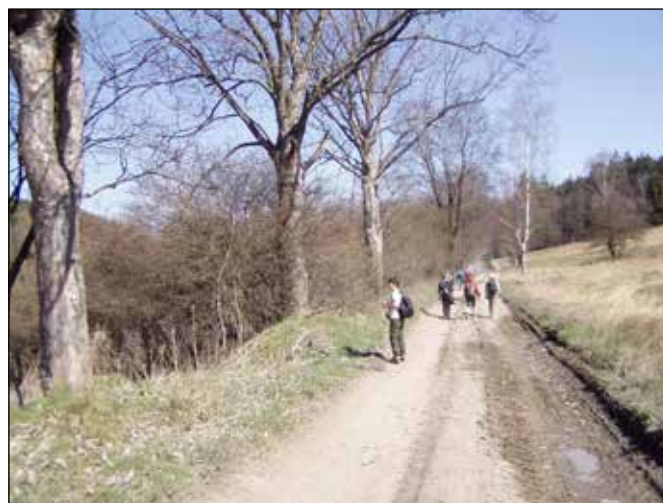
Cesta z Vojnovic do Rudoltovic roubená hodnotnými stromy.

Podle Seznamu byl tento mlýn charakterizován takto: Historická adresa: Rudoltovice 178, jeho vlastník: Korseska (poněmčelé jméno Kořistka), živnost: Výroba vodních kol, typ vodního motoru: 1 kolo na horní vodu, hltnost: 320 l/s, využitelný spád: 3,70 m a výkon: 7,55 kW.