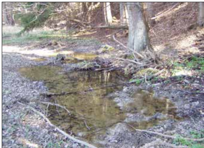
Kaliště černé zvěře

Na levém břehu řeky Odry nad zaústěním Podléského potoka stával další zvaný Richterův, který však byl nejen mlýnem, ale i pilou. Toto vodou poháněné vodní dílo mělo podle Seznamu tyto parametry: Historická adresa: Šumvald (dnes Podlesí) 85, jeho vlastník: Zimmer, živnost: Mlýn, typ vodního motoru: 1 Francisova turbína, hltnost: 235 l/s, využitelný spád: 3,20 m a výkon: 5,55 kW, živnost: Pila, typ vodního motoru: 1 kolo na horní vodu, hltnost: 300 l/s, využitelný spád: 3,15 m a výkon: 6,07 kW. Pod tímto mlýnem křížuje údolí řeky Odry další historická cesta vedoucí z Podlesí do zaniklé obce Rudoltovice. Odru překonává jednoduchým ocelovým mostem s dřevěnou mostovkou a s betonovými pilíři a na pravém břehu ji lemují stromořadí z javorů, jasanů, bříz a dalších listnatých dřevin. Cesta je vydlážděna kameny a slouží již dlouhé desítky let bez potřeby nějaké zásadnější opravy.