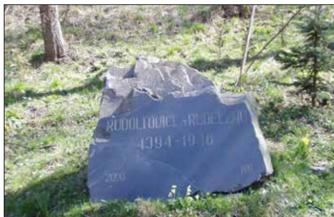
Památník připomínající zaniklou obec Rudoltovice.

Za ostrou zatáčkou nad Novým mlýnem cesta stoupá a na bývalém dolním okraji zaniklých Rudoltovic naleznete po levé straně další kamenný památník zřízený odsunutými německými obyvateli v roce 2000.