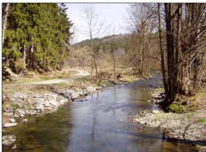
Řeka Odra pod soutokem s Podléským potokem.

Pod zaústěním Podléského potoka přitékajícího od Podlesí Odra vtéká do sevřeného zalesněného údolí, které je velmi zajímavé geomorfologicky. Vede jím po levém břehu Odry zpevněná lesní komunikace směřující jak do Starých Oldřůvek, tak i přes další most a brod k zaniklým Novým Oldřůvkám a k Barnovské přehradě. Čím je tento úsek údolí řeky Odry zajímavý?