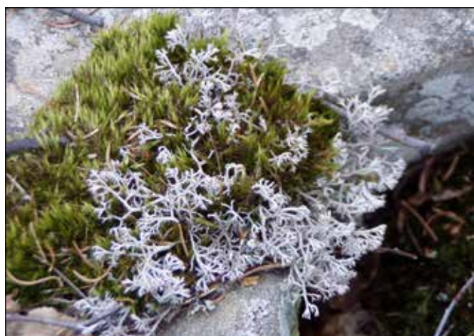
Lišejníky a mechorosty rostoucí v kamenném moři.

rostoucích na okrajích kamenného moře nejnižší větve zakořeňují v humusu napadaném na kamennou suť. Toto místo by si zasloužilo zvláštní ochranu, i když se nachází na území Vojenského újezdu Libavá a je tak běžným lidem nepřístupné.