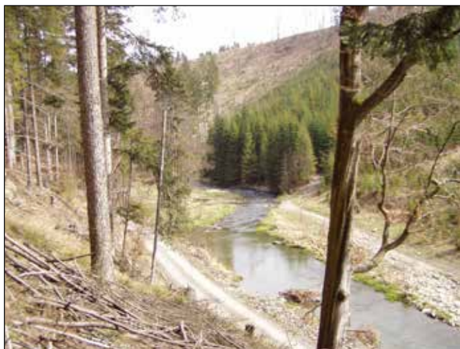
Řeka Odra pod kamenným mořem s místem bývalého jezu.