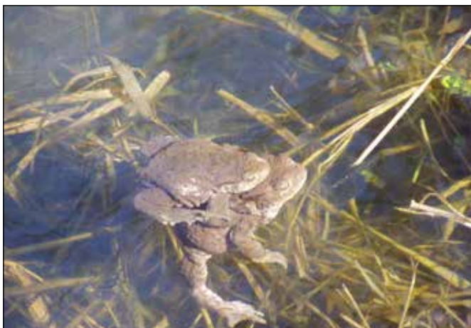
Ropuchy obecné využívající tůňky nad Vojnovicemi k rozmnožování.