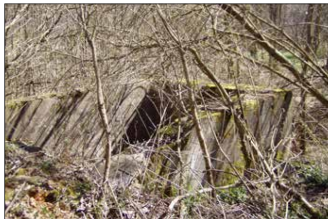
Betonové základy zaniklého vodního mlýna ve Vojnovicích.

Z Vojnovic vede údolím řeky Odry po jejím pravém břehu do další zaniklé obce – do Rudoltovic - cesta, která je roubená věkovitými javory kleny. Na stejném břehu pod cestou jsou zřetelné kamenné zbytky dalšího vodního mlýna využívajícího vodu z řeky Odry.