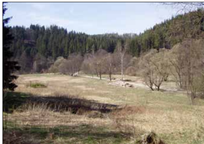
Cesta roubená stromy protínající údolí řeky Odry a vedoucí z Podlesí do Rudoltovic.

Na pravém břehu Odry cesta stoupá k bývalým Rudoltovicím přes ostrou pravotočivou zatáčku, pod níž se nacházejí ruiny dalšího vodního mlýna s pilou využívajícího vodu z řeky Odry – Nového mlýna. Ten měl podle Seznamu tyto parametry: Historická adresa: Rudoltovice 80, jeho vlastník: Schwarz, živnost: Mlýn, typ vodního motoru: 1 kolo na horní vodu, hltnost: 350 l/s, využitelný spád: 3,90 m a výkon: 9,44 kW, živnost: Pila, typ vodního motoru: 1 kolo na horní vodu, hltnost: 170 l/s, využitelný spád: 3,60 m a výkon: 3,92 kW.