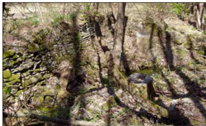
Kamenné rozvaliny Nového mlýna pod Rudoltovicemi.

Na pravém břehu Odry cesta stoupá k bývalým Rudoltovicím přes ostrou pravotočivou zatáčku, pod níž se nacházejí ruiny dalšího vodního mlýna s pilou využívajícího vodu z řeky Odry – Nového mlýna. Ten měl podle Seznamu tyto parametry: Historická adresa: Rudoltovice 80, jeho vlastník: Schwarz, živnost: Mlýn, typ vodního motoru: 1 kolo na horní vodu, hltnost: 350 l/s, využitelný spád: 3,90 m a výkon: 9,44 kW, živnost: Pila, typ vodního motoru: 1 kolo na horní vodu, hltnost: 170 l/s, využitelný spád: 3,60 m a výkon: 3,92 kW.