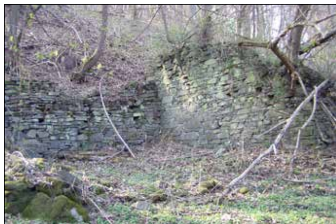
Zbytky vodního mlýna Bílá Lhota (Šnečího mlýna) nad soutokem Odry s Něčínským potokem.

využitelný spád: 3,65 m a výkon: 3,03 kW. Tento mlýn je v terénu dohledatelný na pravém břehu řeky Odry podle náhonu, zbytků zdí i kamenného klenutého sklepa.