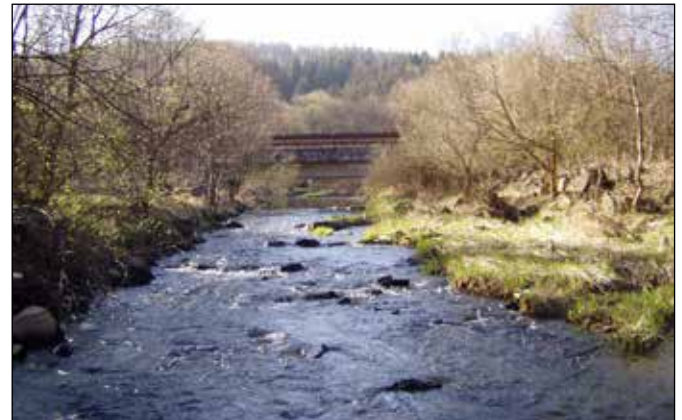
Řička Odra pod soutokem Odry s Plazským a Libavským potokem.