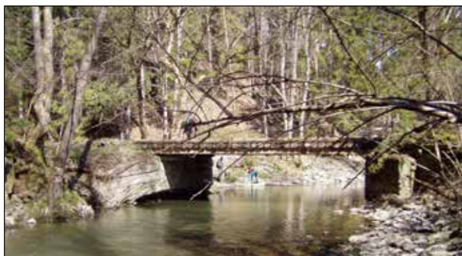
Most přes řeku Odru pod Podlesím.

Na levém břehu řeky Odry nad zaústěním Podléského potoka stával další zvaný Richterův, který však byl nejen mlýnem, ale i pilou. Toto vodou poháněné vodní dílo mělo podle Seznamu tyto parametry: Historická adresa: Šumvald (dnes Podlesí) 85, jeho vlastník: Zimmer, živnost: Mlýn, typ vodního motoru: 1 Francisova turbína, hltnost: 235 l/s, využitelný spád: 3,20 m a výkon: 5,55 kW, živnost: Pila, typ vodního motoru: 1 kolo na horní vodu, hltnost: 300 l/s, využitelný spád: 3,15 m a výkon: 6,07 kW. Pod tímto mlýnem křížuje údolí řeky Odry další historická cesta vedoucí z Podlesí do zaniklé obce Rudoltovice. Odru překonává jednoduchým ocelovým mostem s dřevěnou mostovkou a s betonovými pilíři a na pravém břehu ji lemují stromořadí z javorů, jasanů, bříz a dalších listnatých dřevin. Cesta je vydlážděna kameny a slouží již dlouhé desítky let bez potřeby nějaké zásadnější opravy.