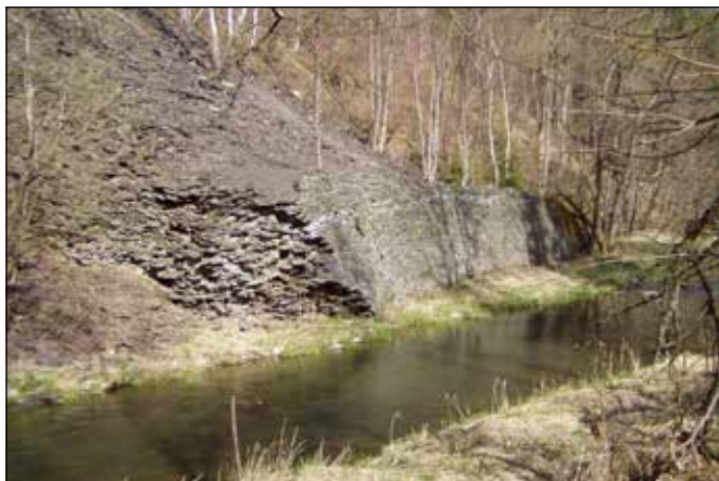
Úpatní kamenná zed' zamezující sesutí odpadní břidlice do řeky Odry.

K výše popsané změně směru toku řeky Odry dochází za mlýnem a souvisí to s dalšími geologickými a geomorfologickými zajímavostmi v zalesněném svahu nad levým břehem Odry. Přímo nad ohbím Odry v místě geologického zlomu se nachází středověká štola po těžbě stříbrné rudy – galenitu, nazývaná Vilibald. Další podobné štoly objevíte ve stejném svahu níže po toku. Zajímavé je, že se v této lokalitě podobně jako u Barnova pokoušel jeden budišovský právník obnovit těžbu stříbrné rudy v době zahájení provozu na lokální železniční trati Suchdol n. O. – Budišov n. Bud. v roce 1891. Tuto nedlouho trvající těžbu připomíná stříbrná výtěžková medaile vyražená z první vytěžené rudy ve stejném roce. Jelikož se stříbrné štoly nacházely těsně nad řekou, byla hlušina vyvážena pomocí mostu přes Odru a důlních vozíků na protější pravý břeh. Halda a kamenné zbytky budov to dokládají i v současnosti.