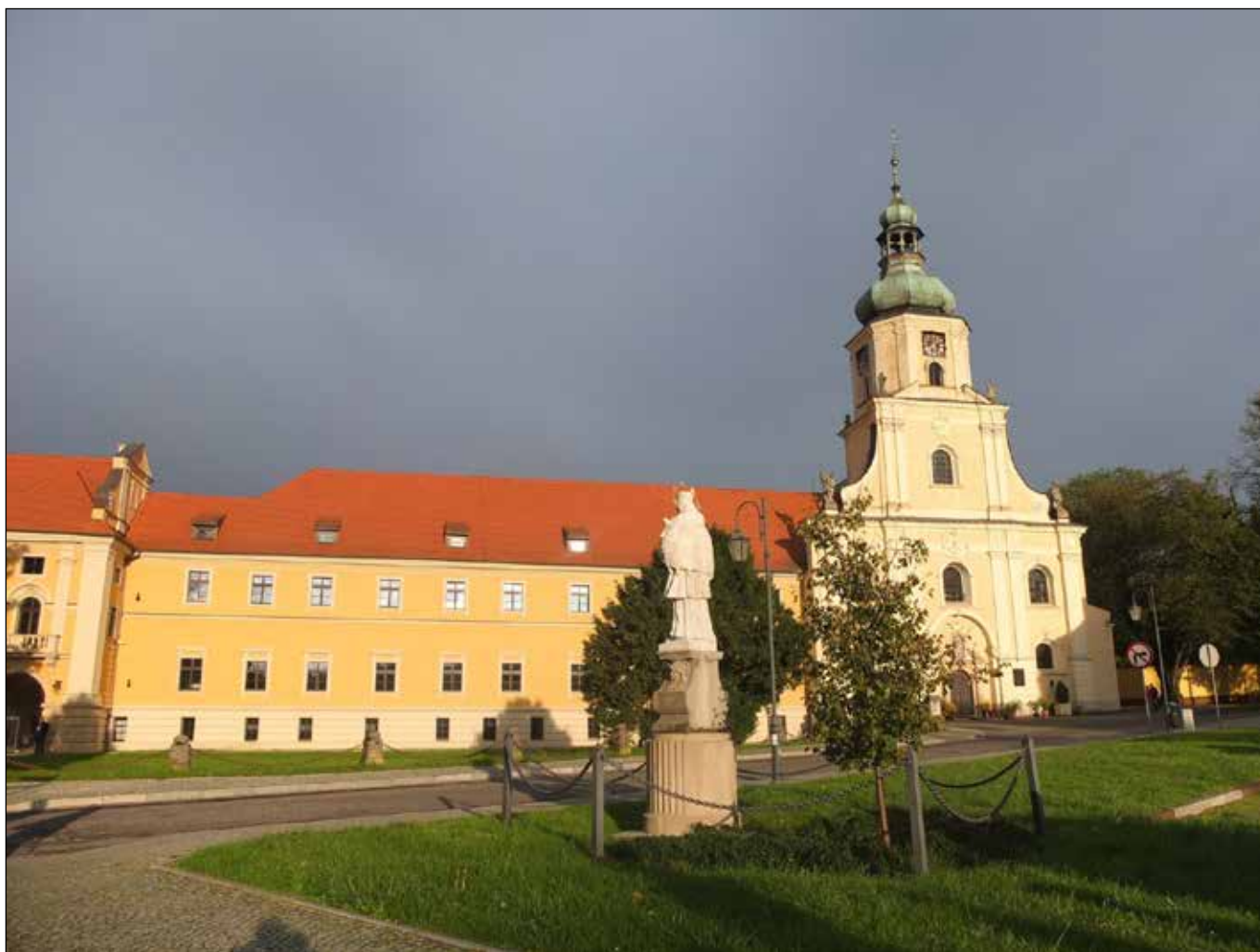
Rekonstruovaný zámek-klášterní komplex cisterciáků v Rudě.