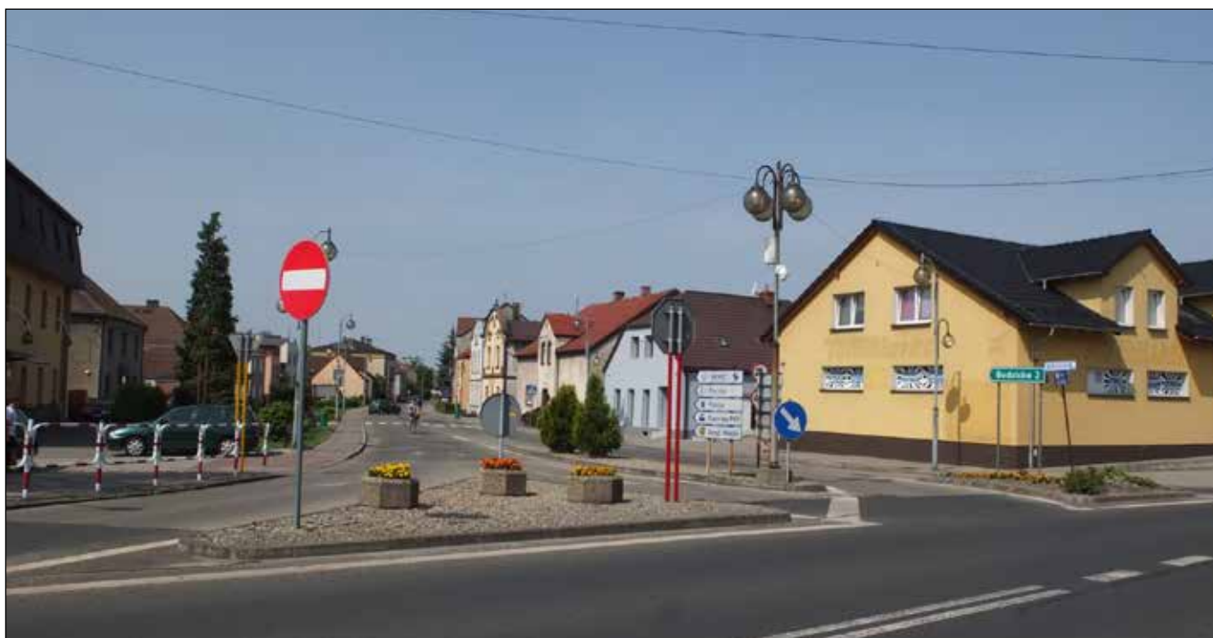
Náměstí Adama Mickiewicza v Kuźnii Raciborske.