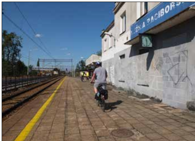
Železniční stanice Kuźnia Raciborska.

Kuźnia Raciborska má svou železniční stanici na elektrifikované trati č. 150 Kedzierzyn-Koźle – Chalupki. S okolními městy a místy je rovněž spojena autobusovou dopravou. Pro našince bylo nezvyklé využívání chodníků cyklisty, i když se nejednalo o cyklostezky.