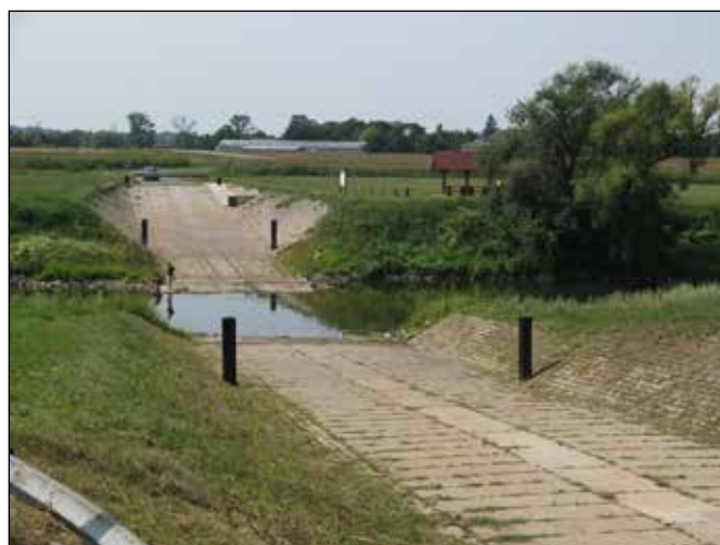
Brod přes řeku Odru u vesnice Przewóz.