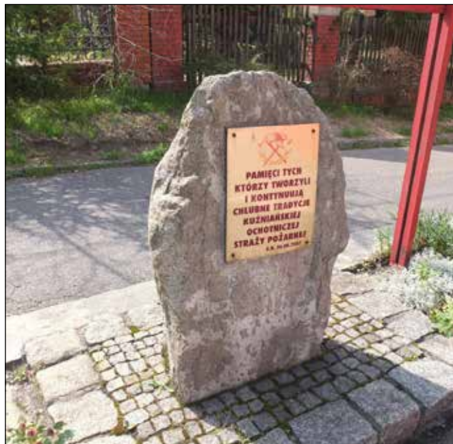
Památník osvobození s pamětní tabulí připomínající požár v roce 1992.