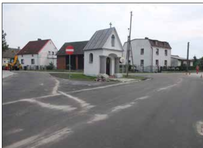
Kaplička v křižovatce v Turze.