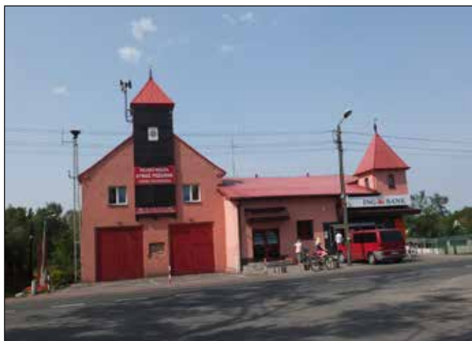
Hasičská zbrojnice v centru města.