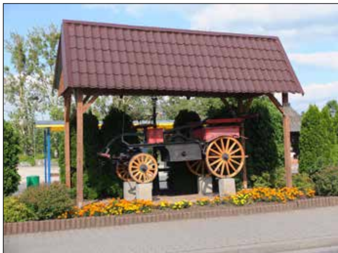
Historická požární stříkačka před hasičskou zbrojnicí.