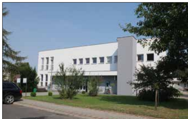
Kulturní dům v Kuźnii (MOKSIR).