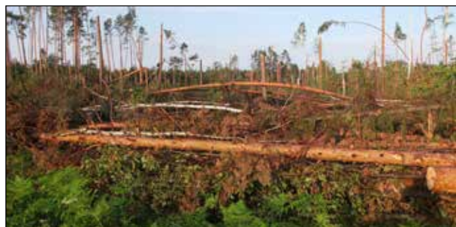
Polámané stromy v lese u Kuźnie po letošním tornádu.

Aby toho nebylo málo, letos před naším cyklistickým příjezdem do Kuźnii se částí lesa nepoškozenou požárem prohnalo tornádo. To polámalo stromy jako třísky na asi 1 500 ha lesa, ale i ve městě. I toto přírodní neštěstí vyvolalo okamžitý zákaz vstupu i vjezdu do postižených lesů z bezpečnostních důvodů. To nám znemožnilo užívat si lesních cyklotras a cest a museli jsme při poznávání okolí Kuźnie využívat poměrně úzké a frekventované silnice. Od 23. listopadu 1973 je okolo 50 000 ha lesních komplexů součástí Parku Krajobrazowego „Cysterskie Kompozycje Krajobrazowe Rud Wielkich” (obdobu naší kategorie chráněná krajinná oblast).