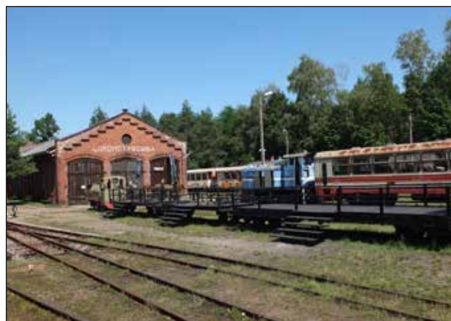
Lokomotivní dílny na nádraží v Rudach.