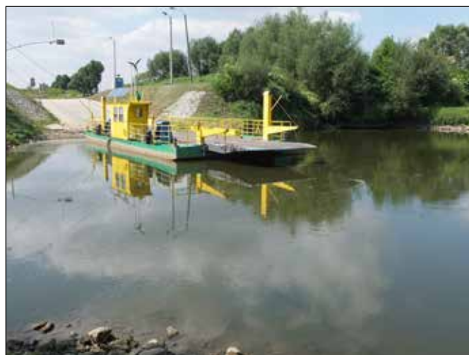
Přívoz přes řeku Odru v Ciechowicích.

velkou řekou, a sice brod. Ten není zcela jistě určen pro běžný automobilový provoz ale jen pro těžkou dopravu s vysokým ponorem. Zajímavé u tohoto brodu však je zřízení turistických přístřešků s ohništěm na obou březích řeky Odry.