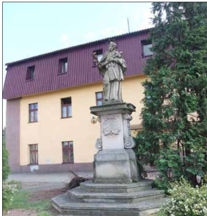
Socha sv. Jana Nepomuckého na náměstí.