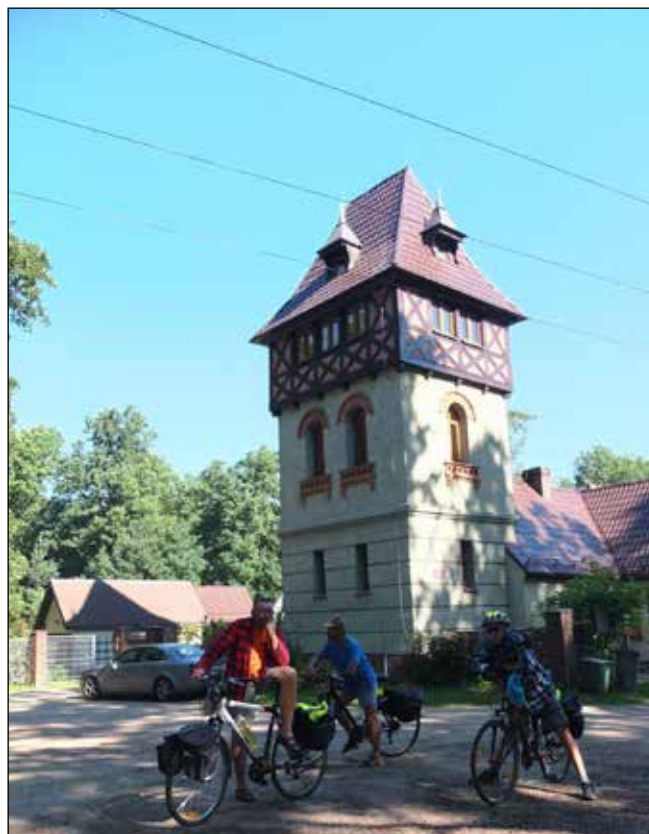
Hájovna Wildek v Rudě Kozielske.