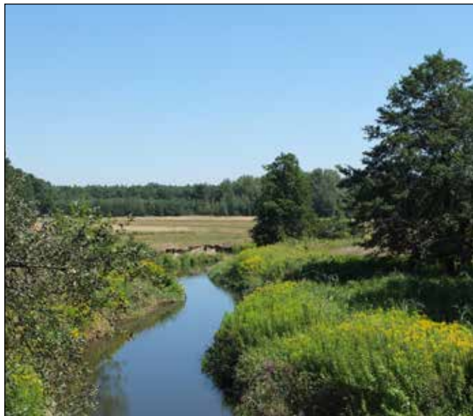
Říčka Ruda nad místní částí Rudy.

Kuźnia Raciborska je městem (= gmina) v okrese (= powiat) raciborskim a v západní části kraje (= województwo) ślaskiego a leží na polském horním toku řeky Odry a na dolním toku říčky Rudy. Zatímco říčka Ruda Kuźniou přímo protéká a v poslední době je využívána k rekreační plavbě na kajacích, kanojích i nafukovacích lodích, řeka Odra je od centra města vzdálena asi 3,8 km, prozatím není pro větší lodě splavná a ani pro rekreační plavbu na menších lodích není využívána. Kuźnia každoročně pořádá na řece Odře u soutoku s říčkou Rudou poblíž místní části Turze přehlídku netradičních plavidel.