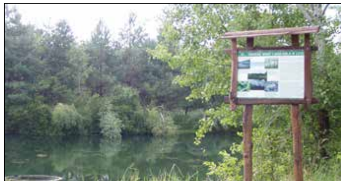
Protipožární nádrž na bývalém požářišti.

Aby toho nebylo málo, letos před naším cyklistickým příjezdem do Kuźnii se částí lesa nepoškozenou požárem prohnalo tornádo. To polámalo stromy jako třísky na asi 1 500 ha lesa, ale i ve městě. I toto přírodní neštěstí vyvolalo okamžitý zákaz vstupu i vjezdu do postižených lesů z bezpečnostních důvodů. To nám znemožnilo užívat si lesních cyklotras a cest a museli jsme při poznávání okolí Kuźnie využívat poměrně úzké a frekventované silnice. Od 23. listopadu 1973 je okolo 50 000 ha lesních komplexů součástí Parku Krajobrazowego „Cysterskie Kompozycje Krajobrazowe Rud Wielkich” (obdobu naší kategorie chráněná krajinná oblast).