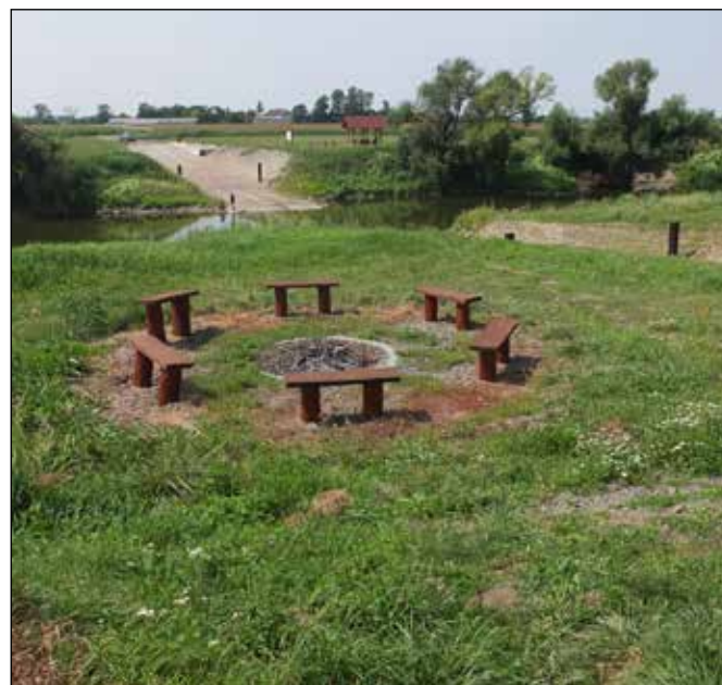
Ohniště a přístřešek u brodu.