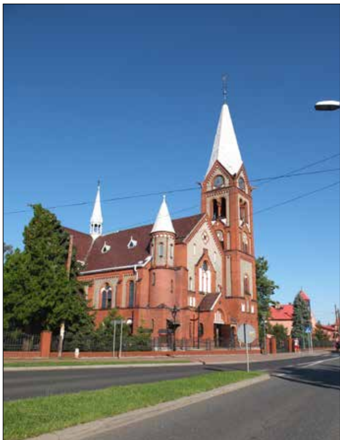
Kostel sv. Máří Magdalény v centru Kužnií.