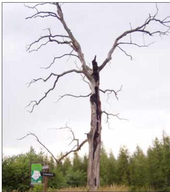
Ohořelý dub jako svědek požáru z roku 1992.