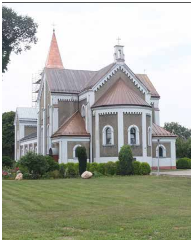
Kostel Nejsvětějšího Srdce Pana Ježíše v Turze.