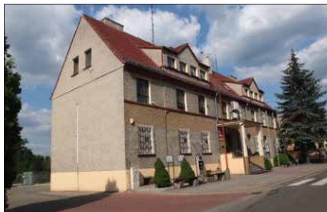
Budova radnice v Kuźnii Raciborske.

Na náměstí v Kuźnii stojí pískovcová socha sv. Jana Nepomuckého. U hasičské zbrojnice můžete vidět památník na počest místních dobrovolných hasičů odhalený dne 26. 8. 2007. Před ní je přes hlavní silnici pod přístřeškem vystavena stará koňská hasičská stříkačka. Za ní se rozprostírá zpevněná plocha nesoucí jméno Vítezství (Zwyciestwa), kde se nachází autobusové stanoviště, památník osvobození za 2. světové války a na lesní požár v roce 1992, kaplička, parčík a v něm malý amfiteátr. Na Kostelní ulici za hasičskou zbrojnicí stojí po levé straně obchody a na pravé straně farní kostel sv. Máří Magdalény (Świątey Marii Magdaleny) s farou a s památníkem věnovaným obětem 2. světové války a připomínce původního kostela. Stávající kostel byl postaven z cihelného zdiva v letech 1902-1903 podle projektu Ludwiga Schneidera jako trojlodní s transeptem v novogotickém slohu s novorománskými prvky. Jižně od kostela s farou se nachází velký a pěkně upravený hřbitov s centrální lipovou alejí.