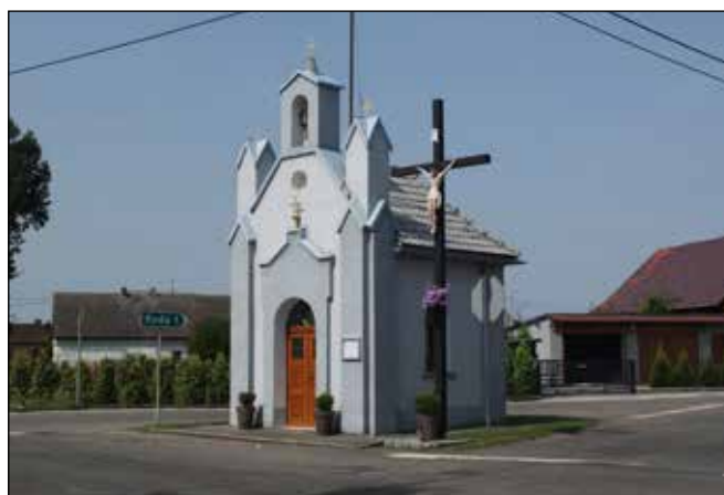
Kaplička v křižovatce v Kuźnii Raciborske.