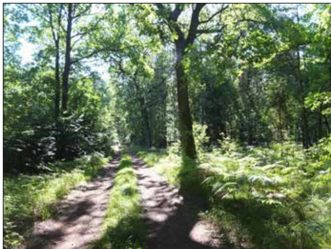
Lesy v okolí Rud.

I to mohlo v konečném důsledku přispět k druhé nešťastné události, a to k jednomu z nejničivějších lesních požárů způsobených jiskrou od brzd elektrické lokomotivy 26. 8. 1992. Tehdy shořelo celkem asi 9 000 ha lesa a při hašení zemřeli dva hasiči. Na uvedené webové adrese se můžete podívat na filmovou reportáž z tohoto požáru: https://www.youtube.com/watch?v=Z8bu6jqVLtY . Na paměť tohoto ničivého požáru byl v Kuźnii ve středu města před požární zbrojnicí odhalena pamětní deska na betonovém památníku. Celé požářiště bylo vybaveno strážními věžemi, požárními průseky, novými cestami, požárními nádržemi a lesníci jej začali postupně zalesňovat. Z bezpečnostních důvodů byl vjezd i vstup na požářiště omezen. V posledních letech město Kuźnia na požářišti organizovalo cyklistické jízdy spojené s plněním různých úkolů, jedné takovéto akce jsme se účastnili v roce 2006.