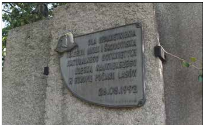
Pamětní deska na památníku v Kuźnii Raciborske.