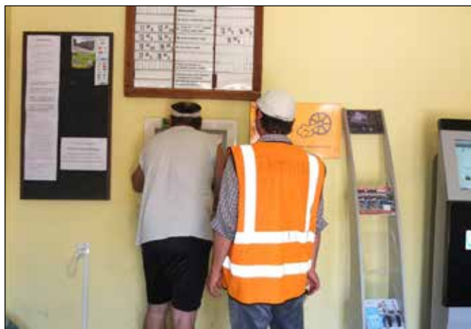
Nádraží úzkorozchodné železnice v Rudach.