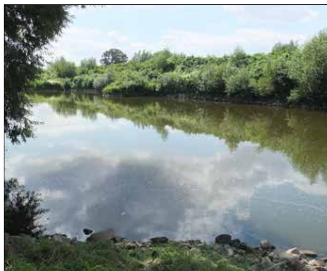
Řeka Odra u Kuźnie Raciborske.

Řeka Odra má zregulované koryto porostlé povětšinou vrbovým břehovým porostem, takže se k jejímu korytu nedá všude dostat. Poblíž Kuźnie na ní není zřízen žádný most, takže přepravu přes ní nejbližše zajišťuje přívoz poblíž vesnice Ciechowice. Při naší dovolenkové cestě však nefungoval – zřejmě kvůli nízkému stavu vody. Pod Kuźniou u obce Przewóz můžete na Odře vidět další zajímavé řešení křížení komunikace s takto