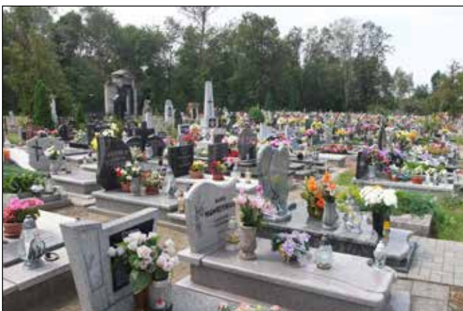
Městský hřbitov v Kužnií.