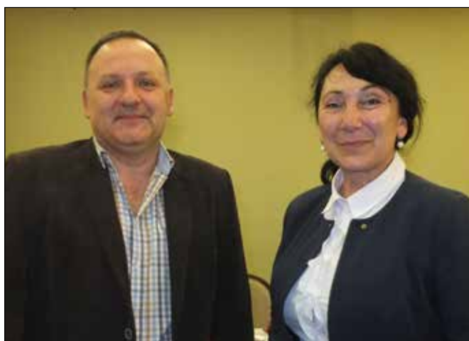
Starosta a místostarostka Kuźnie Raciborske.