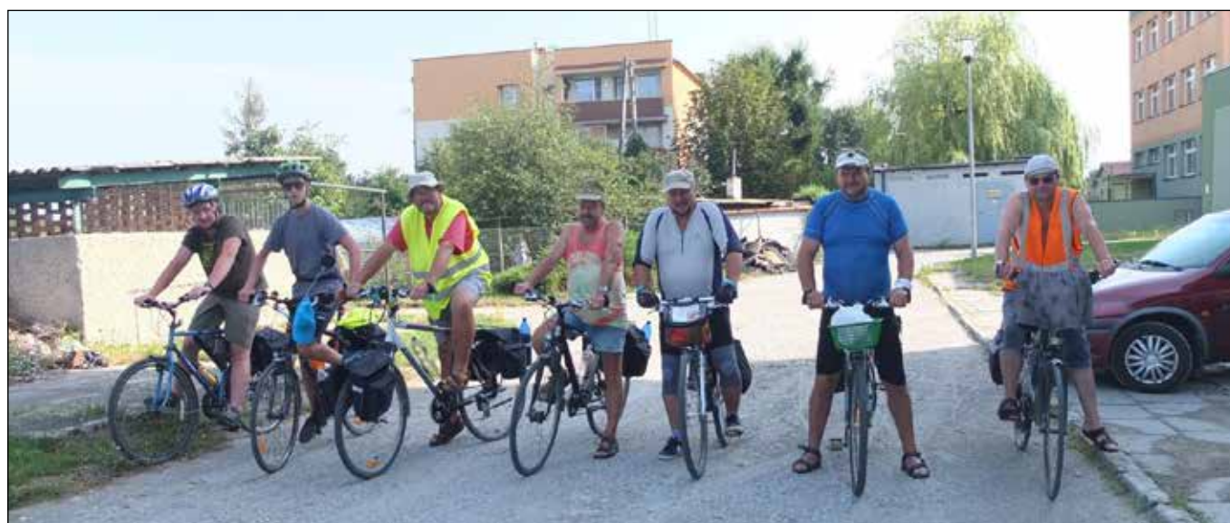
Účastníci letošní cyklovolené v Kužnii Raciborske.