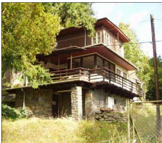
Hadinka 2016, Gajovského vila.