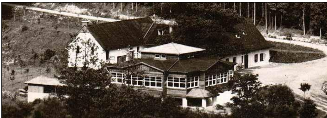
Hadinka 1936. Pohled na přestavěný areál hostince „Ottermühle“ s budovou tanečního pavilonu.