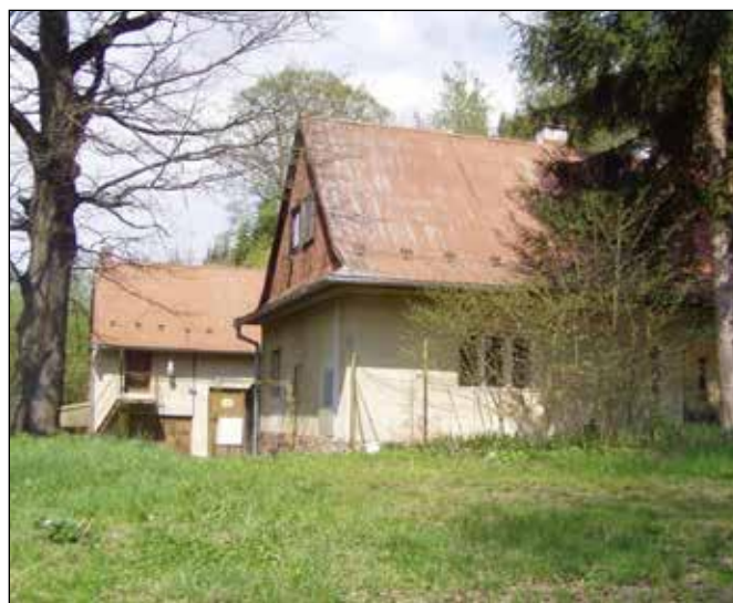
Hadinka 2016, necitlivě přestavený hostinec - jižní křídlo.