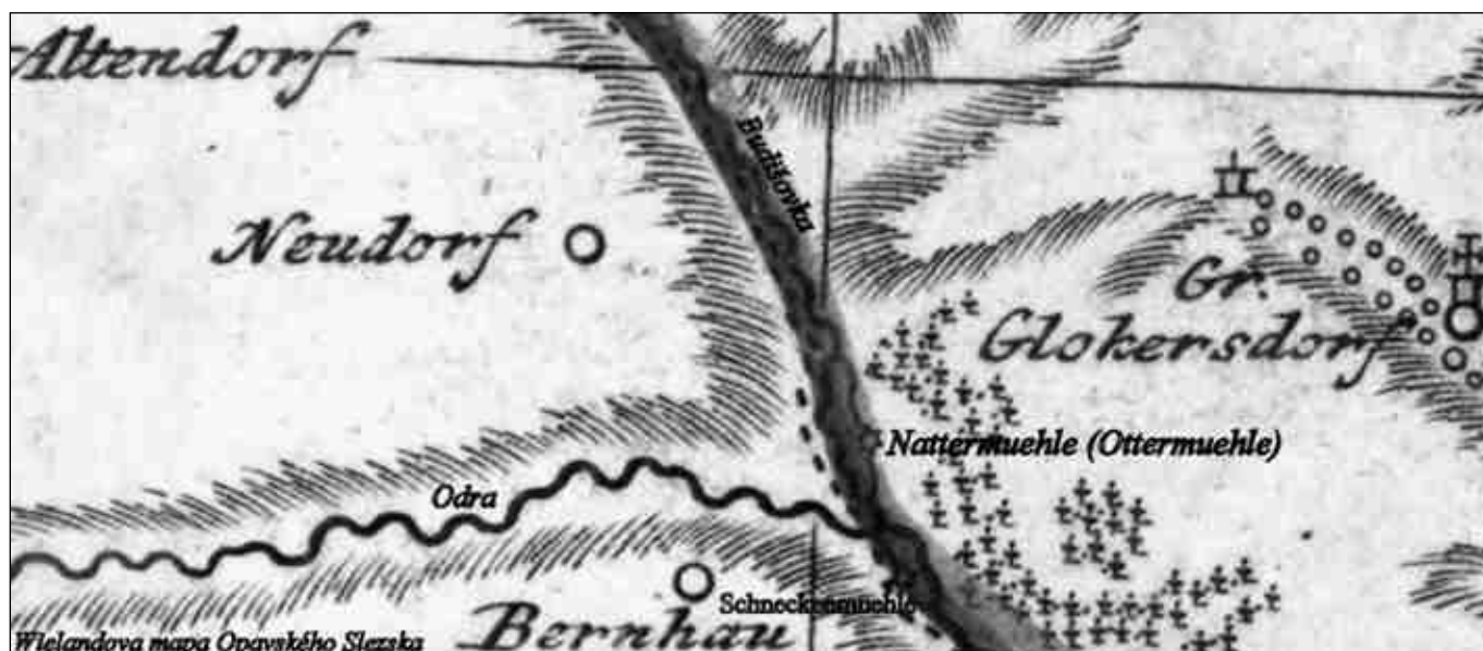
Výřez z Wielandovy mapy Slezska (1736) se zakreslením mlýnů „Nattermühle“ i „Schneckenmühle“, www.mapy.mzk.cz