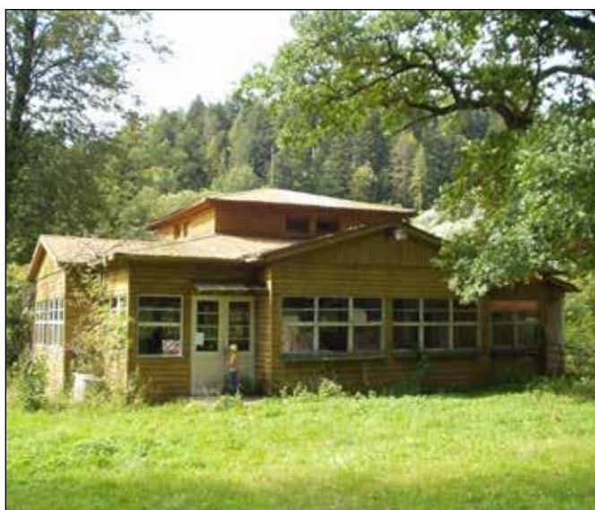
Hadinka 2016, exteriér tanečního pavilonu.