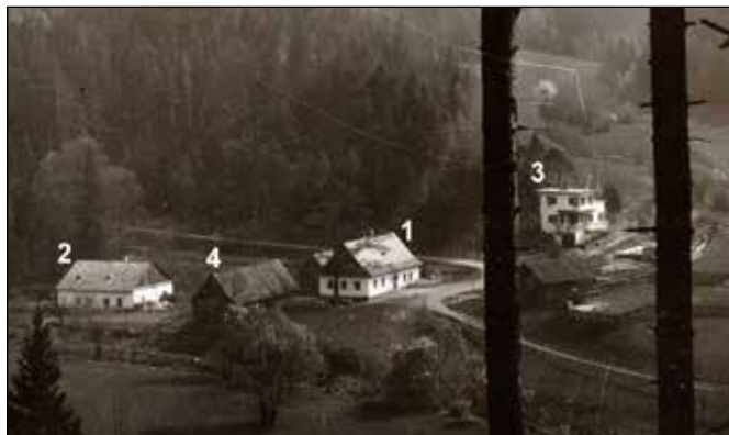
Hadinka 1933-1934, ještě bez tanečního pavilonu. Pohled do údolí Budišovky. 1 - hostinec, 2 - bývalá pila, 3 - Gajovského vila, 4 - skladovací budova (stodola).