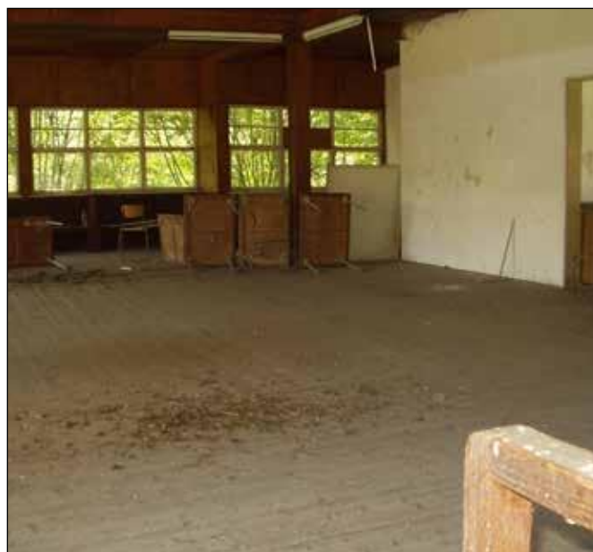
Hadinka 2016, interiér tanečního pavilonu. V dobách slávy měl nalevo místo orchestr, napravo stávalo občerstvení.