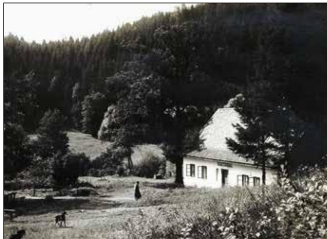
Hadinka v letech 1910–1920, hájovna s výletním hostincem „Ottermühle“ - harmonie s okolní přírodou.

Podle kupní smlouvy ze 14. dubna roku 1926 nabyla vlastnické právo na klokočovské panství a Hadí mlýn „Revírní rada pro okres moravsko-slezského revírního báňského úřadu v Moravské Ostravě“. Ta svými budoucími investičními aktivitami 19 ovlivnila ve 30. letech 20. století rozvoj této oblasti ve výletní a ozdravné středisko. Pozitivní dopady jejich činností se projevují v regionu i v současné době. Revírní rada dala většinu