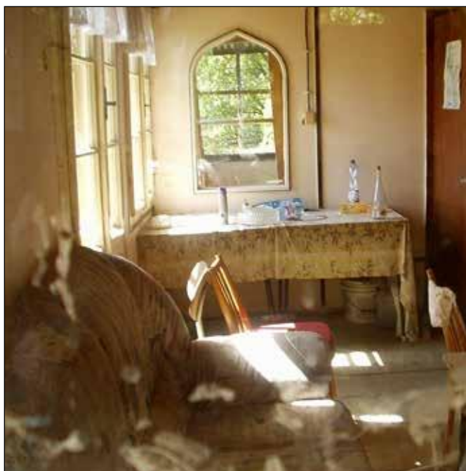
Hadinka 2016, narychlo opuštěný interiér vily.