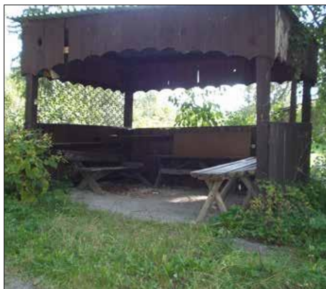
Hadinka 2016, altánek vedle vily.