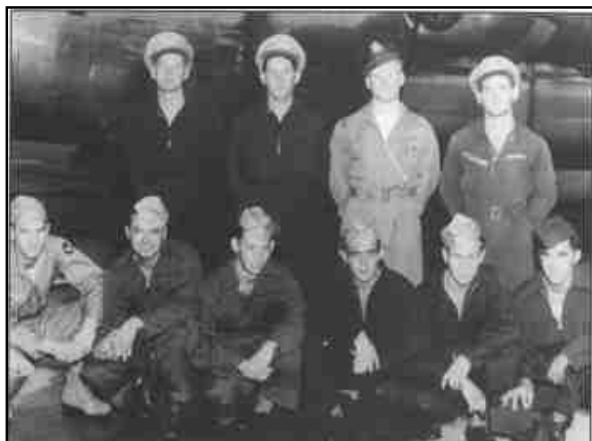
Posádka bombardéru B-24 Liberator „Flying finger“

k 765. bombardovací squadroně 461. bombardovací skupiny 15. letecké armády, letící na pozici číslo tři.