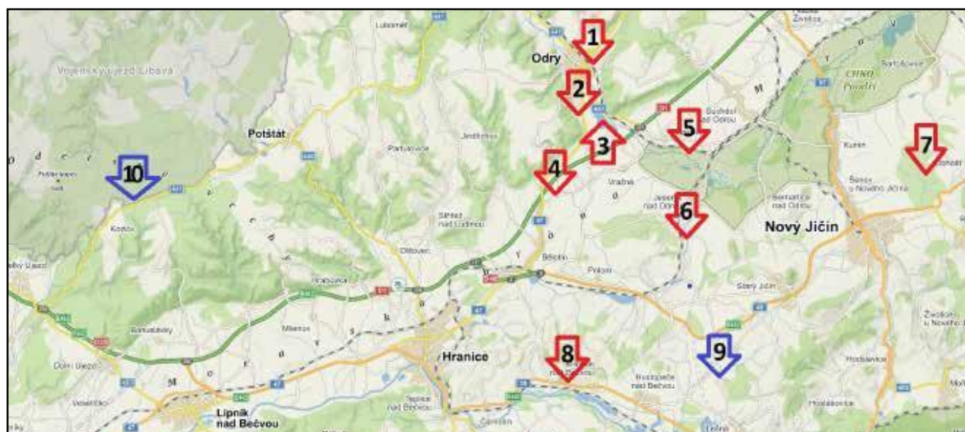
1 – Odry - Skřivánčí, 2 – Odry nad rybníky, 3 – Emauzský rybník, 4 – Hynčice, 5 – Mankovice, 6 – Polouvsí, 7 – Libhošť, 8 – Milotice nad Bečvou, 9 – Palačov, 10 – Kozlov