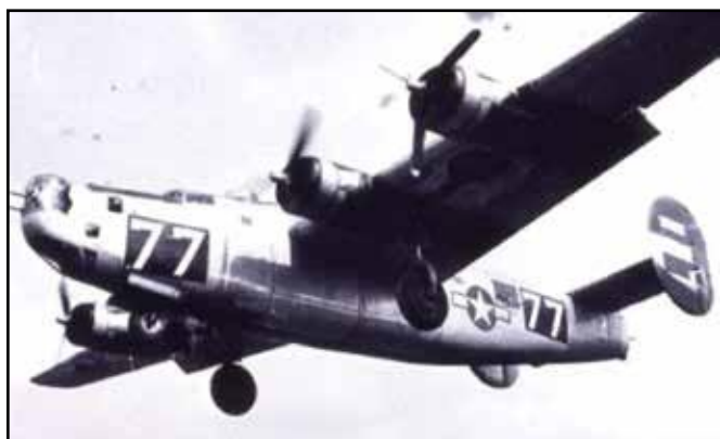
Bombardér B-24 Liberator „77“, který havaroval u Kozlova

nedochovaly téměř žádné dokumenty. Dle výpovědi přeživších letců a palubních střelců z dalších letadel letky byl bombardér napaden stíhačkou Focke-Wulf Fw 190 a začal ve vzduchu hořet. Před výbuchem stroje ve vzduchu se podařilo čtyřem letcům vyskočit, a to třem střelcům a radistovi. Letci byli rychle zajati.