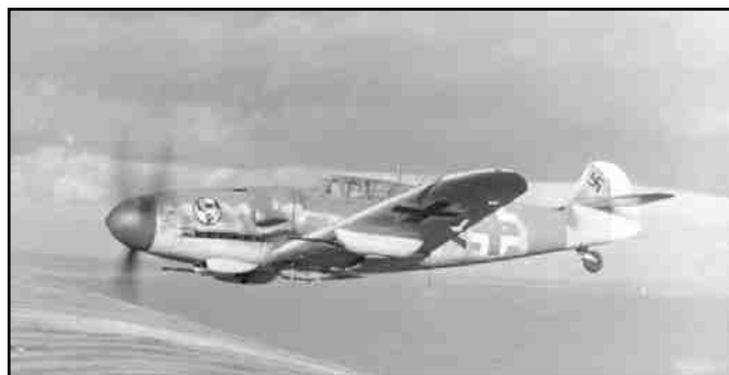
Messerschmitt Bf 109 G-6