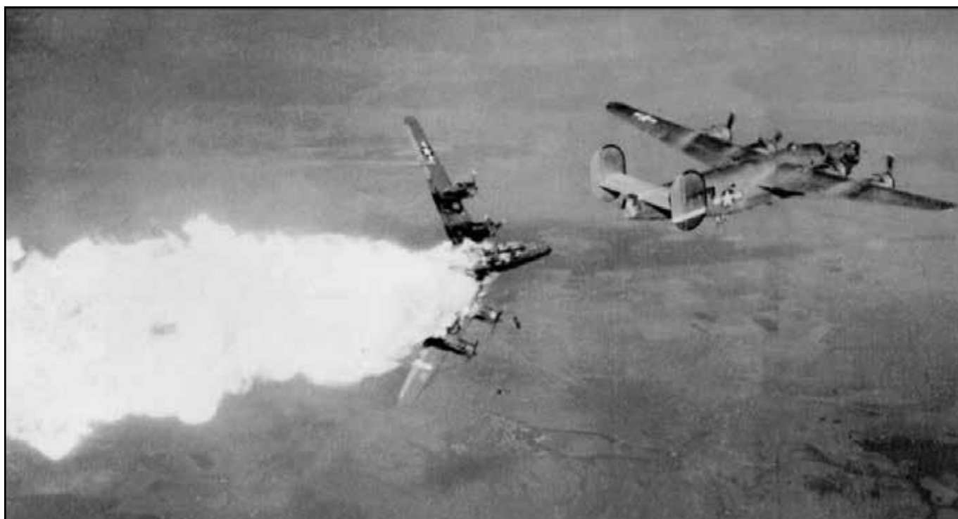
Bombardér Liberator B-24 sestřelen nad Blechhammerem 20. 11. 1944

V loňském roce uplynulo 75 let od největší letecké bitvy nad naším územím, která proběhla 17. prosince 1944. Přestože cílem náletů americké armády byly petrochemické závody v Horním Slezsku, odehrála se letecká bitva nad územím tehdejšího Protektorátu, v prostoru mezi Prostějovem, Uničovem, Opavou a Novým Jičínem. Vzhledem k velkým ztrátám nasazených pilotů i vojenských letadel si tato bitva vysloužila název „Krvavá neděle“