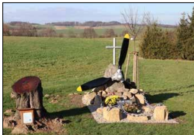
Palačov - pomník

V roce 2007 byl památník poškozen a vrtule ukradena. Místní lidé se složili na opravu pomníku a 29. července 2008 se na pomník vrátila plastová replika vrtule. Této události se zúčastnili i zástupci amerického velvyslanectví. Ve stejném roce provedli členové Klubu přátel Suchdolu nad Odrou průzkum místa dopadu a podařilo se jim nalézt několik fragmentů letadla. Ty jsou vystaveny v suchdolském muzeu společně s dalšími částmi, které zapůjčili obyvatelé Palačova.