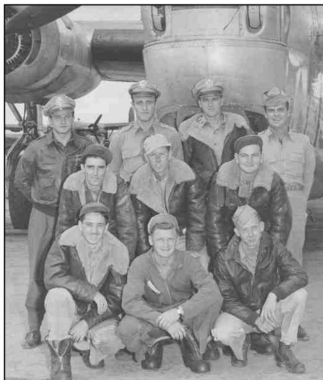
Posádka havarovaného bombardéru u Kozlova během výcviku v USA