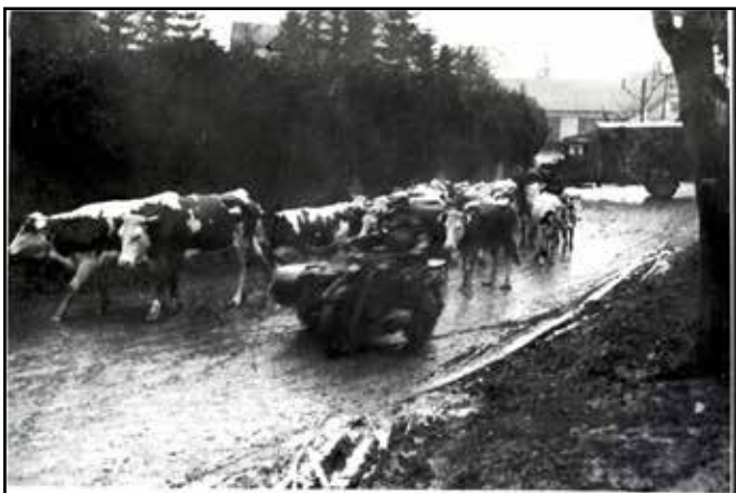
Volkssturm žene krávy z německých obcí přes Spálov, březen 1945.