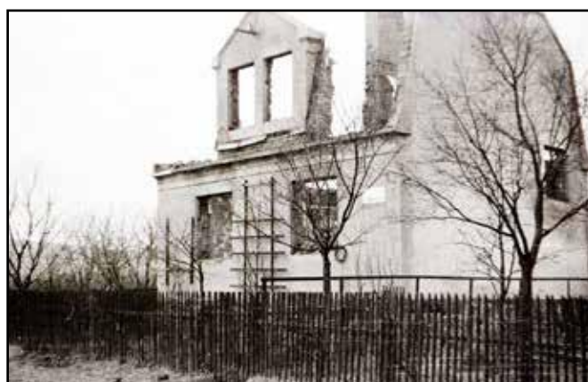
1945 Odrý. Torzo domu na Pramenní ulici zasaženého dělostřeleckými granáty.