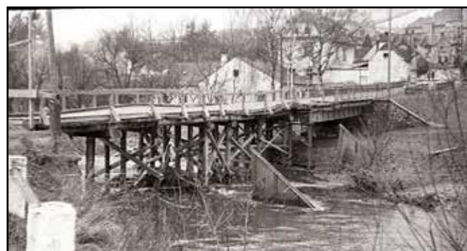
1946 Odrý, opravený Jánský (Dlouhý) most po jeho zničení německou armádou v roce 1945.