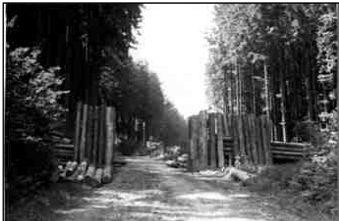
Protipancéřová uzávěra na silnici v Mlýnici u Spálova, jaro 1945.

k Luboměři, kdy už byl celý Spálov osvobozen Rudou armádou. Ruští vojáci prohledávali domy a sklepy, kde hledali německé vojáky. Jedli a pili, co se jim nabídl, leckde si vzali i to, co chtěli. Při bojích o Spálov padlo 23 vojáků Rudé armády, 34 německých vojáků a 5 civilních obyvatel; vyhořela usedlost čp. 190, stodola u čp. 42