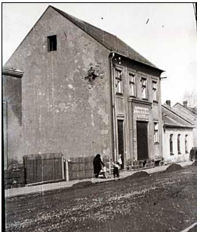
1950 Odry. Dům čp. 553 na Skřivánčí ulici po zásahu dělostřeleckým granátem.

dny útoku Rudé armády na město propadali němečtí obyvatelé panice, přičemž 13 z nich si vzalo život 5 a další zemřeli na zhoršení svého zdravotního stavu.