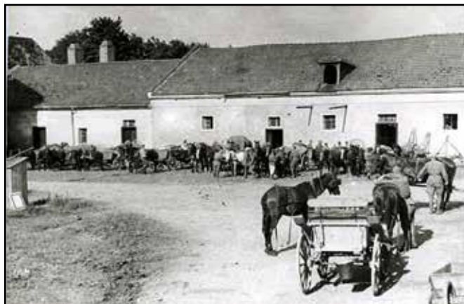
Vojenský zásobovací oddíl Rudé armády na dvoře zámeckého statku ve Spálově v květnu 1945.

a Záštruzný mlýn čp. 122 na Odře (proti Klokočůvku); německá armáda vyhodila most přes Odru u Spálovského mlýna. Spálov byl osvobozen 7. května 1945 po těžkém boji pěchoty a dělostřelectva.