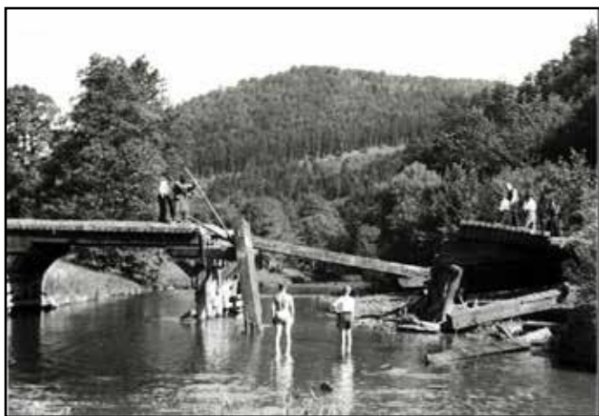
Most přes řeku Odru u Spálovského mlýna, zničený Němci v květnu 1945.