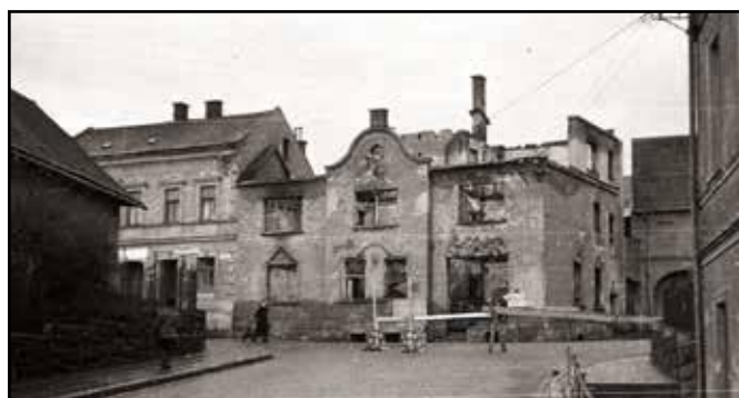
1946-1950. Odrý. Rozbořený dům dělostřeleckými granáty na křižovatce ulic 1. Máje a Nadační.