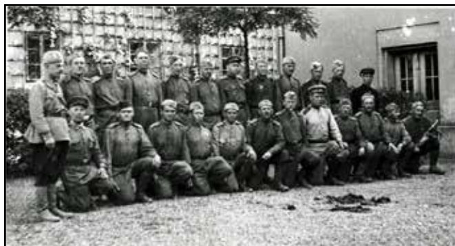
Skupina vojáků Rudé armády na nádvoří zámku ve Spálově, květen 1945.