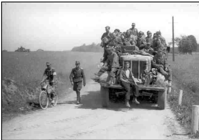
Počátek května 1945. Neorganizované přesuny německých vojáků. Demonstrační dobová fotografie.

Počátek roku 1945 již nenechal nikoho na pochybách, že nadešel poslední rok války. Rychle se roznesla zpráva, že sovětská vojska zahájila velkou ofenzívu. Za několik dní poté byly vidět v celém kraji výsledky náporu sovětských vojsk. Mezi proudy vystěhovalců se na všech silnicích proplétaly vojenské oddíly německé armády. Panoval velký zmatek a zoufalství. Němečtí obyvatelé, zastrašení propagandou velitelství německé armády, se s hysterickou panikou snažili utéci před postupujícími sovětskými vojsky. Rudá armáda v jednotném postupu osvobodila Polsko a vnikla hluboko do německého území. Počátkem února 1945 již bylo slyšet blížící se frontu. Velení německé armády však nehodlalo vpustit Rudou armádu přes Moravskoslezský kraj. Na opevňovací práce byly nahnány tisíce lidí a nacisté použili bývalého opevňovacího pásma, protože Ostravsko bylo vstupní branou na Moravu a do Čech. Většina německého obyvatelstva očekávala s hrůzou příští dny a týdny a připravovala se k evakuaci. Jak probíhaly zaznamenané události posledních dnů války v jednotlivých obcích Oderska, uvádíme v následujícím článku.