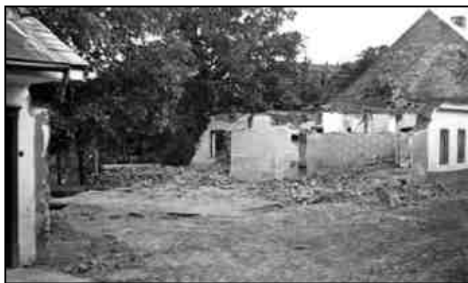
Odry 1946-1950. Demolice domu ve Staré ulici, zasaženého dělostřeleckým granátem.