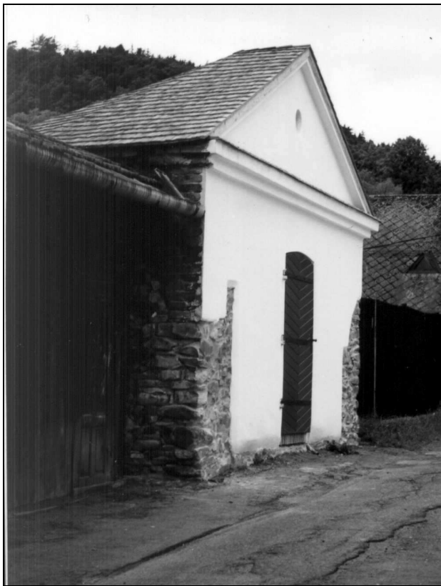
Bašta – pozůstatek středověkého městského opevnění – kulturní památka. Pohled z Pásové ulice

Stále zvyšující se revoluční požadavky, spolu s I. křížovou výpravou vedenou Zikmundem Lucemburským (duben – červenec 1420) neunesla velká část husitské šlechty a přestoupila na „druhý břeh“. V našem regionu většinou nižší šlechta ruší svou podporu husitů a houfně vstupuje do služeb katolického pána Jana z Kravař na Jičíně. Tento postupný přerod našeho regionu ještě umocňuje nová generace feudálů, kteří rezolutně odmítají husitskou revoluci.