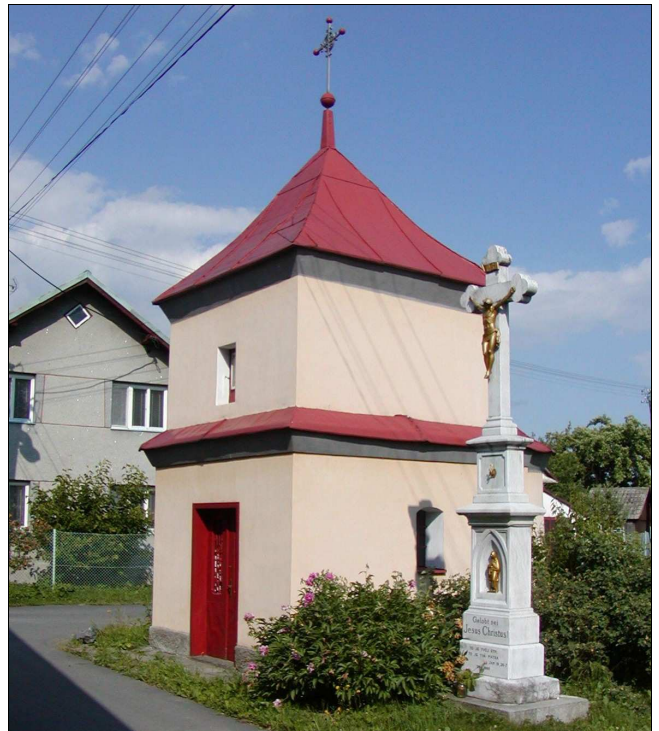
Kaple Zvěstování Panny Marie v Loučkách