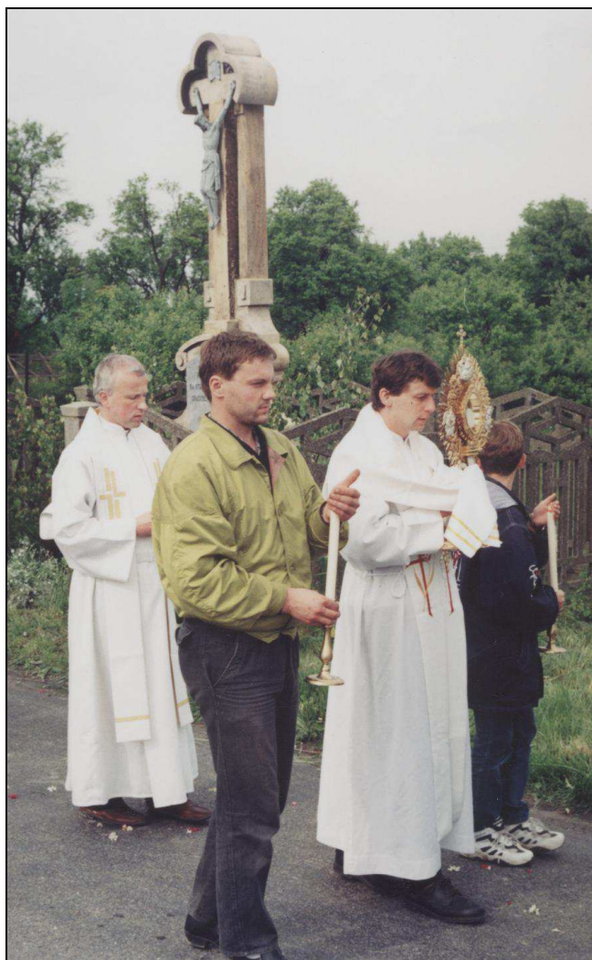
Pohoř, 26. června 1996