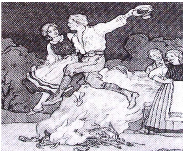
Prastarý zvyk - přeskok svatojánského ohně v páru značil, že svatba nebude daleko. (obrázek z „ Alte Heimat “ 3/2003)

Kromě těchto - často s cibulovou slupkou nahnědo nabarvených - velikonočních vajíček, rozmanitých „Bratlekoláčů“ (na zakulatěném, asi na 45 cm v průměru velikém prkně z lipového dřeva vyválených) nebo „Troatscherkoláčů“, („ Troatscher “ byly jako „Bratlekoláče“, ale s tvarohem, mákem, povidly, džemem naplněné a drobenkou posypané nebo s třešněmi, půlenými švestkami, jablkovými nebo hruškovými kousky pokládané. Většinou byly na 3 hrany zahnuté tak, aby téměř tři- nebo šestiúhlé vypadaly.) dostali kmotřenci ještě něco praktického, většinou nějaké drobné doplňky k oblečení, nějaký oblek, kalhoty, šaty, boty atd. Kmotřenci byli u nás k Velké noci daleko více obdarováni než k Vánocům.