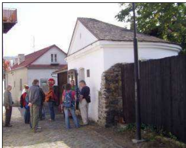
Exkurze u bašty v rámci programu Historického dne

je ji možno navštívit po dohodě na Městském informačním centru na náměstí v Odrách.