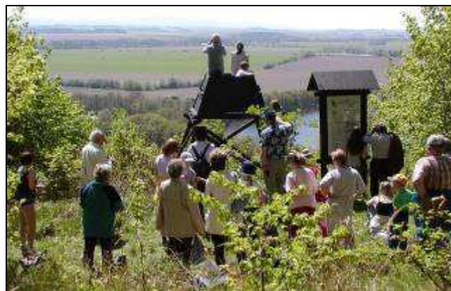
Naučná stezka Stříbrný chodník