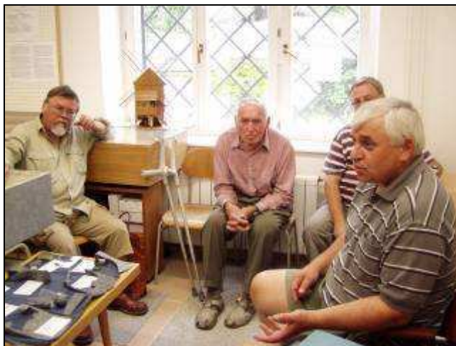
Schůzka spolku v depozitáři