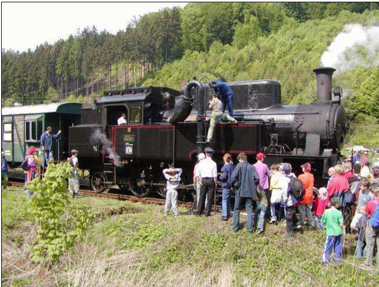
Country expres - jedna z jízď pořádaných Historicko-vlastivědným spolkem