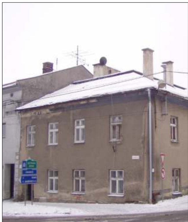
Rodný dům Ernesta Freisslera (6)