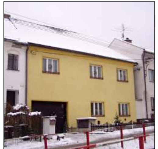
Rodný dům Rudolfa Kobiely (7)