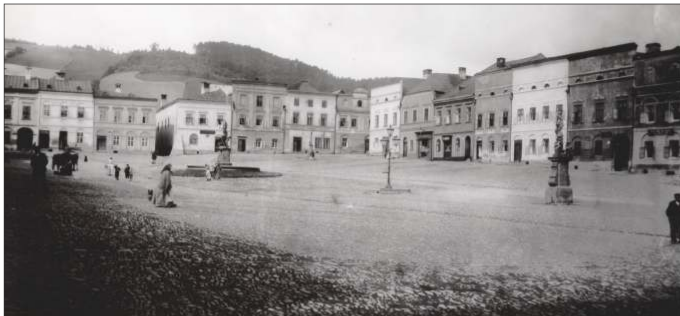
Náměstí na přelomu 19. a 20. století