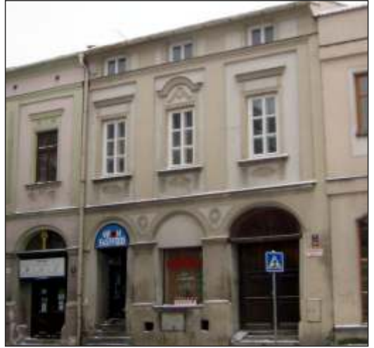
Rodný dům Aloise Kleina (3)