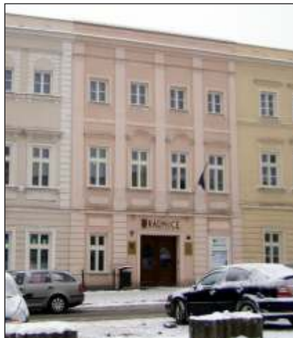
Dům, ve kterém žil Vincenz Tomas (4A)