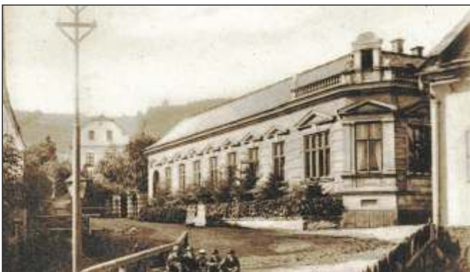
Rodný dům Gustava Gerlicha na dobové fotografii (8)