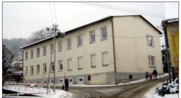
Současný vzhled rodného domu Gustava Gerlicha (8)