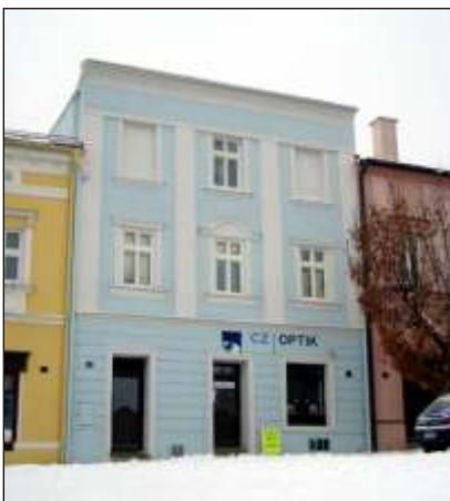
Rodný dům Augusta Herzmanskeho (9)