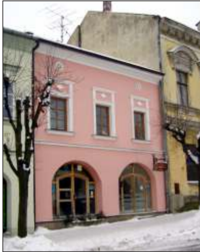
Rodný dům Emila Zimmermanna (2)