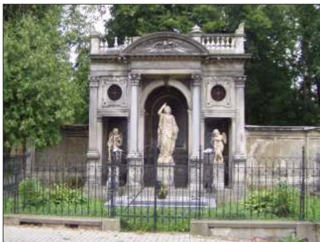
Hrobka rodiny Gerlichovy na městském hřbitově