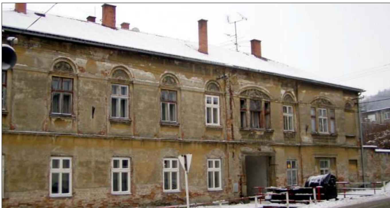
Budova bývalé textilní továrny Gerlich (10A)