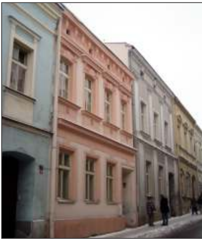
Rodný dům Antona Rolledera (růžový) (4)