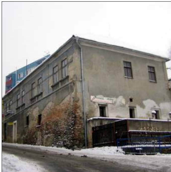
Rodný dům Gustava Kreitnera (13)