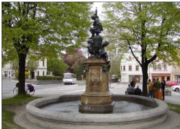
Kašna Emila Zimmermanna na Masarykově náměstí