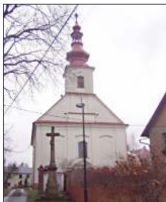
Kostel sv. Petra a Pavla (8)