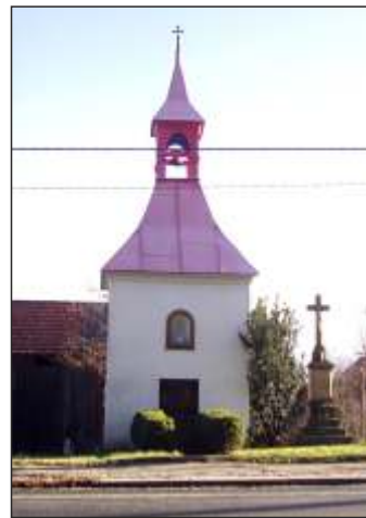
Kaple sv. Floriána v Emauzích (20)