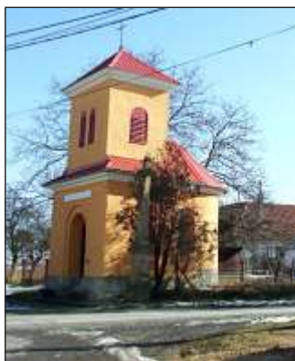
Kaple sv. Panny Marie 1859 (11)