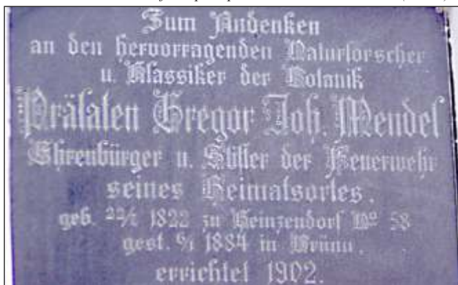
Pamětní tabulka na historické hasičské zbrojnici (15)