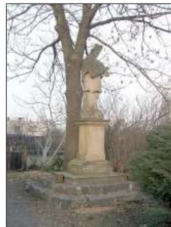
Socha sv. Floriána z r. 1708 u křižovatky ve Vražném (3)