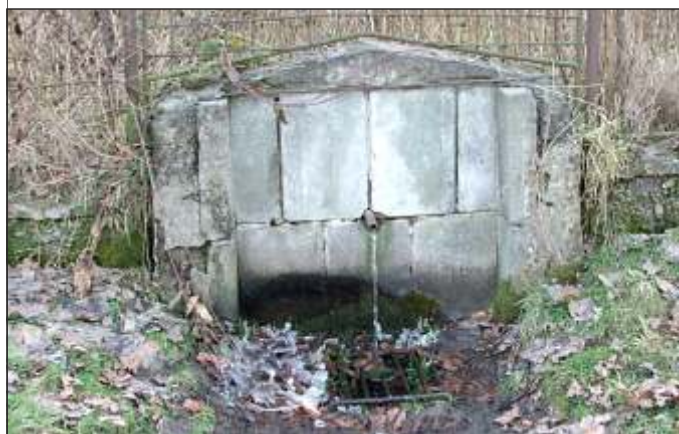
Občasný pramen pod bývalým vraženským vodojemem (5)