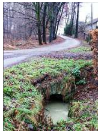
Kamenný propustek (10)