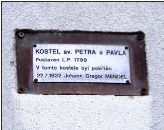
Pamětní tabulka ke křtu J. G. Mendela na kostele ve Vražném (8)