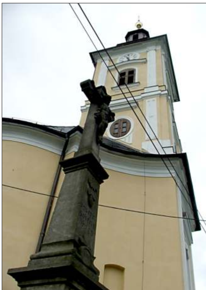
Farní kostel Navštívení P. Marie v Mankovicích, postaven r. 1795 (1)