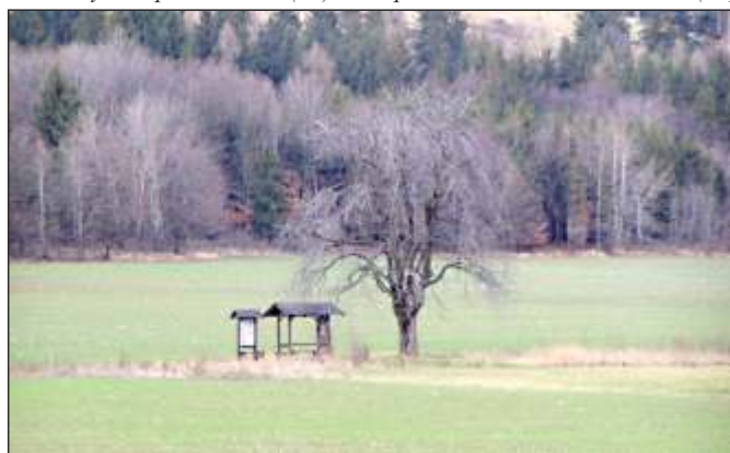
Mendelův jírovec s posezením (19)