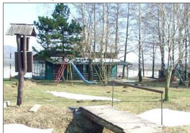
Areál u vodní nádrže Emauzy (21)

Po prohlídce jsme pokračovali přes dálnici D1 (17) s oboustrannými odpočívkami směrem k silnici I/47, po které jsme pak došli do Emauz. V polích pod Veselským kopcem jsme obdivovali Mendelův jírovec (19) s nově vysazenou alejí a s dřevěným přístřeškem pro cykloturisty. V Emauzích stojí zajímavá kaple sv. Floriána (20) a pod osadou se rozkládá areál (21) s klubovnou a sportovním a dětským hřištěm. Vodní nádrž pod areálem je vyhlášeným rybářským revírem.