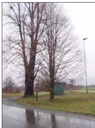
Památný strom - lípa velkolistá, u zastávky ČD v Mankovicích (2)

Poslední ukončovačka uspořádaná dne 28. 12. 2012 vedla z Mankovic přes obec Vražné do osady Emauzy. Poštěstilo se nám neplánovaně si prohlédnout interiér kostela sv. Petra a Pavla ve Vražném (8) a Památník Johanna Gregora Mendela v jeho rodném domě v Hynčicích (16). Cestou jsme ještě navštívili kaple (7, 11, 20) a pomníky (4, 9), občasný pramen u vodárny (5) a zajímavý kamenný propustek (10). Nové i původní mostky, překlenující klidně meandrující Vraženský potok, nejstarší školu (12) i historickou hasičskou zbrojnici (15).