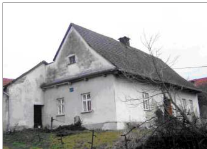
Původní venkovská škola v Hynčičích (12)