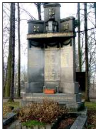
Památník obětem I. svět. války (9)