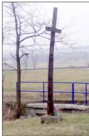
Dřevěný kříž pod Veselím (18)