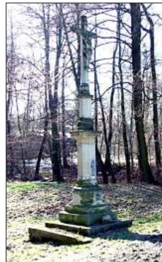
(14) Pískovcový kříž v Hynčičích