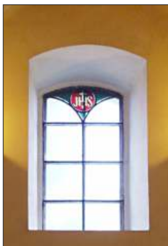
Znaková vitráž a oltář v kostele ve Vražném (8)