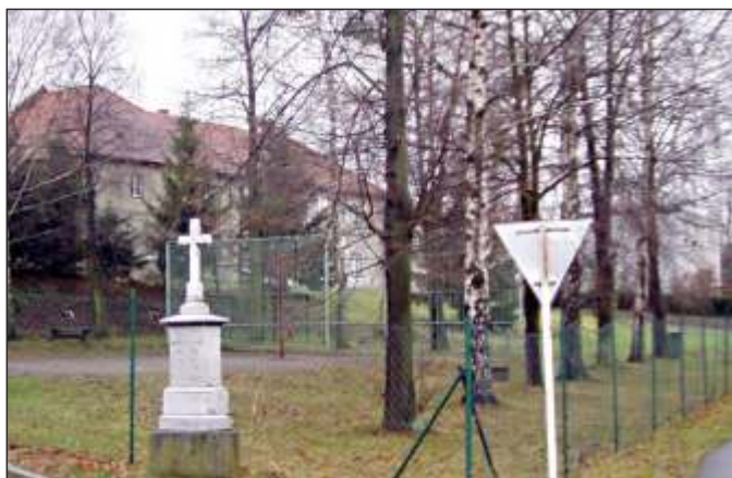
Křížek z r. 1948 před zbrojnicí SDH Vražné (6)