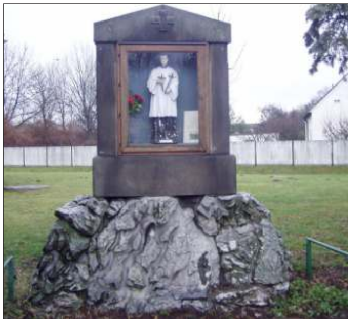
Pomníček zasvěcený sv. Aloisovi (4)