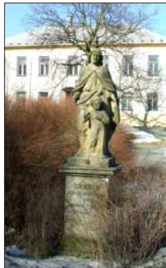
(13) Panna Marie s Jezulátkem