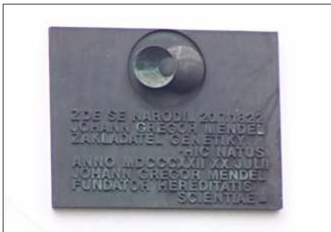
Pamětní deska na památníku (16)