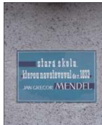
Pamětní tabulka na škole (12)