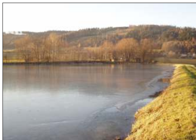
Vodní nádrž Emauzy (21)

V pohostinství Jan Fárek Emauzy (22), kde pořádají každý měsíc zvěřinové hody, jsme poobědvali a autobusem dojeli do Oder. Přestože nám počasí ráno připravilo studenou spršku, během dne se vyjasnilo a domů jsme odjízďeli v prosluněném odpolední.