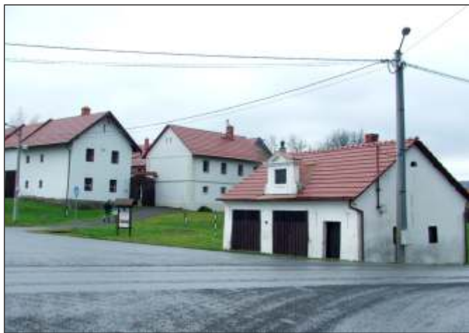
Historická hasičská zbrojnice před památkem J. G. Mendela (15, 16)