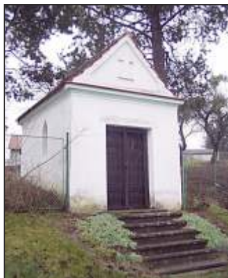
Kaple sv. Kříže z r. 1859 (7)