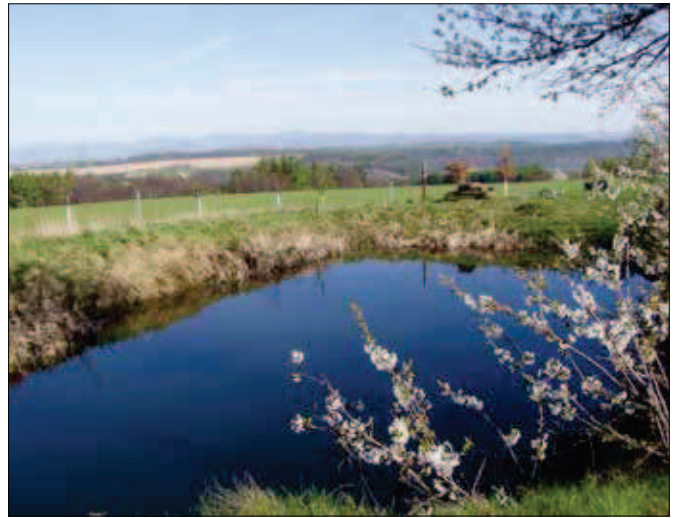
13. Mořské oko - bývalý selský lom zatopený vodou