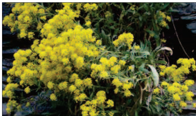
11. V tomto lomu roste chráněná rostlina tařice skalní