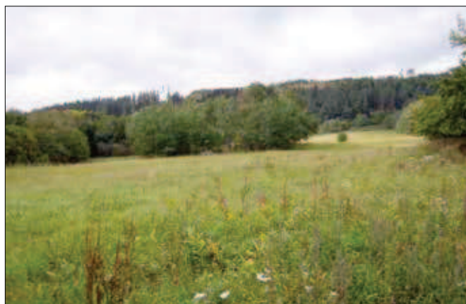
2. Místo zpracování stříbrných rud v Železné bráně