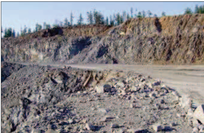
6. Dobývací prostor kamenolomu v Jakubčovicích n. O.