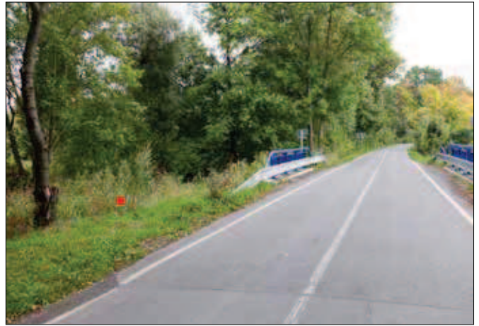
5. Místo bývalé stoupy na zpracování stříbrných rud na náhonu