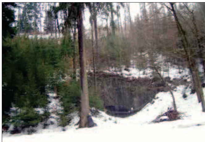
8. Petrova skála u Spálova

V okolí Oder naleznete celou řadu zaniklých menších kamenolomů, které sloužily jako zdroj stavebního kamene např. pro stavbu železnice nebo silnic a v nichž se těžila především hornina zvaná droba. Dva dnes již opuštěné kamenolomy objevíte v lesnatých svazích Nížkého Jeseníku spadajících do Moravské brány. Jeden se nachází po levé straně silnice vedoucí z Veselí do Hynčic nedaleko výše zmiňovaných „důlků“ po těžbě galenitu (9). Druhý byl zřízen na úpatí Pohořského kopce poblíž železničního přejezdu mankovické silnice (10). Další menší lomy jsou roztroušeny po svazích Oderské kotliny, jako např. nalevo u silnice vedoucí z Oder do Pohoře před výjezdem z lesa (11) nebo lom zvaný „Skalka“ nad Odrami nad kamenným vodojemem (12). Skalka byla součástí Jubilejního parku císaře Františka