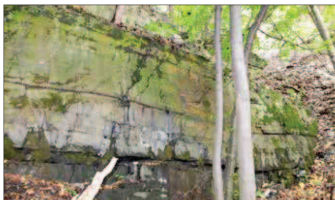
10. Bývalý lom na úpatí Pohořského kopce

Petr Lelek, Historicko-vlastivědný spolek Odry