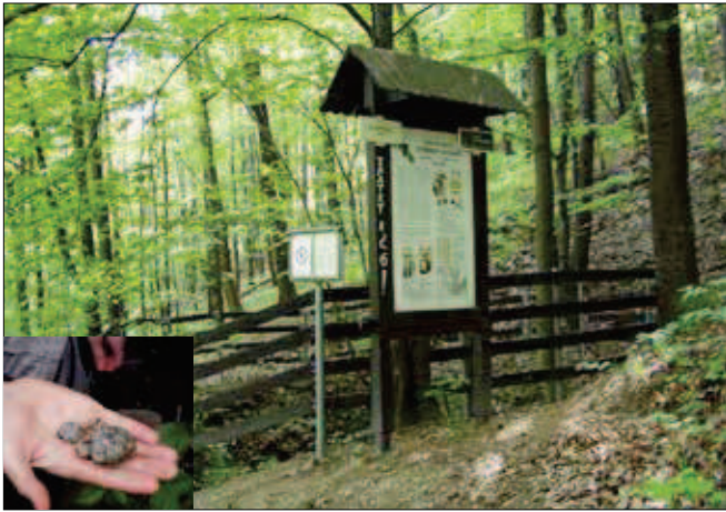
4. Zlatý důl - 7. zastavení naučné stezky Stříbrný chodník a galenit