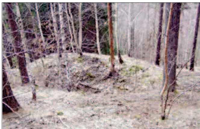
1. Jeden z důlků na Veselském kopci

V okolí Pohoře se nacházejí doly a štoly po největší těžbě stříbrných rud. Jak napovídá předkolonizační uspořádání domů v Pohoří, jedná se o starou hornickou osadu, která v minulosti patřila k fulneckému panství. Těžbu drahých kovů připomínají názvy některých důlních děl - „Stříbrné jezírko“ mezi Pohoří a Jestřabím (3) a „Zlatý důl“ (4) mezi Pohoří a Mankovicemi. Stříbrné jezírko je povrchový důl zatopený povrchovou vodou, čímž zde vznikly optimální podmínky pro výskyt zvláště chráněných rostlin a živočichů. Stříbrné jezírko tak bylo prohlášeno za maloplošné chráněné území - přírodní památku.