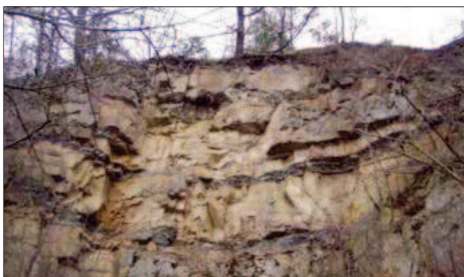
9. Opuštěný lom na úpatí Veselského kopce

V okolí Oder naleznete celou řadu zaniklých menších kamenolomů, které sloužily jako zdroj stavebního kamene např. pro stavbu železnice nebo silnic a v nichž se těžila především hornina zvaná droba. Dva dnes již opuštěné kamenolomy objevíte v lesnatých svazích Nížkého Jeseníku spadajících do Moravské brány. Jeden se nachází po levé straně silnice vedoucí z Veselí do Hynčic nedaleko výše zmiňovaných „důlků“ po těžbě galenitu (9). Druhý byl zřízen na úpatí Pohořského kopce poblíž železničního přejezdu mankovické silnice (10). Další menší lomy jsou roztroušeny po svazích Oderské kotliny, jako např. nalevo u silnice vedoucí z Oder do Pohoře před výjezdem z lesa (11) nebo lom zvaný „Skalka“ nad Odrami nad kamenným vodojemem (12). Skalka byla součástí Jubilejního parku císaře Františka