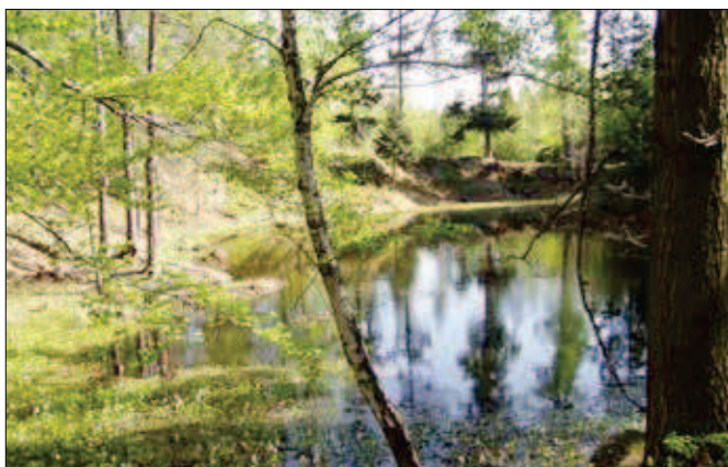
3. Přírodní památka Stříbrné jezírko u Jestřabí