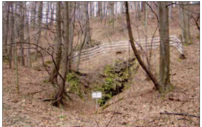
7. Štoly po těžbě pokrývačských břidlic na Veselském kopci

Zlatý důl vzdor svému názvu sloužil k těžbě stříbrné rudy. Galenit je možno i dnes nalézt přirozeně vyrýžovaný ve skalních kapsách lesního potoka protékajícího kolem tohoto dolu. V okolí Zlatého dolu se nacházejí další dvě štoly a s nimi spojené odvaly hlušiny. Zlatý důl a jeho okolí popisují zastavení č. 6 a 7 naučné stezky „Stříbrný chodník“, která začíná i končí ve městě Odry. Stříbrná ruda z této lokality se zřejmě drtila ve stoupě (5) stojící v minulosti na oderském mlýnském náhonu u Emauzského rybníka - poblíž 9. zastavení naučné stezky.