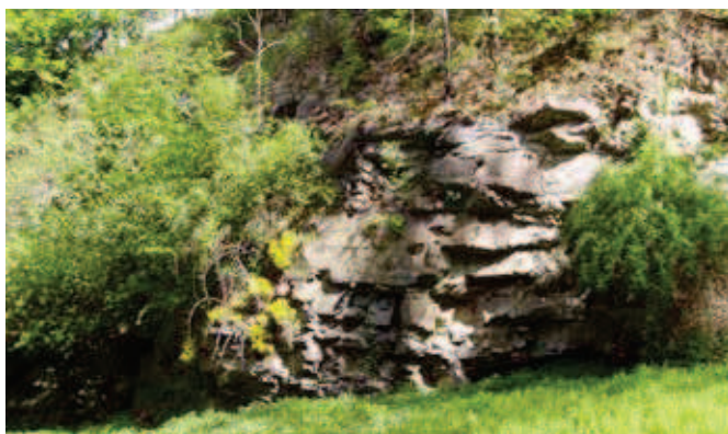
11. Opuštěný lom u pohořké silnice