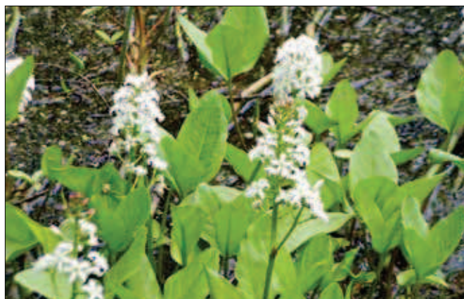
3. Stříbrné jezírko - chráněná rostlina vachta trojlistá