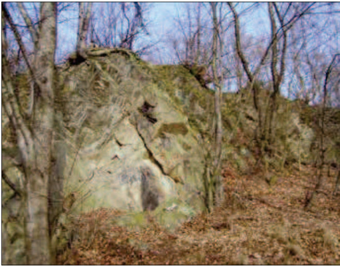
12. Skalka v Odrách nad kamenným vodojemem