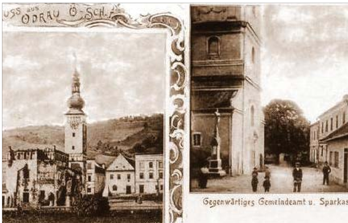
Stará radnice na náměstí zbouraná v roce 1863 (nalevo) a Kostelní ulice s novou úřadovnou starosty a spořitelnou (napravo).