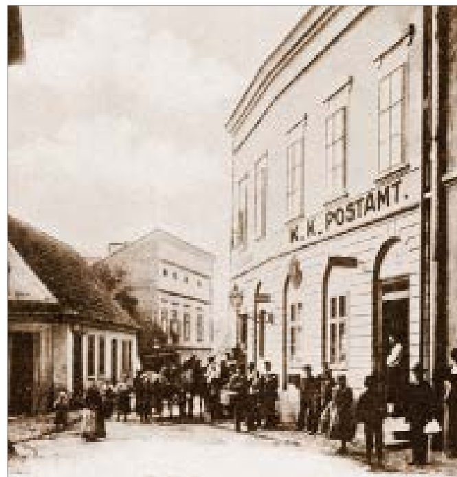
Obr. 5 Odry, pohled do Hranické ulice s poštovním úřadem po pravé straně ulice (dům č. p. 26), dobová fotografie