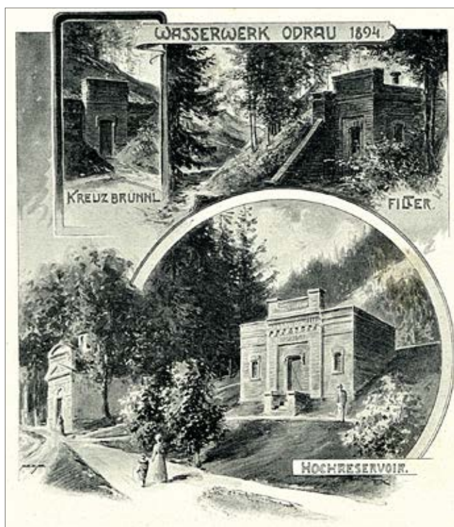
Odry 1894. Stavební prvky vodovodního rozvodu (Křížová studánka, filtr a velký vodojem).