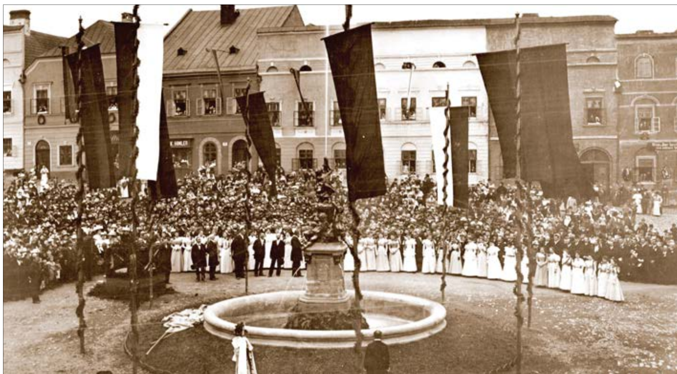
Odry, 26. září 1897. Slavnostní odhalení kašny na náměstí za přítomnosti představitelů města a okresu.