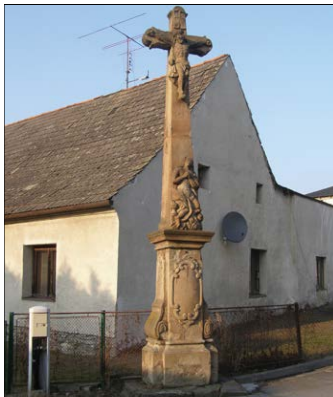
Celkový pohled na kříž v Křížové ulici s domem č. 15

Připomeňme si, co o kříži píše místní historikové Anton Rolleder a Bohumil Fojtík. Rolleder ve své kronice „Dějiny města a soudního okresu Odry“ na straně 361 uvádí: Průtrž mračen 23. 5. 1805 způsobila tak vysokou