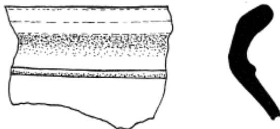
Nákres části okraje keramického hrnce ze 16. století