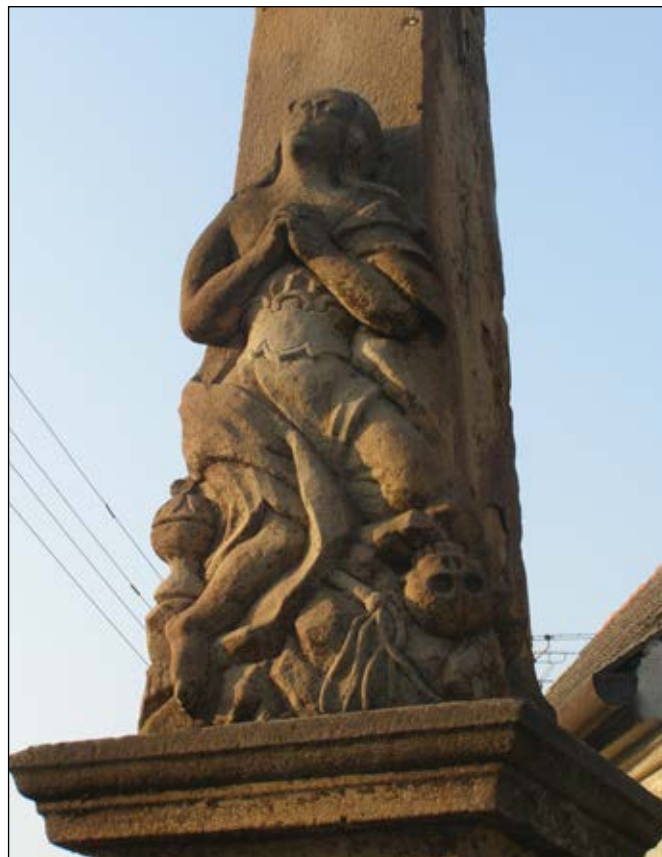
Sv. Máří Magdaléna s atributy pomazání, utrpení a smrti z bočního pohledu

** Vytěsané atributy představují: kalich = poslední pomazání, důtky = symbol utrpení a lebka = symbol smrti