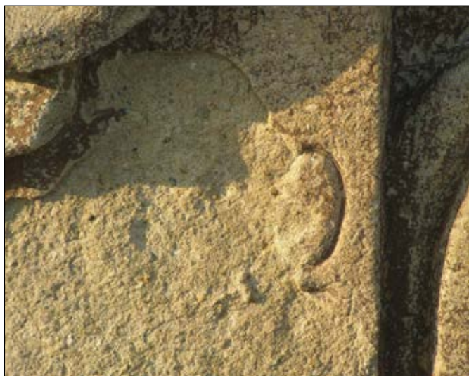
Detail poškozeného vročení se zbytkem číslice 0