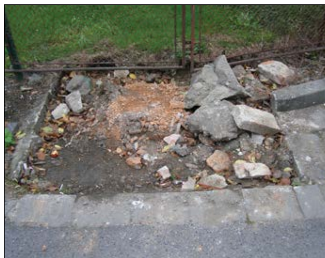
Základ kříže po jeho demontáži 30.11.2013