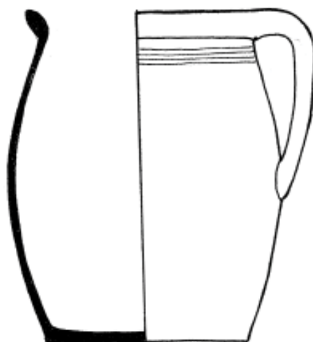
Nákres hrnce s uchem, bílá engoba, okraj zel. glazura - zač. 17. stol.

Webové stránky http://archivnimapy.cuzk.cz/ (indikační skica)