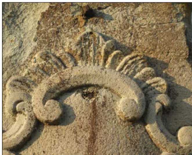
Detail rokaje v horní části kartuše typické pro roky 1745 - 1780