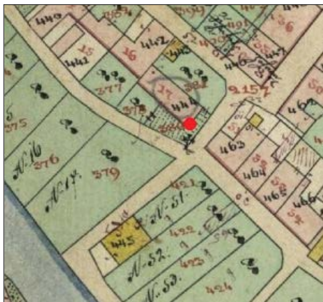
Výřez indikační skice z roku 1836 s vyznačením polohy kříže