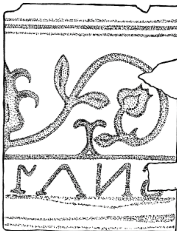
Rozvinutý nákras výzdoby vrcholového kachle s nápisem YANS, zelená glazura, zač. 17. stol