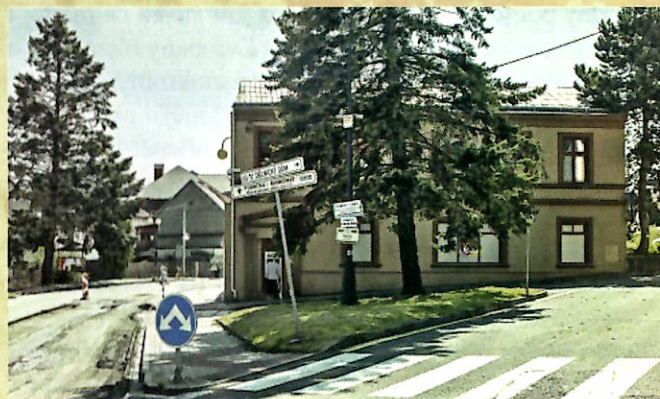
Dům č. p. 100