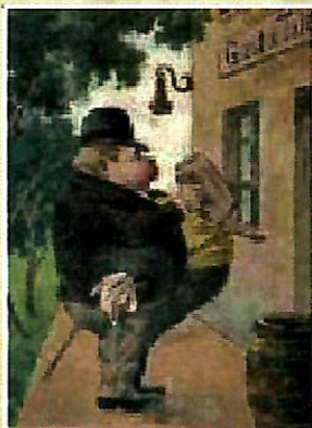
Oderské hospody a šenky

Dům č. p. 100 na ulici 1. Máje (dříve Bahnhofstrasse) je jedním z nejstarších domů, postaveným vně hradeb starého města. Jeho založení lze datovat do 1. poloviny 17. století. Archiválie z roku 1775 ho zaznamenaly ve čtvrti „Obere Vorstadt“ (Horní předměstí) pod č. 2, kdy ho vlastnil Franz Brustmann (*1751) - usedlý měšťan a mistr řeznického cechu. Zápis rovněž uvádí, že v roce 1774 prodával spolu se dvěma řeznickými