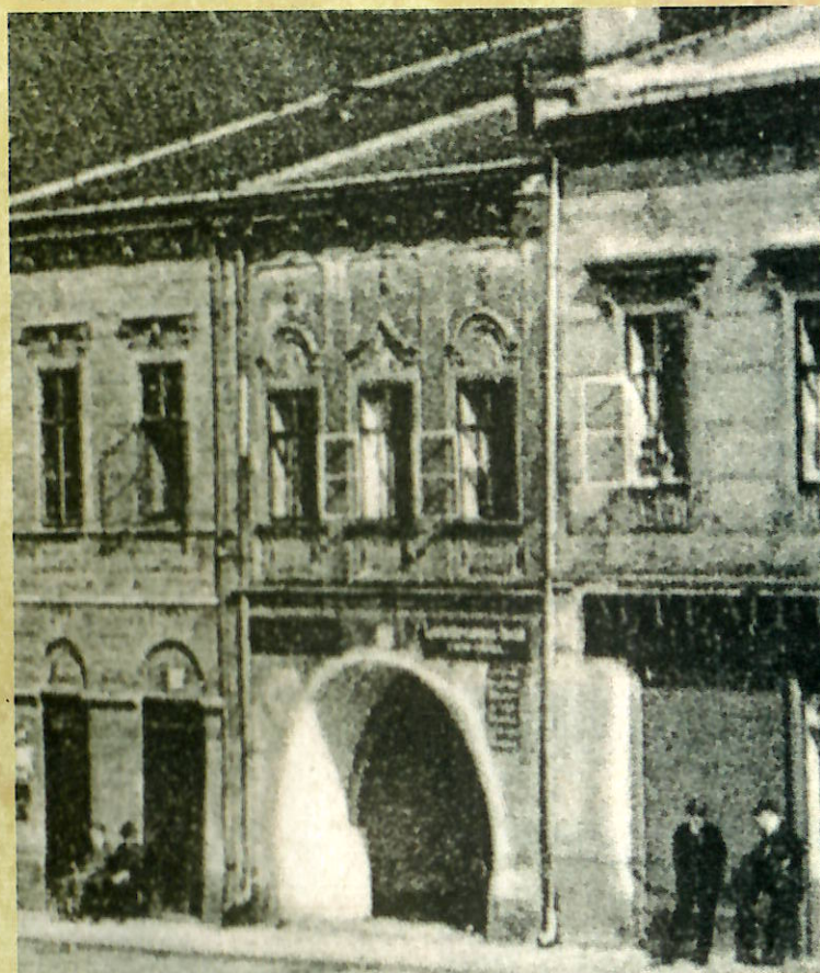
Dům č. p. 18 v roce cca 1910