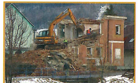
Demolice domu v roce 2017