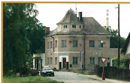
Dům č.p.318 na Skřivánčí ulici, 90. léta 20. století, Muzejní spolek Rolleder, o.p.s.