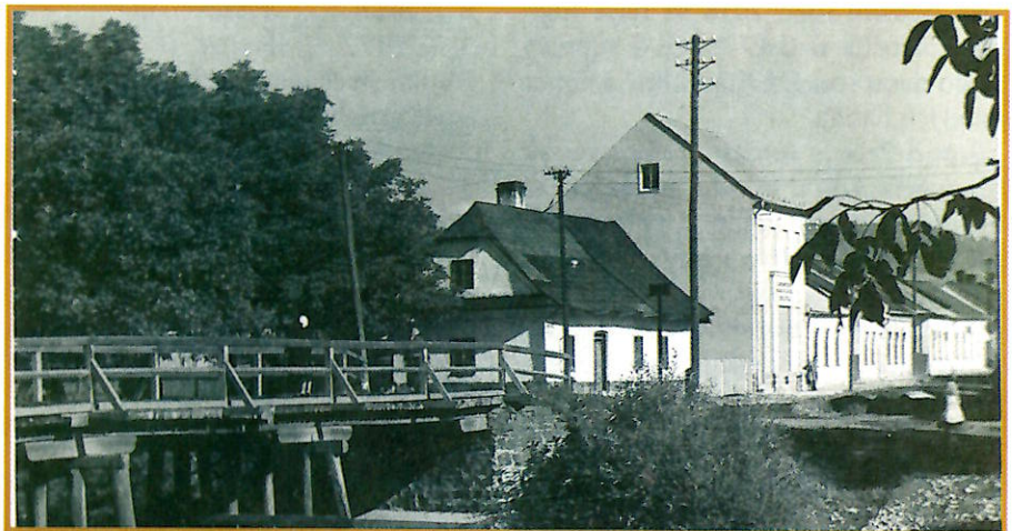
Dobová fotografie. První dům č.p.318. Muzejní spolek Rolleder, o.p.s