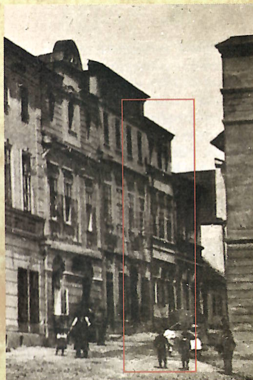
Dům č. p. 40