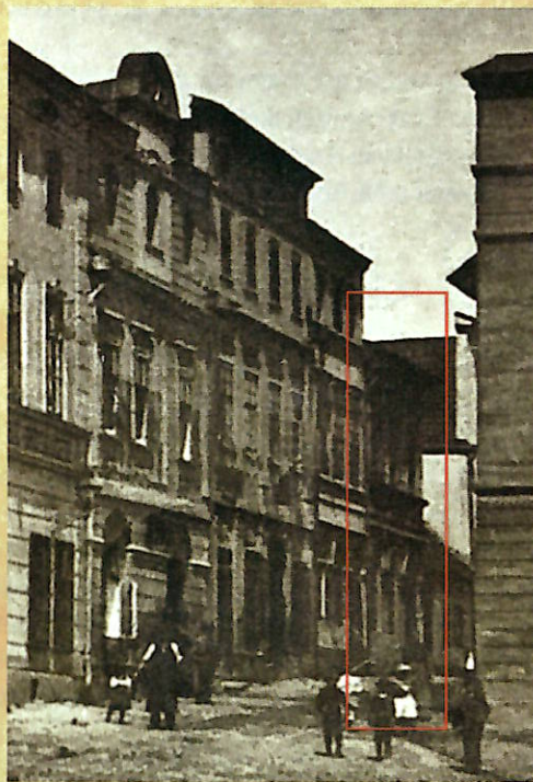
Dům č. p. 41