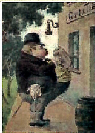
Oderské hospody a šenky