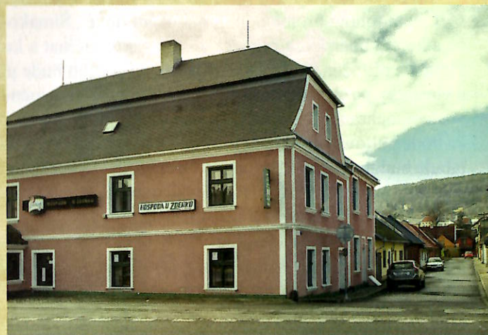
Dům č. p. 43