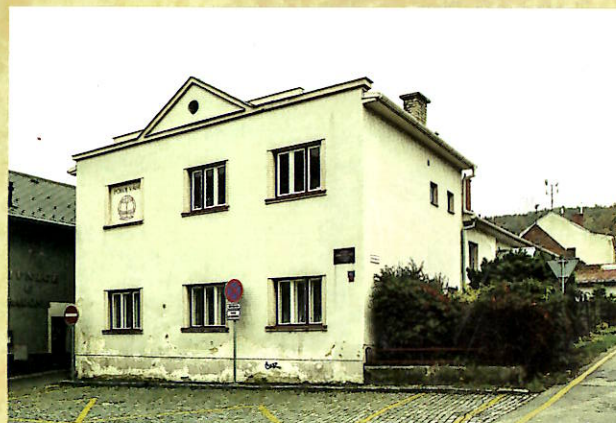
Dům č. p. 63