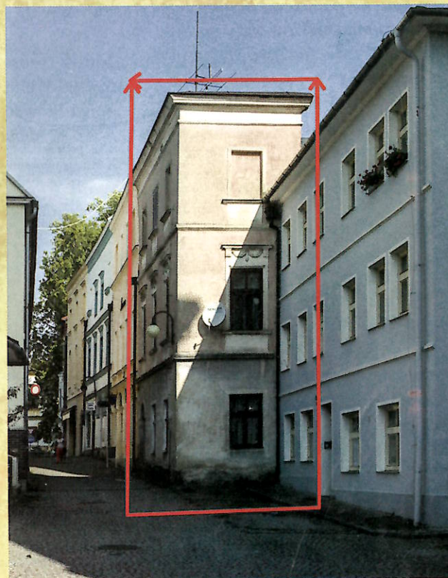
Dům č. p. 8 v roce 2017