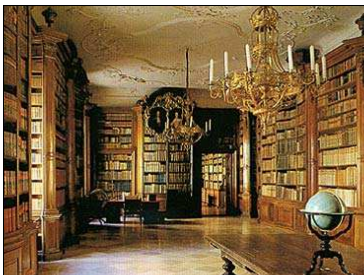
Historická knihovna Tereziánské knihovny I