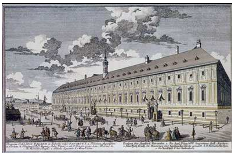
Historická budova Tereziánské akademie ve Vídni