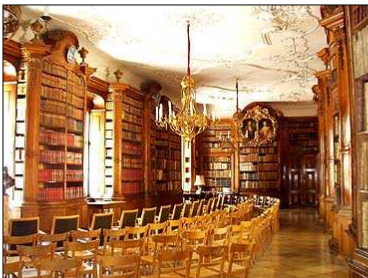
Historická knihovna Tereziánské knihovny 2