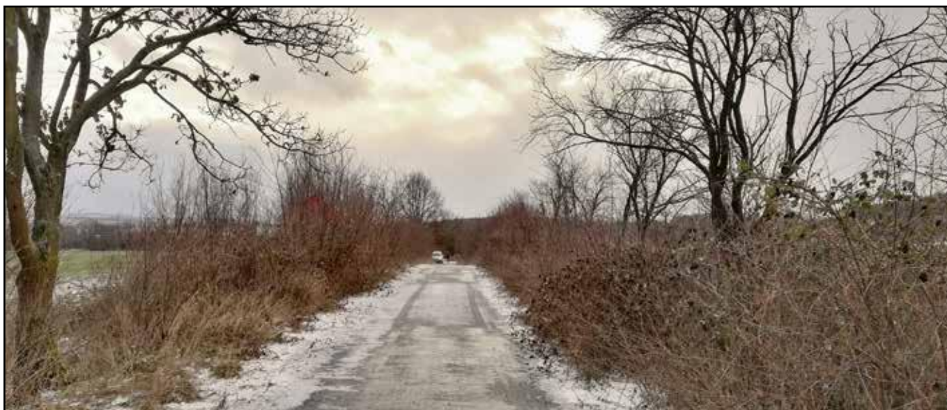
Fragment zachovaného úseku kdysi jedné z hlavních spojovacích cest Moravy a Slezska u bývalé hynčické křižovatky.

Bývalá hynčická křižovatka je opředená podivně strašidelnými pověstmi a pověrami, ve kterých docházelo k divotvorným úkazům, kdy vyplašení a vzpínající se koně nemohli dál.