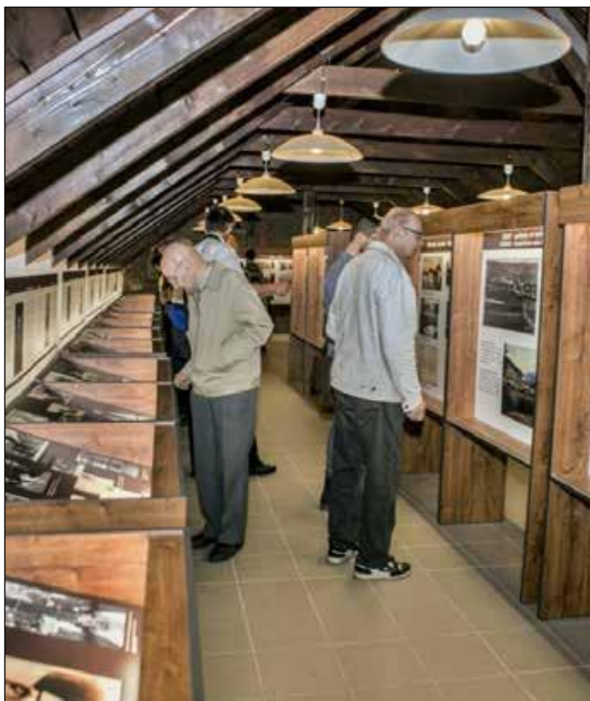
Otevření Muzea česko-německého porozumění.