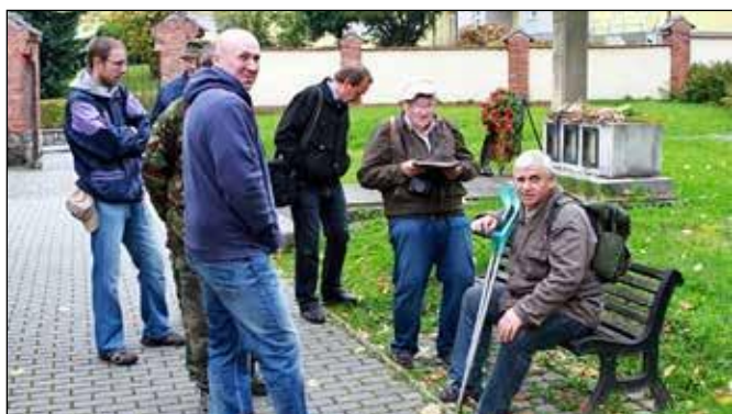
Komentovaná prohlídka oderského hřbitova v roce 2014.