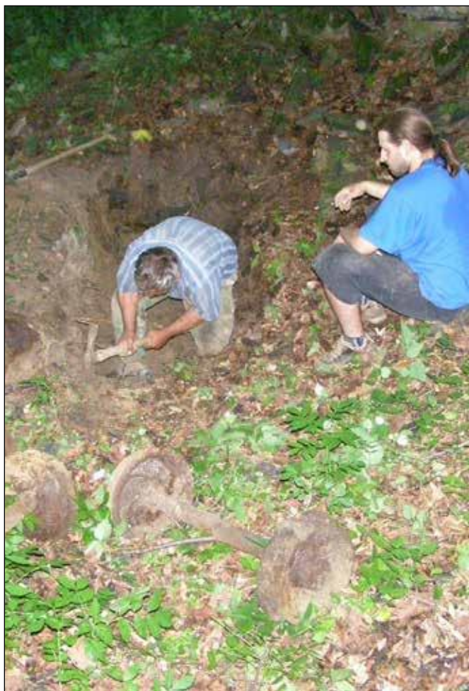
Nález dvojkolí důlního vozíku u Flascharova dolu 2015.