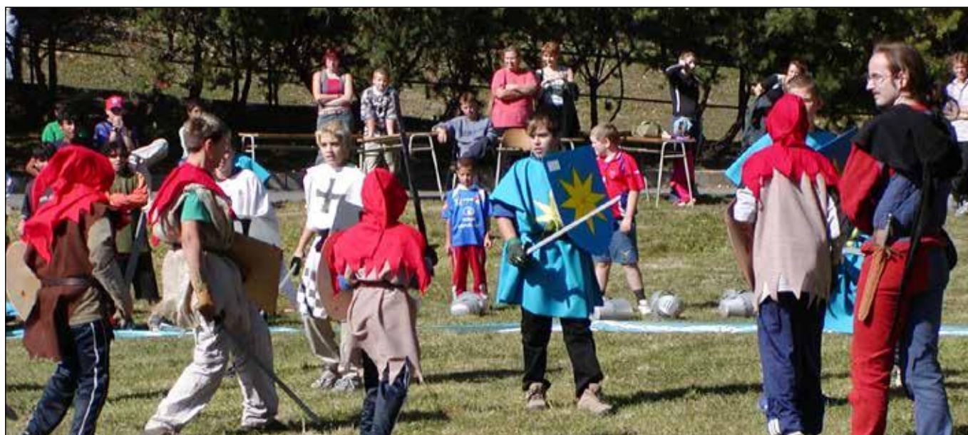
Historické dny v roce 2004.