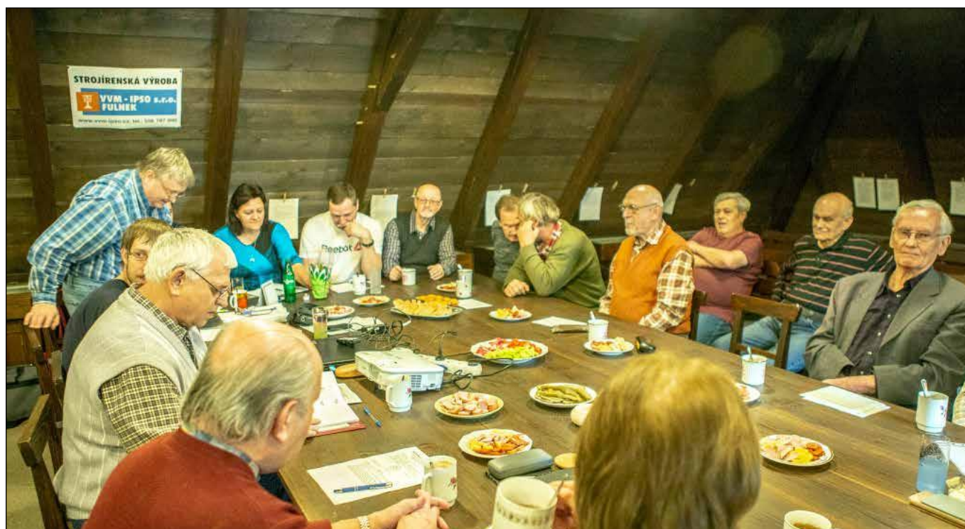
Schůze spolku v roce 2019.