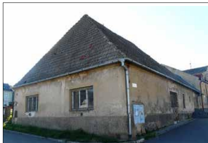
Katovna před rekonstrukcí v roce 2012