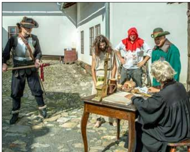
Den s katem v roce 2018.