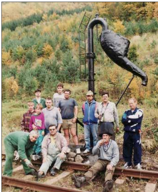
Oprava vodního jeřábu v Klokočově v roce 2000.