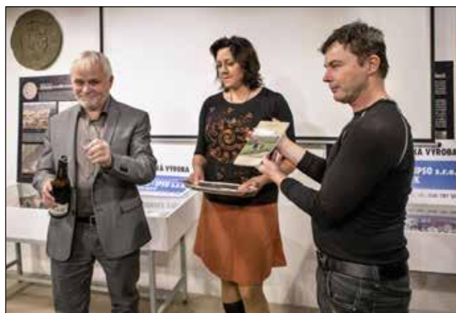
Křest knihy Horní Poodří v roce 2017.

Z publikací, které vydal HVS, můžeme uvést například Kroniku železničních tratí okresu Nový Jičín (1995), Řeka Odra – Evropský veletok (2013), Památky na trase