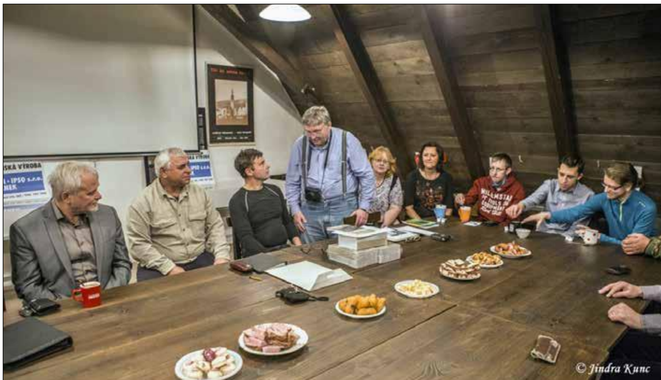
Křest knihy Horní Poodří v roce 2017.