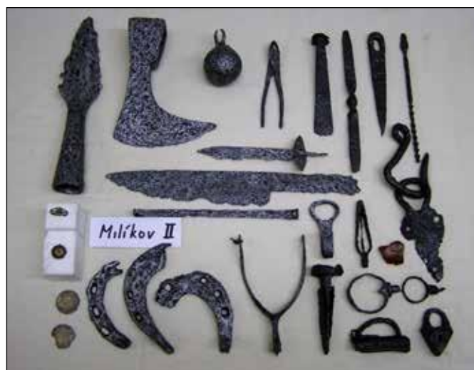
Archeologické nálezy z lokality Babí hrádky.