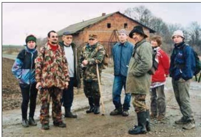
Výprava na Avarskou mohylu v roce 2004.