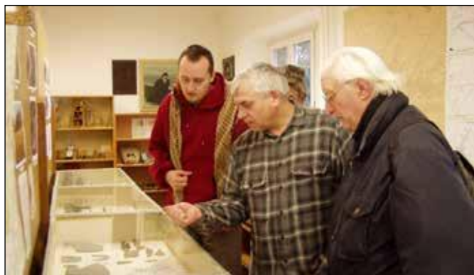
Depozitář v Malé budově ZŠ Komenského v roce 2010.