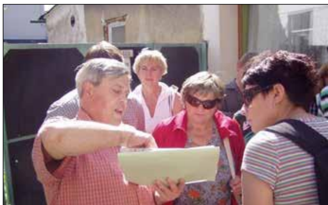
Vlastivědná vycházka za oderskými rodáky v roce 2012.