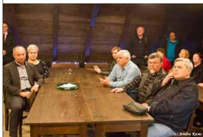
Slavnostní otevření Katovny v roce 2014.