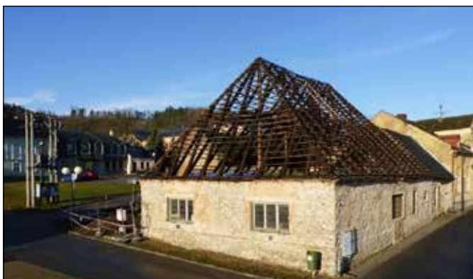
Rekonstrukce Katovny v roce 2013.