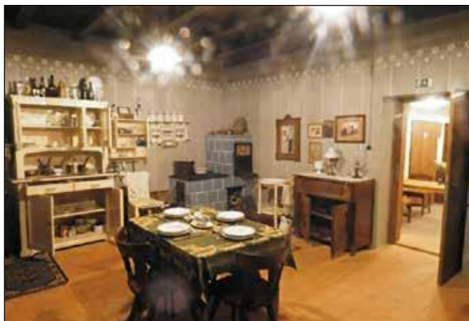
Expozice Muzea česko-německého porozumění.