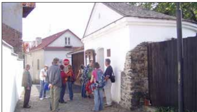
Komentovaná prohlídka u bašty v roce 2009.