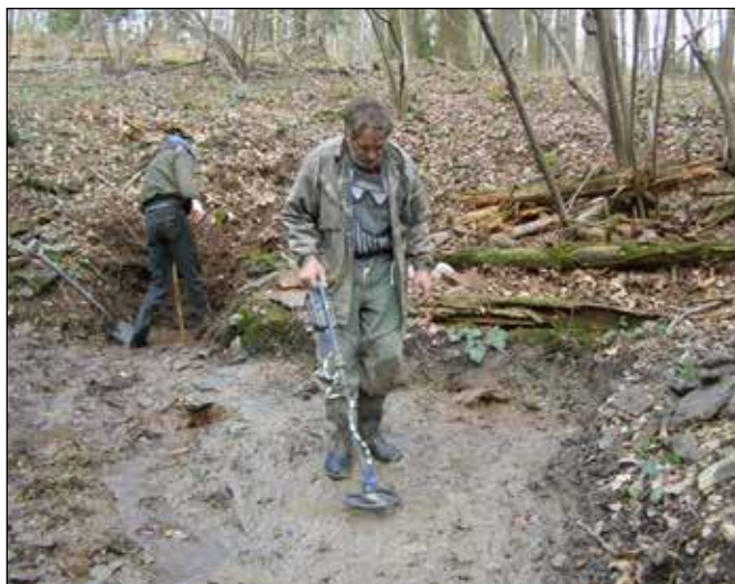
Archeologický průzkum u Koňské studánky v roce 2010.