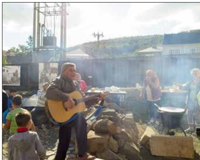
Cikánský perkelt v roce 2019.