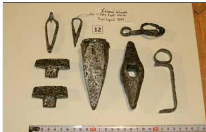
Archeologické nálezy ze Zaječího chodníku 2009.