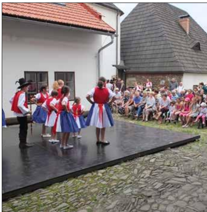
Valašský den v roce 2019.