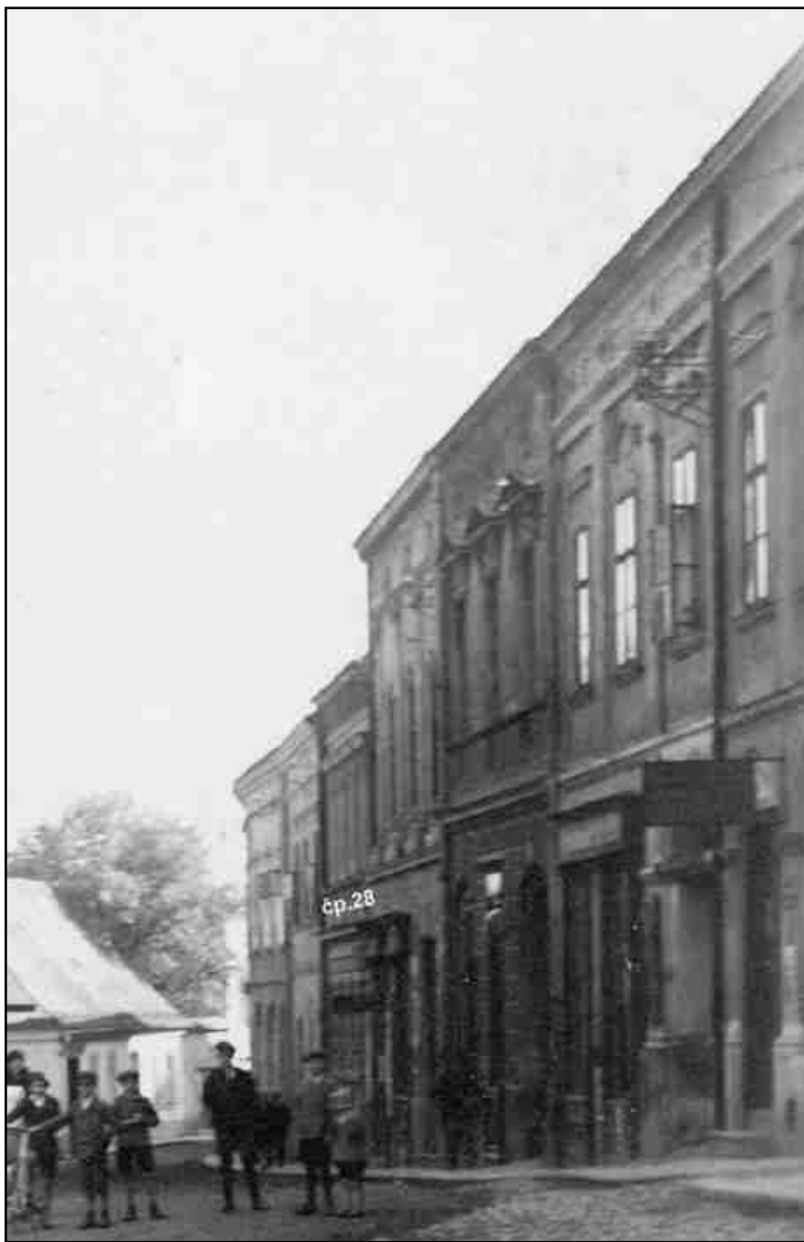
Odrý, 20. léta 20. století. Na pravé straně od konce je třetí dům čp.28 na Hranické ulici.