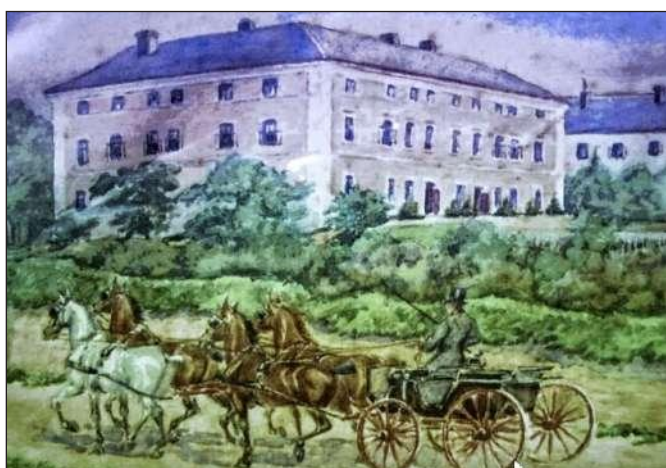
18. století. Fotografie historického obrazu spálovského zámku s okolím.