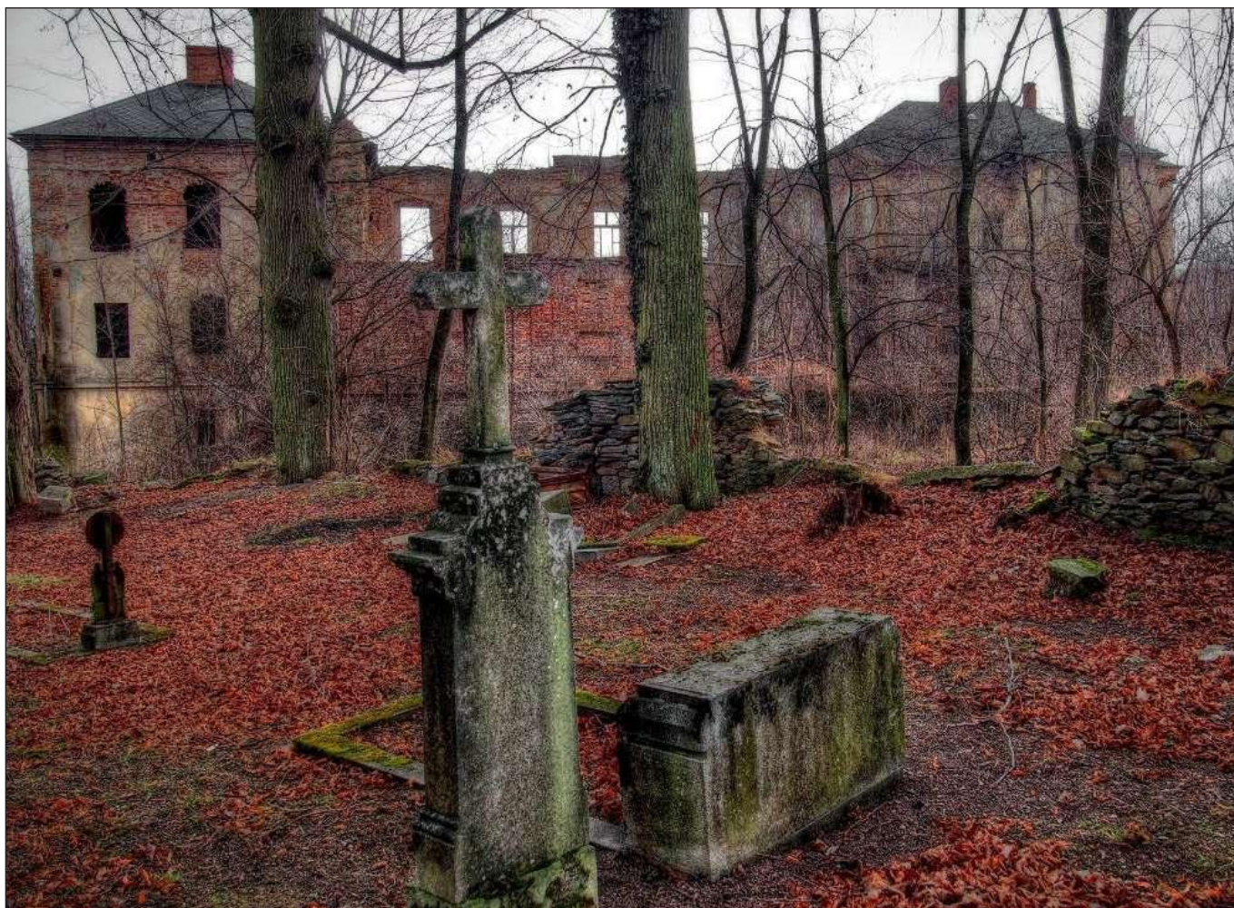
2023, zřícenina zámku v Deštném u Opavy. Pohled od bývalého panského dvora