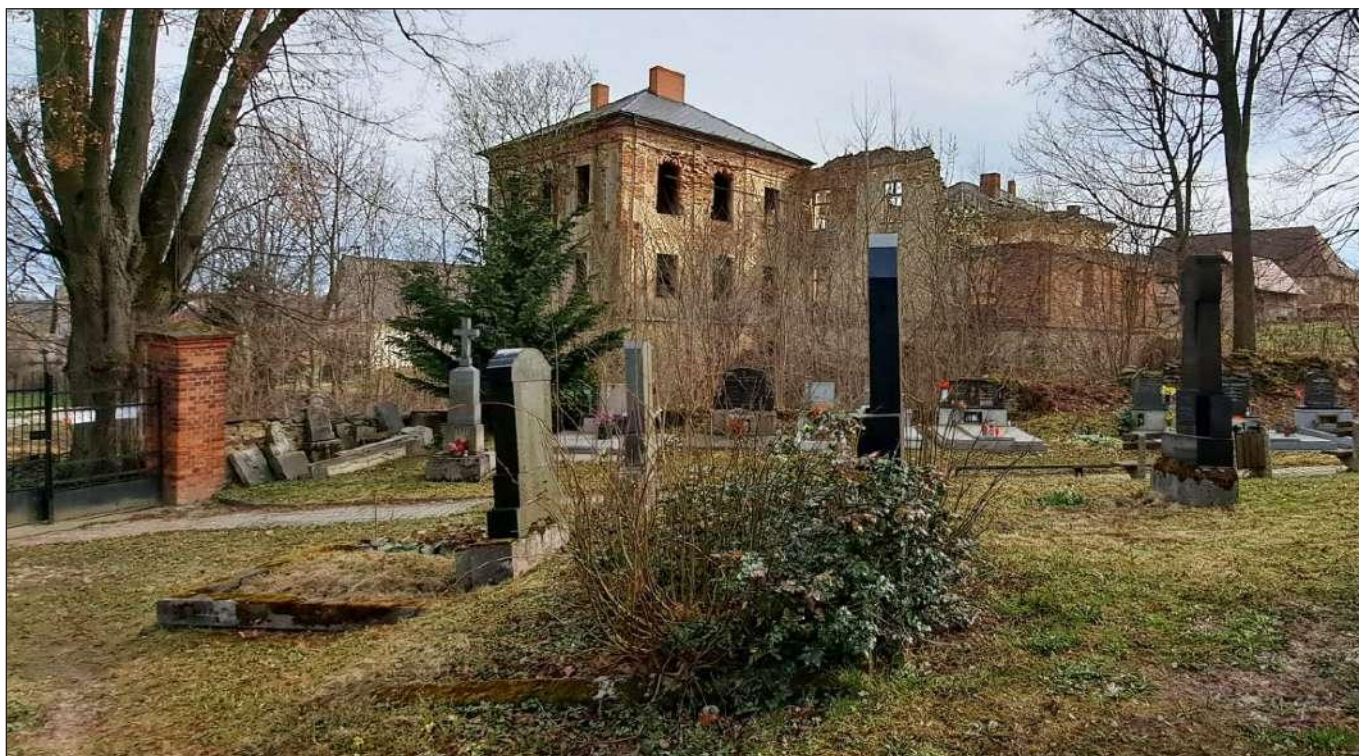
2023, zřícenina zámku v Deštném u Opavy. Pohled od kaple Navštívení Panny Marie, www.mapy.cz