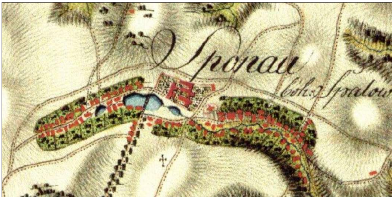
1764 - 1768. Půdorys Spálova, na I. Vojenském mapování. Půdorys zámku je uveden se středním křídlem.