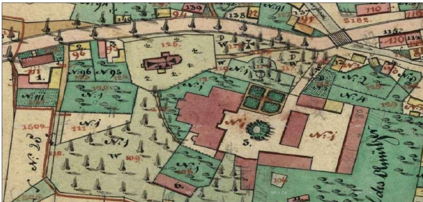
Výřez indikační skicy obce Deštné u Opavy z roku 1836.

vchod do sklepa. V té době zde stála zděná budova jenom jedna a kromě ní byla součástí panského sídla ještě budova dřevěná, vystavěná na zděném přízemí. Stála pravděpodobně na místě dnešního levého křídla (při pohledu ze dvora).