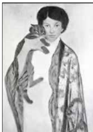
Frida Konstantin Lohwag, autoportrét; wikipedia.org/wiki/Frieda_Konstantin